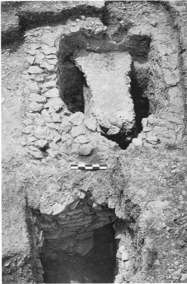
Fig. 2. Vue générale du four BSB 187 D à partir de la fosse d'accès : porte du foyer, sole partielle et porte de chargement à l'arrière.