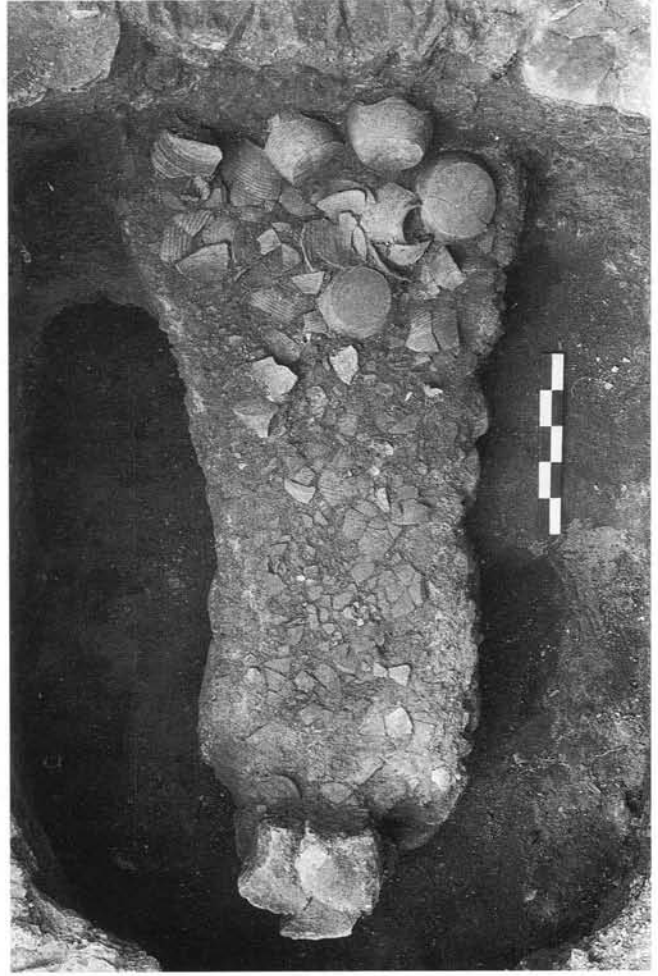
Fig. 3. Amas de pièces écrasées par l'éroulement du four 187 D en fin de cuisson.

La datation par l'archéomagnétisme du four le mieux conservé plaçait son abandon au milieu du XIII e siècle ; une révision récente le rajeunit quelque peu. De nouvelles études de l'archéomagnétisme devraient permettre de préciser davantage ces notions encore bien fluctuantes pour plusieurs sites de la région.