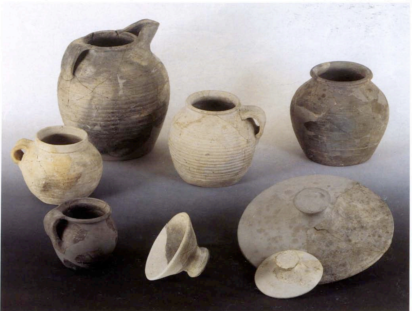
Fig. 4. Pichets, pots et couvercles de l'atelier de Saint-Blaise-de-Bauzon à Bollène.

Les formes à lèvre ronde rassemblant diverses variantes représentent 44 % du lot. Généralement munis d'une anse s'attachant sous la lèvre, ces pots