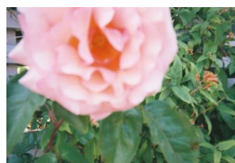
Figure 6.5. Fleurs et assemblages de fleurs (illustrations issues de balluchons à Wilhelmina Gasthuis Terrein, Augustenborg et Bo01)

⇒ deux photos (les deux de droite) sont remplacées par celles-ci :