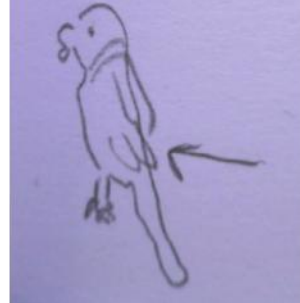
Figure 6.4. Un événement sonore à Wilhelmina Gasthuis Terrein-: le pic-vert qui pique les lanternes ! (illustrations issues de balluchons à Wilhelmina Gasthuis)