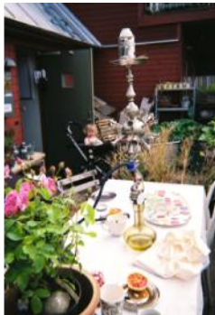
Figure 6.2. Family breakfast et Sunday lunch with friends (Faburel et al., 2011, illustrations issues d'un balluchon à Bo01).