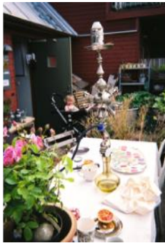
Figure 6.2. Family breakfast et Sunday lunch with friends (Faburel et al., 2011, illustrations issues d'un balluchon à Bo01).