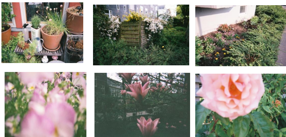
Figure 6.5. Fleurs et assemblages de fleurs (illustrations issues de balluchons à Wilhelmina Gasthuis Terrain, Augustenborg et Bo01)

⇒ deux photos (les deux de droite) sont remplacées par celles-ci :