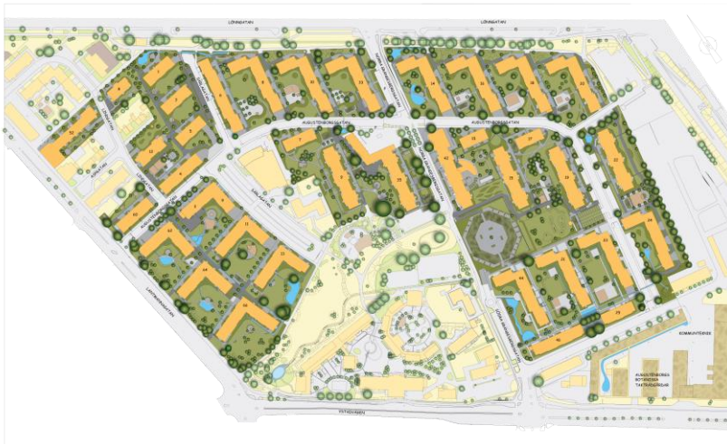
Figure 6.1. Plan d'Augustenborg à Malmö (source : MKB).

Un des premiers groupes de résultats de notre travail est tiré de l'analyse des qualificatifs utilisés, des objets et activités reliés pour exprimer les paysages et le sensible. Selon l'analyse du corpus recueilli 1 , le paysage renvoie avant tout à une matérialité palpable de l'espace vécu. Loin de la seule architecture locale, il a ici souvent un caractère naturel (re)marqué, surtout représenté par la verdure mais aussi par la présence de l'eau et d'animaux. Le rôle du grand paysage est également prégnant dans les qualifications données, et sous-tend alors l'existence d'espaces ouverts plus ou moins aménagés (prairie, littoral, colline...), propres à plusieurs des cas d'étude (figure 6.1).