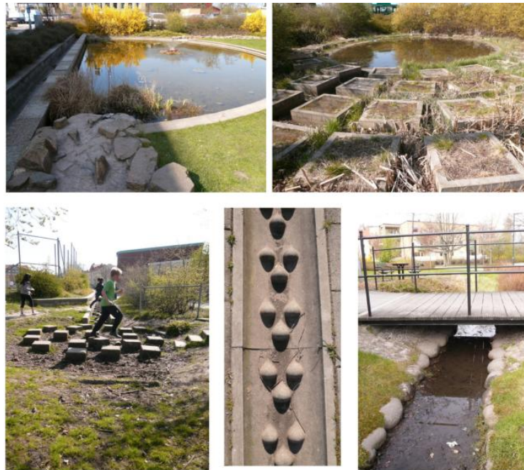
Figure 6.7. La place accordée à l'eau à Augustenborg (Faburel et al. , 2011 ; Manola, 2012).

non seulement des ressentis multisensoriels existent, mais surtout que le paysage fait sens et que des marqueurs sont communs, quitte à standardiser quelque peu les percepts ( supra ). En fait, si « une écologie sensible s'impose (...) à côté de paramètres plus abstraits (consommations d'énergie, d'eau, émissions de CO 2 , etc.). Elle s'affirme de manière presque incidente, souvent dans le sillage d'exigences techniques : la gestion des eaux pluviales à ciel ouvert, en particulier, perméabilise les sols et métamorphose les paysages. » (Emelianoff, 2007, p. 23), Cela est fort bien illustré à Augustenborg (figure 6.7) mais aussi dans les autres quartiers où le traitement des eaux de pluie en surface influe grandement sur les perceptions sensorielles.