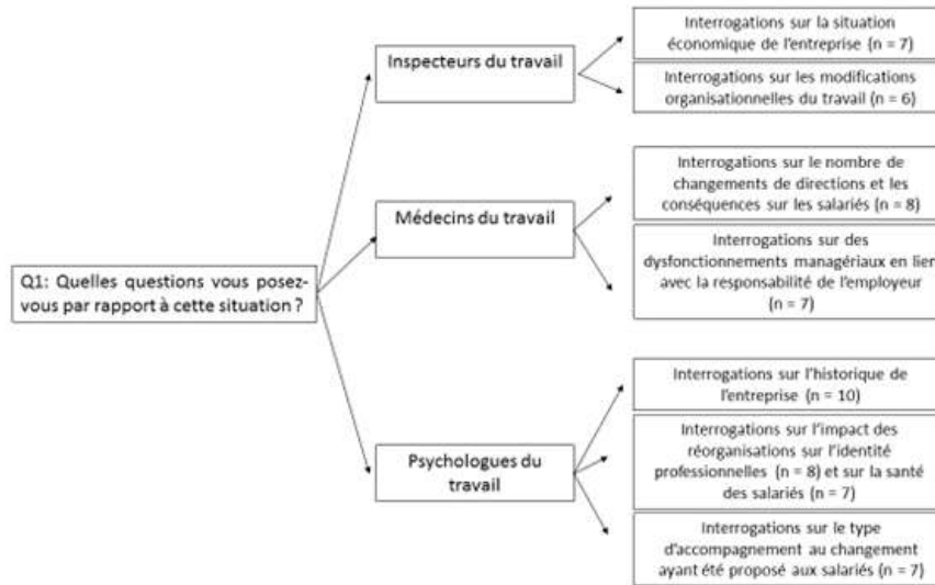
Figure 1. Réponses à la question 1