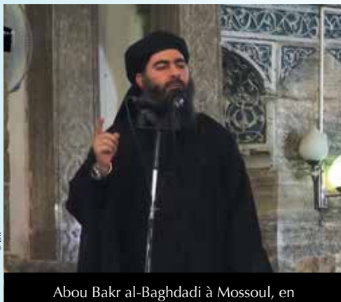
Abou Bakr al-Baghdadi à Mossoul, en

Qui sont les chefs de l'organisation de l'État islamique ? Comment s'organise-t-elle pour gérer les territoires qu'elle occupe ? En l'absence de récits journalistiques précis et malgré les rares témoignages de civils, il est très difficile de répondre à ces questions. Toutefois, on peut identifier les principales structures du pouvoir s'organisant autour de la personne Abou Bakr al-Baghdadi, autoproclamé « calife » en juin 2014. L'organigramme ci-dessous tente de hiérarchiser les données disponibles.