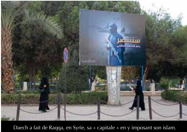
Daech a fait de Raqqa, en Syrie, sa « capitale » en y imposant son islam.

Le noyau dur de l'élite de Daech, des membres du « cabinet », des gouverneurs de provinces (les « émirs ») et des juges islamiques de haut rang ( qadis ), tous des chefs expérimentés mêlant officiers et djihadistes de longue date, forme la Choura, le conseil politique, religieux et militaire de l'organisation. Elle fixe les orientations du mouvement, valide les allégeances et a approuvé le rétablissement du califat en juillet 2014 et la nomination d'Al-Baghdadi. Toutes les déclarations officielles de l'EI sont signées au nom de la Choura. Elle intègre des muftis ou des oulémas afin d'obtenir une légitimité religieuse. Mais cette élite n'est pas nécessairement maniable, car elle ne peut transiger avec le droit islamique. Certains experts de l'EI assurent même que le rétablissement du califat n'était pas souhaité par la Choura (4).