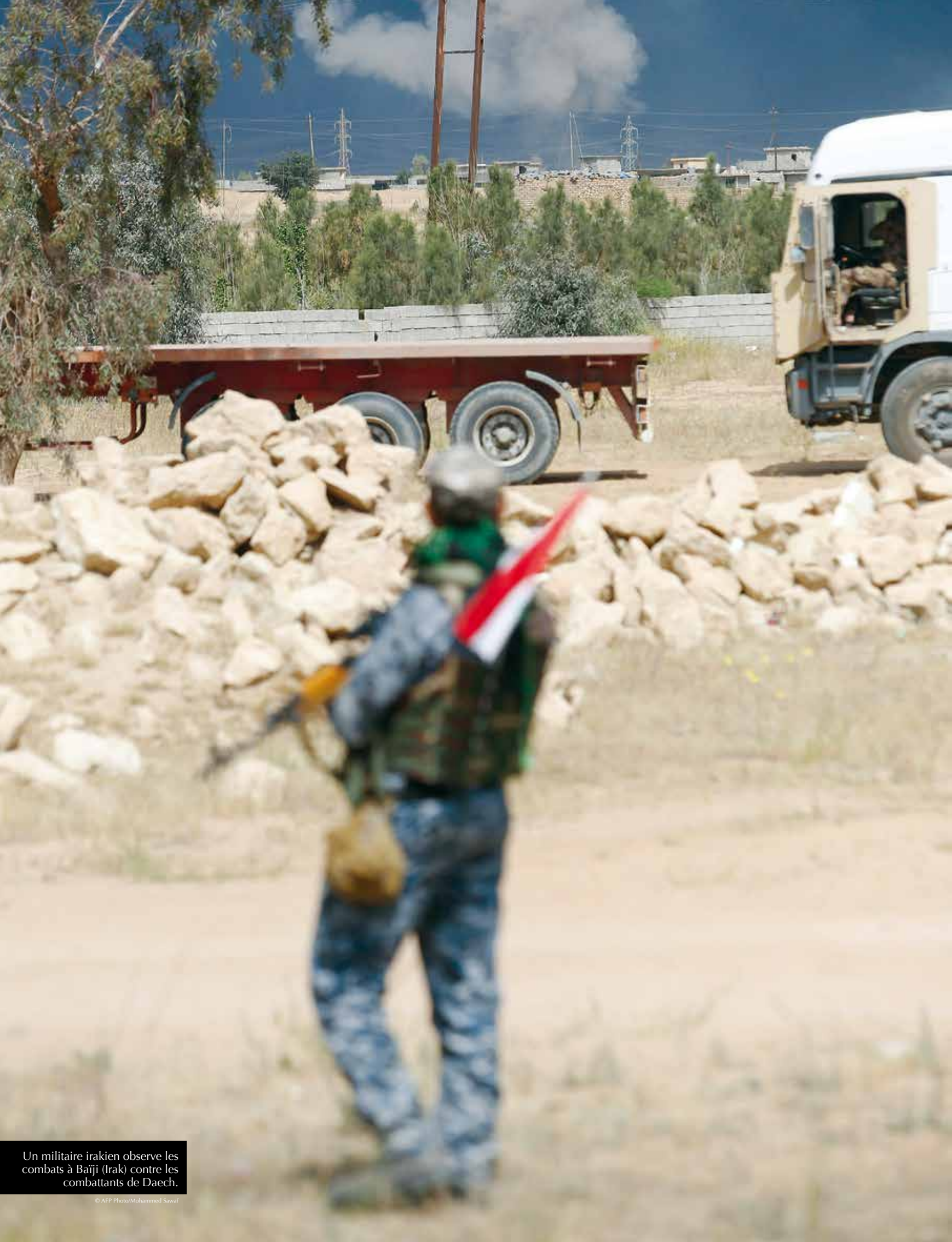
Un militaire irakien observe les combats à Baiji (Irak) contre les combattants de Daech.