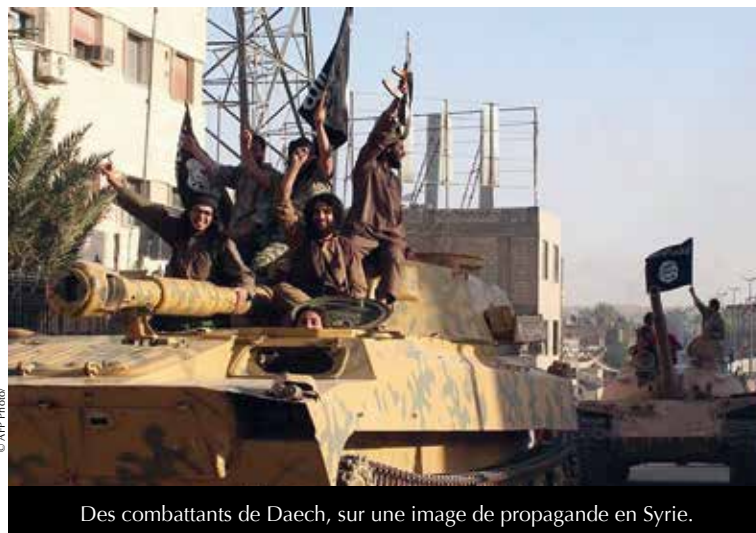
Des combattants de Daech, sur une image de propagande en Syrie.