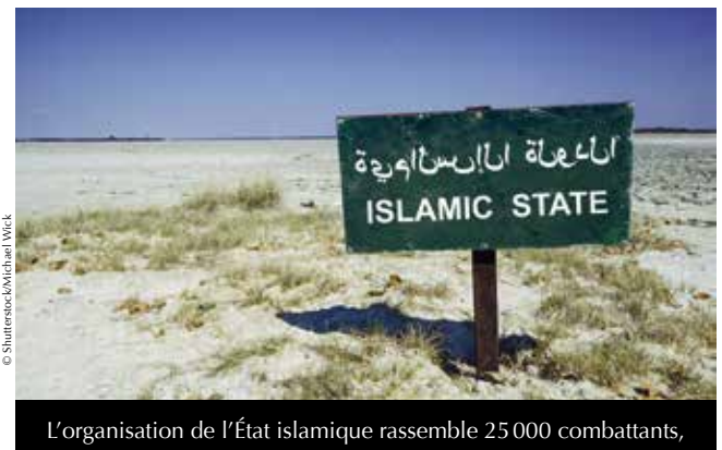
L'organisation de l'État islamique rassemble 25 000 combattants,

Pourtant, les hommes de la Hisba ne sont pas assez nombreux – 200 approximativement à Deir ez-Zor pour quelque