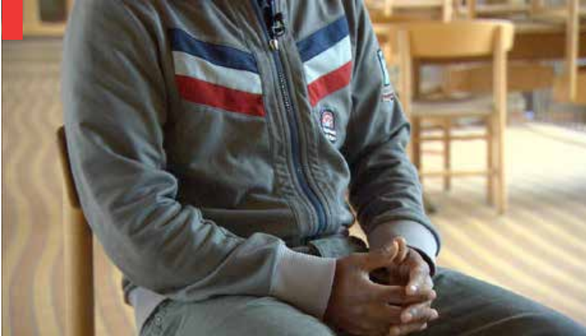
Un travail social à Aarhus, Danemark. L'approche choisie par la ville est de réintégrer, pas de condamner.