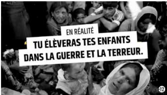
Image d'un clip produit par stop-djihadisme.gouv.fr. Celle-ci répond à la séquence suivante : « Ils te disent : Viens fonder une famille avec un de nos héros ».