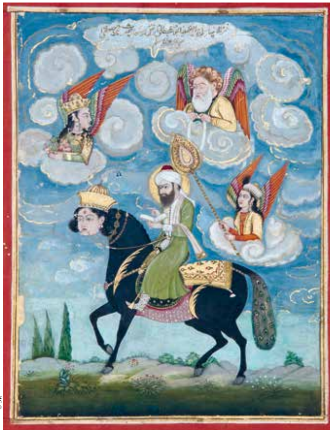
Selon l'histoire coranique, Allah emporta Mahomet sur Buraq, un cheval à tête de femme, vers les cieux. Peinture du XVIII e siècle.

Les références au christianisme de langue syriaque et arabe sont frappantes dans les sourates mecquoises (2), la sira et les hadith (3). L'entourage de Mahomet lui aurait fourni des éléments sur la doctrine chrétienne, enrichis par ses propres voyages et sa curiosité. Mais le christianisme coranique revêt des formes hérétiques, Mahomet se désintéressant des Rum , c'est-à-dire des Byzantins orthodoxes. D'après la sira , il rencontra plusieurs chrétiens avant sa prédication : le prêtre Waraqa ibn Nawfal, cousin de son épouse Khadija, les moines Bahira et Nastour, tous liés à des sectes hétérodoxes. Les erreurs chrétiennes dénoncées par le Coran sont des déformations de doctrines monophysites ou nestoriques (4). La sira certifie que ces chrétiens se convertirent à l'islam ou reconnurent en Mahomet un prophète. Les