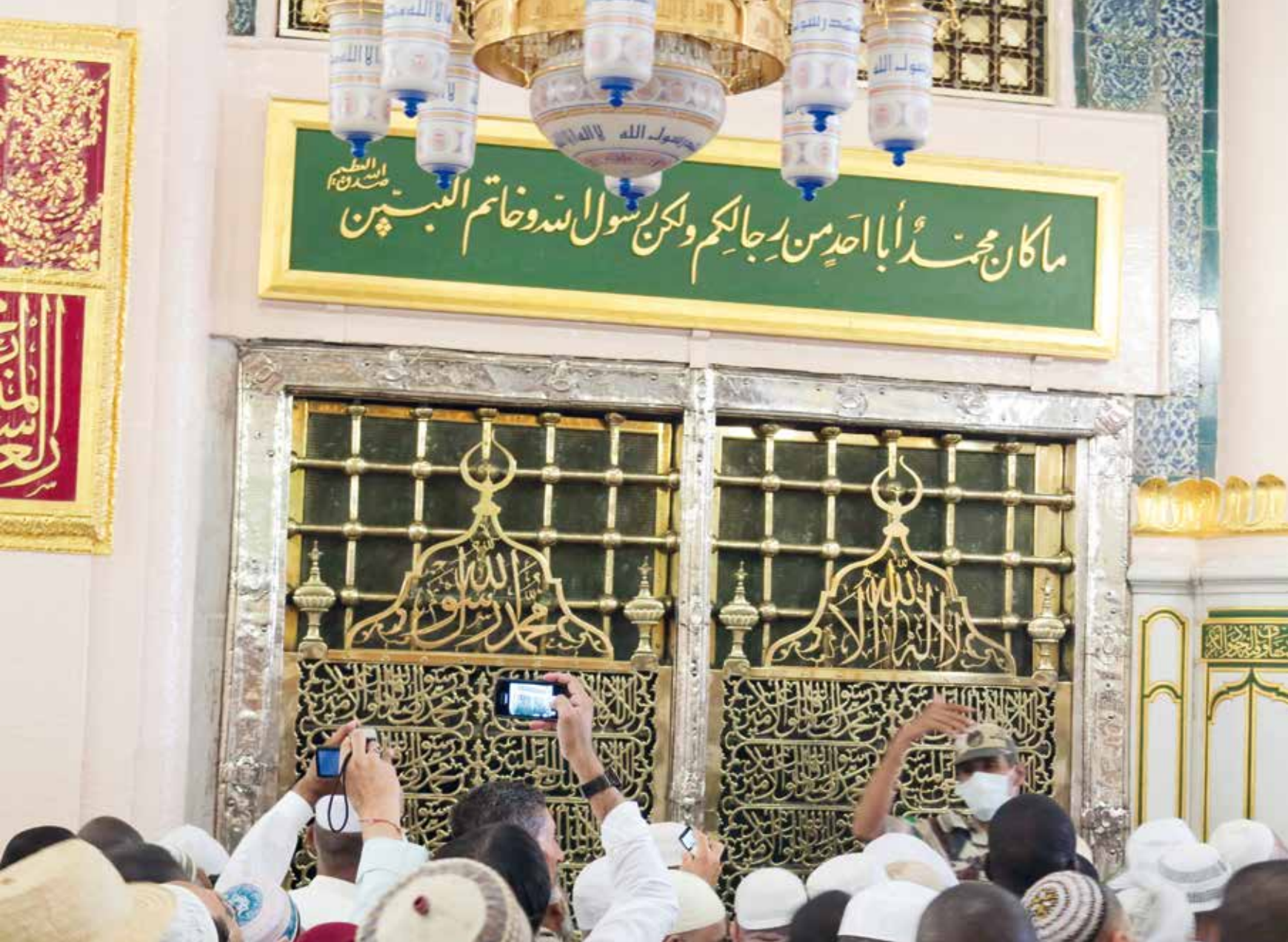
Cette image montre le lieu supposé où repose le corps de Mahomet, situé dans la mosquée du Prophète à Médine, en Arabie saoudite.