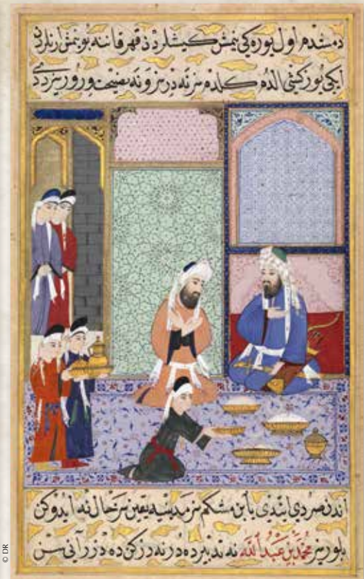
À la fin du XVI e siècle, le sultan ottoman Mourad III (1574-1595) ordonna l'illustration de la Siyer-i Nebi , narration turque de la vie de Mahomet écrite au XIV e . Elle fut terminée en 1595 et contient un total de 814 images, comme les quatre ici présentées. De gauche à droite, on peut voir le Prophète sur le mont Hira (le visage voilé), où il reçut les premières révélations en 610 ; lors de la bataille de Badr en 624, puis à celle d'Uhud, où ses troupes furent vaincues l'année suivante. L'ouvrage présentait aussi des scènes de la vie quotidienne.