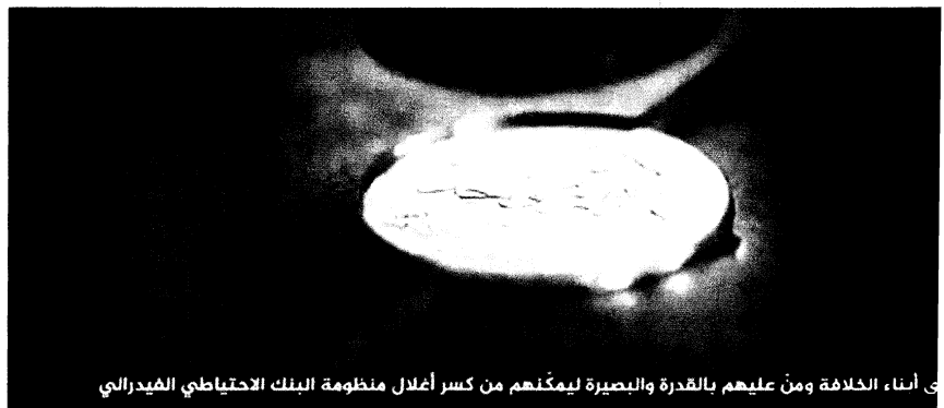
ي أناء الخلافة ومن عليهم بالقدرة والبصيرة ليتمكنهم من كسر أغلال منظومة البنك الاحتياطي الفيدرالي

En utilisant toutes ces références anciennes, et en annonçant le retour du Mahdî , le « bien guidé » de la fin des temps, Daech se présente comme un État qui réunit l'Histoire et accélère le