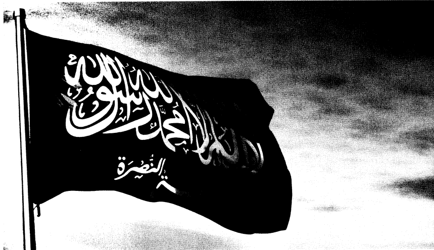
Photo ci-dessus : Drapeau du Front al-Nosra, un groupe armé salafiste djihadiste qui combat essentiellement dans le Nord-Ouest de la Syrie et constitue l'un des principaux acteurs de la guerre civile syrienne. Après avoir été provisoirement alliée à l'État islamique, l'organisation s'est alliée à Al-Qaïda en 2013. Elle prône une société reposant sur les lois de la charia et la mise en place d'un califat en Syrie, considérant la démocratie comme « la religion des impies ».

d'assumer la revanche. L'appareil militaire de Daech est ainsi peuplé d'anciens officiers irakiens issus du parti Baas, laïc et nationaliste, dirigé autrefois par Saddam Hussein. Même s'il s'en détache, le djihadisme actuel a été imprégné par les espoirs suscités par le nationalisme arabe au XX e siècle. La constitution du parti Baas de 1947, bien que laïque et non confessionnelle, a inspiré de nombreux résistants irakiens à l'occupation américaine, passés dans les rangs de Daech : « La patrie arabe forme une unité politique et économique indivisible ». La théorie religieuse de Daech, antinationaliste, antitribale, cosmopolite, ne doit pas tromper : l'organisation n'a vaincu en Irak qu'en raison de la nostalgie de l'État. Avant d'être mondialiste sous l'action d'Al-Qaïda, le djihadisme avait une double dimension révolutionnaire et nationaliste, à la manière du maoïsme ou du stalinisme, comme le prouvent les attentats pro-palestiniens des années 1960-1980.