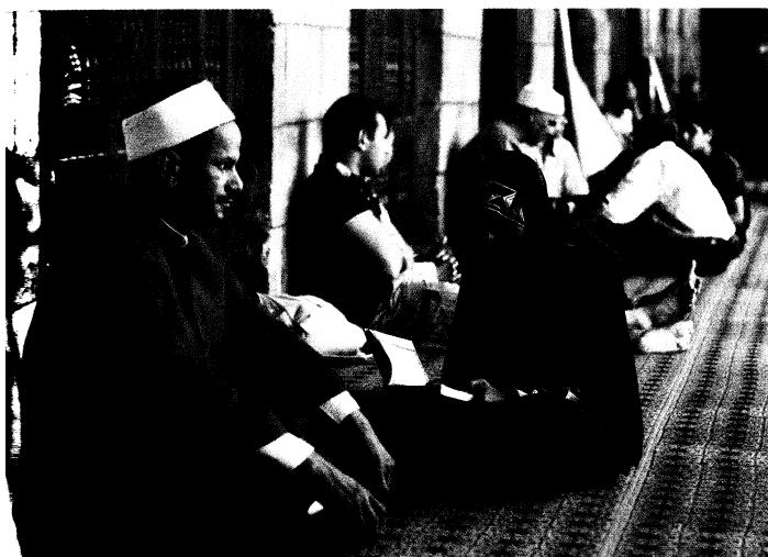
Photo ci-dessus : Traditionnellement, la hijra fait référence à une migration pacifique des musulmans en direction de terres leur permettant de se libérer des persécutions. En faisant un appel à la hijra , et en l'associant à la prise des armes, l'État islamique détourne le terme de son sens premier pour en faire un puissant outil de radicalisation et d'embrigadement de musulmans aux quatre coins du monde.

N'étant nullement reconnu, Daech n'est à l'heure actuelle qu'un proto-État, entouré d'ennemis, peu viable à long terme, assimilable à un totalitarisme par son ultra-violence. Les territoires qu'il contrôle au Moyen-Orient n'ont de frontières que militaires, nombreuses sont les localités qui lui échappent au sein même de ses zones. Ses katiḡas profitent d'une grande autonomie, et nul ne sait quel est le pouvoir effectif d'Al-Baghdādi sur l'ensemble de cette construction hétéroclite. La guerre en cours sur ses marges