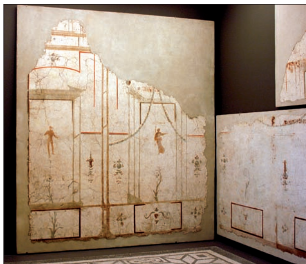
Fig. 1 - Domus sous la Piazza dei Cinquecento , pièce E8, décor recomposé au Palazzo Massimo alle Terme, photo M. Carrive; publié sur concession du Ministero per i Beni e le Attività Culturali – Soprintendenza Speciale per i Beni Archeologici di Roma.

l'on assiste à une démultiplication des unités 10 ; la correspondance entre zone inférieure et zone médiane n'est plus toujours respectée 11 ; les séquences de panneaux dépassent souvent le cadre de la paroi, un panneau pouvant s'étendre sur le mur adjacent 12 ; les éléments architecturaux subsistent mais sont la plupart du temps vidés de leur substance pour jouer le rôle de simples éléments d'encadrement 13 ; la symétrie n'est plus toujours de mise, les figures sont parfois décentrées 14 ... S'agit-il là des conséquences de la perte progressive de certains modèles et savoir-faire liée au fait que, comme nous le disions plus haut, la peinture murale a été, dès le début du I er siècle, délaissée par les commanditaires les plus riches et les plus ambitieux ? Ou bien faut-il y voir également une réaction consciente, « la déstructuration voulue