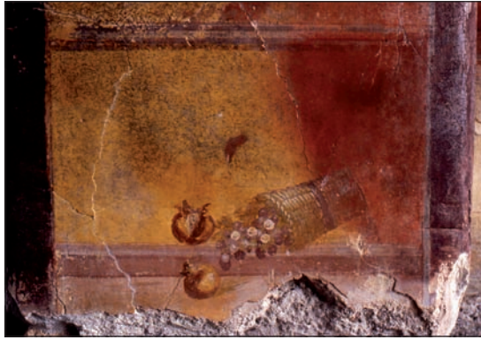
Fig. 2 - Villa maritime de Marina di S. Nicola (Ladispoli), pièce 6, mur nord, photo X. Lafon – École Française de Rome.

de tout un système décoratif », pour reprendre les termes d'I. Baldassare (Baldassare et al. 2003, p. 279) ?