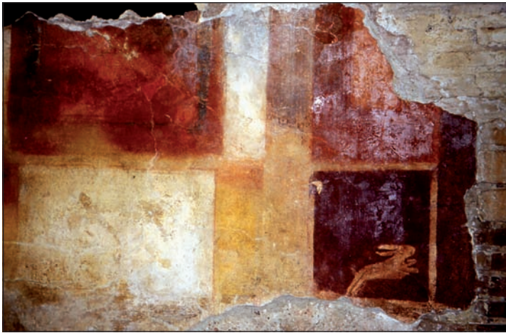
Fig. 3 - Villa maritime de Marina di S. Nicola (Ladispoli), pièce 6, mur ouest, photo X. Lafon – École Française de Rome.

Il y aurait donc ici un jeu délibéré avec le cliché, presque un clin d'œil : raisins et grenades se situent sur un mur et le lapin s'acharne depuis des siècles à essayer de les rejoindre. Il s'agit bien sûr d'un exemple ponctuel mais qui témoigne d'une vive conscience des modèles antérieurs avec lesquels jouent les peintres.