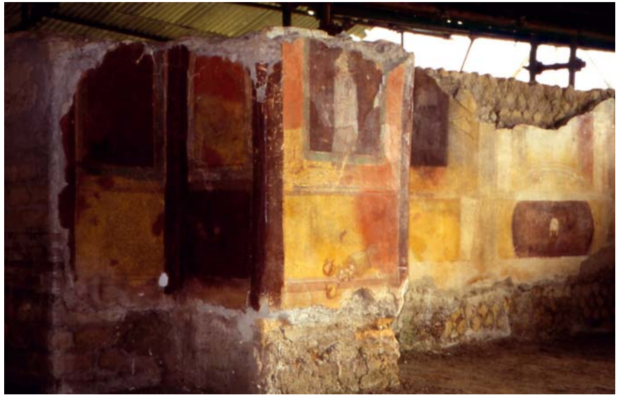
Abb. 2: Pièce 6, mur nord