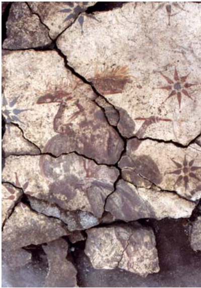
Abb. 1: Pièce 7, plafond