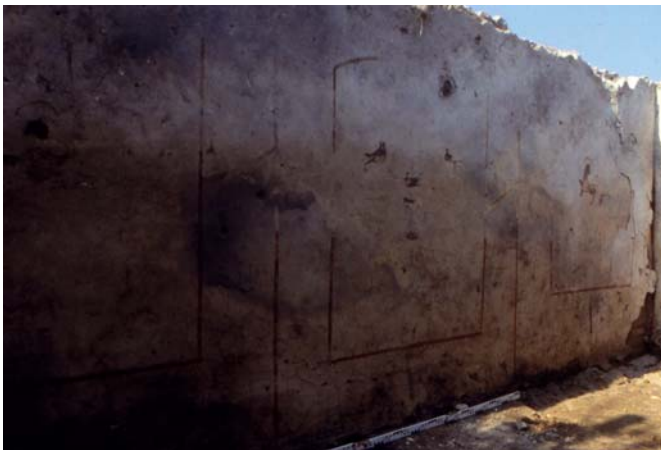
Abb. 3: Pièce 3, mur sud