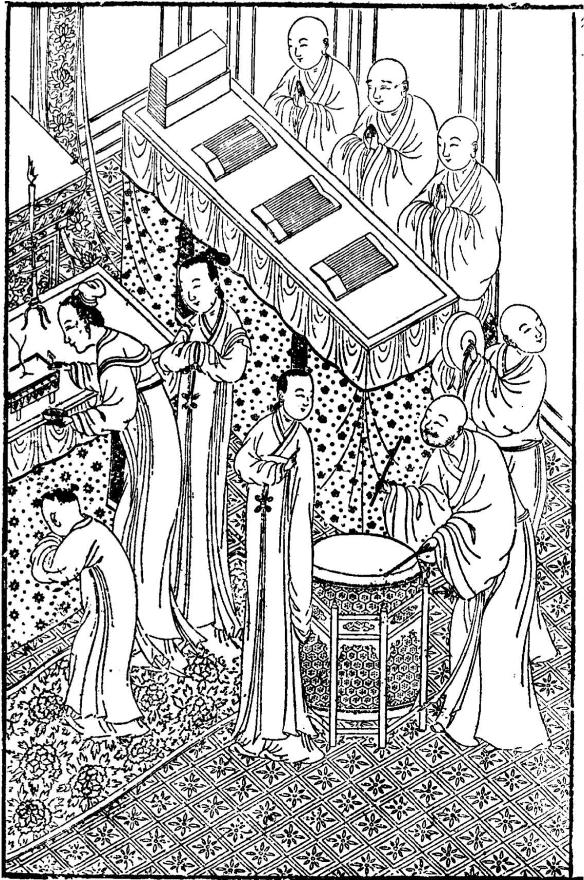
Illustration 4 Bei Xixiang ji (1610)