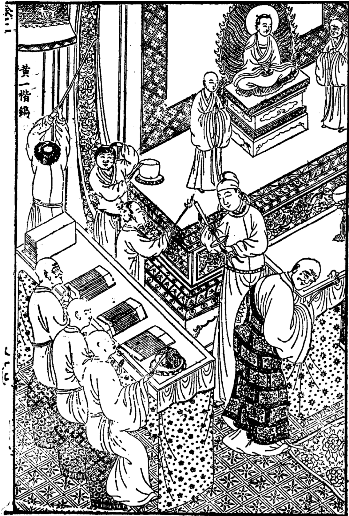
Illustration 3 Bei Xixiang ji (Cao Yidu, Hangzhou, 1610)