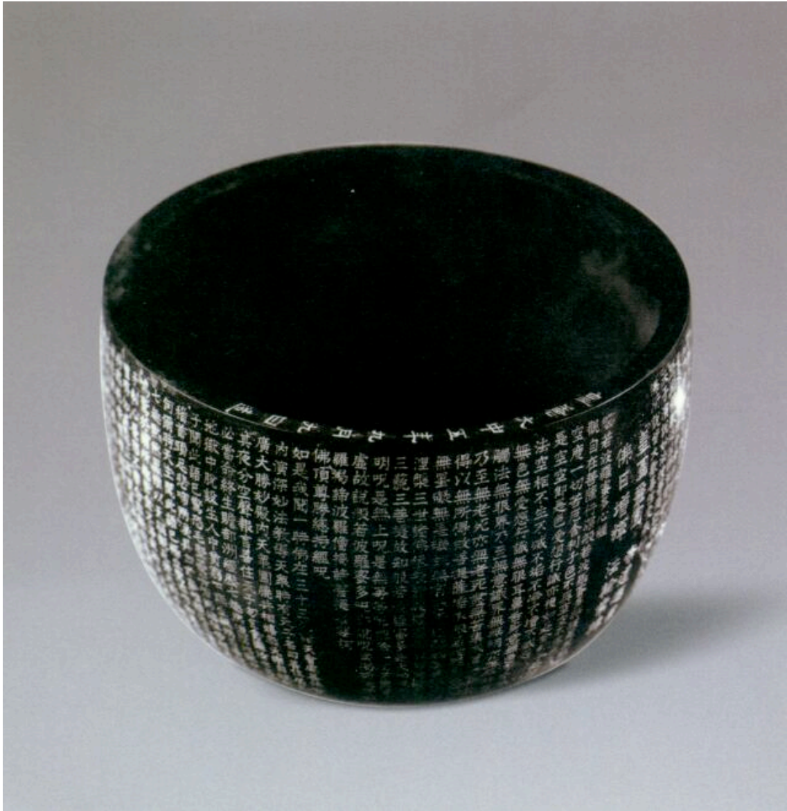
Illustration 1 cloche époque Tang (coll. Yang Dajun)