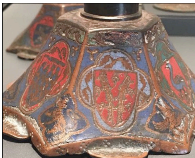
Fig. 7 – Limoges, musée des Beaux-Arts – palais de l'évêché, inv. 463, [cat. 15].

plus grossière de certains décors témoigne également de ce processus de copie d'un modèle à l'autre est sans doute aussi la cause de la transmission altérée des décors héraldiques (63) . L'écu d'or à la bande d'azur accompagnée de six étoiles de gueules visible sur un des pans de l'exemplaire du Schnütgen Museum de Cologne [cat. 6] est probablement une version abâtardie de l'écu d'azur à la bande bretessée et contre-bretessée d'or accostée de six étoiles d'or de l'exemplaire du Victoria & Albert Museum [cat. 16]. Aussi faut-il reconnaître sur le lot de bases pyramidales conservées au Museo de Valladolid [cat. 28] une représentation très sommaire de l'écu de gueules semé de trèfles d'or à deux bars du même adossés et brochants (fig. 6) visible par exemple sur le modèle du musée de Limoges [cat. 15], (fig. 7).