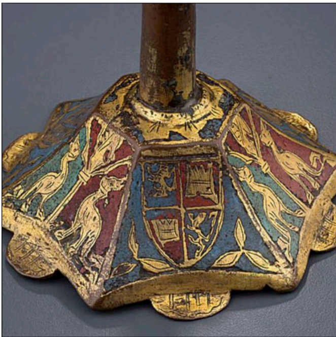
Fig. 8 – Montréal, musée des beaux-arts, inv. 1950.51.DM.5, [cat.20] (Photo : © Musée des beaux-arts, Montréal).

L'utilisation de la couleur, et notamment les règles – qui nous échappent probablement (64) – qui semblent régir les différentes associations de couleurs d'émaux en fonction des modèles, peut aussi expliquer l'impression d'inexactitude ou d'erreur de la représentation héraldique par rapport aux véritables armoiries desquelles elle s'inspire. Ainsi les armes et les couleurs de la maison royale de Castille et León sont-elles imitées ou retranscrites de façon approximative sur les exemplaires du Kunstgewerbemuseum de Berlin [cat.51] à l'écu écartelé en 1 et 4, de gueules au château d'or et en 2 et 3 d'or au lion d'azur rampant, tout comme sur l'exemplaire du musée des Beaux Arts de Montréal [cat.20] à l'écu écartelé au 1 et 4 d'azur au lion rampant d'or et au 2 et 3 de gueules au château d'or (fig.8). La composition semble en effet être régie par un principe de superpositions et d'alternance. À la couleur du fond de l'objet se superposent les couleurs des quartefeuilles dans lesquelles apparaissent les armoiries et auxquelles répondent sur certains modèles les représentations, sur les rainures des faces de l'objet, de créatures ailées enfermées dans des losanges colorés, eux-mêmes inscrits dans des quartefeuilles. À ce titre, la série des exemplaires pyramidaux non armoriés décorés