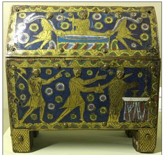
Fig. 1 – Châsse historiée représentant le martyr de Saint Thomas Becket, Paris, musée de Cluny – musée national du Moyen Âge, inv. Cl. 22596.