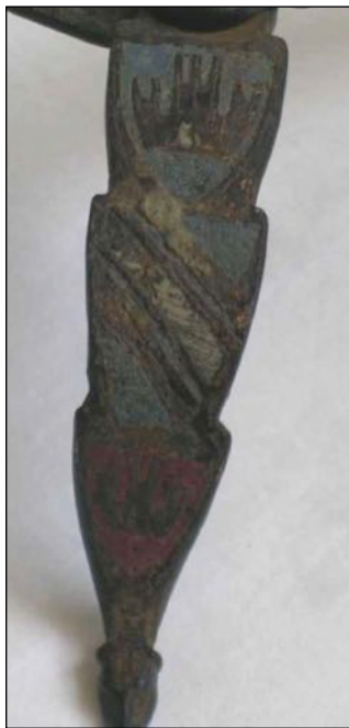
Fig. 9 – Saumur, Château-Musée, inv. 919.13.2.319, [cat. 89]