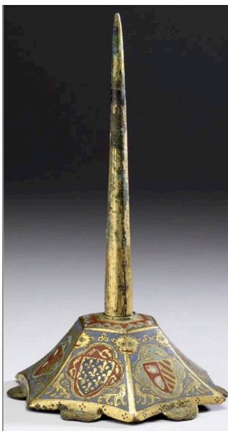
Fig. 5 – Baltimore, The Walters Art Museum, inv. 44.596, [cat. 3].