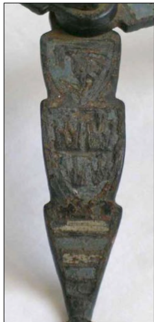
Fig. 10 – Saumur, Château-Musée, inv. 919.13.2.319, [cat. 89].

82, 83, 85, 89, 94], bleu [cat. 89] (fig. 9) ou par quatre châteaux [cat. 89] (fig. 10), tout comme l'imitation des armes de Bourgogne dont l'écu est tantôt bandé d'or et d'azur à la bordure de gueules (fig. 11) [cat. 75, 80], tantôt barré d'or et d'azur à la bordure de gueules [cat. 82].