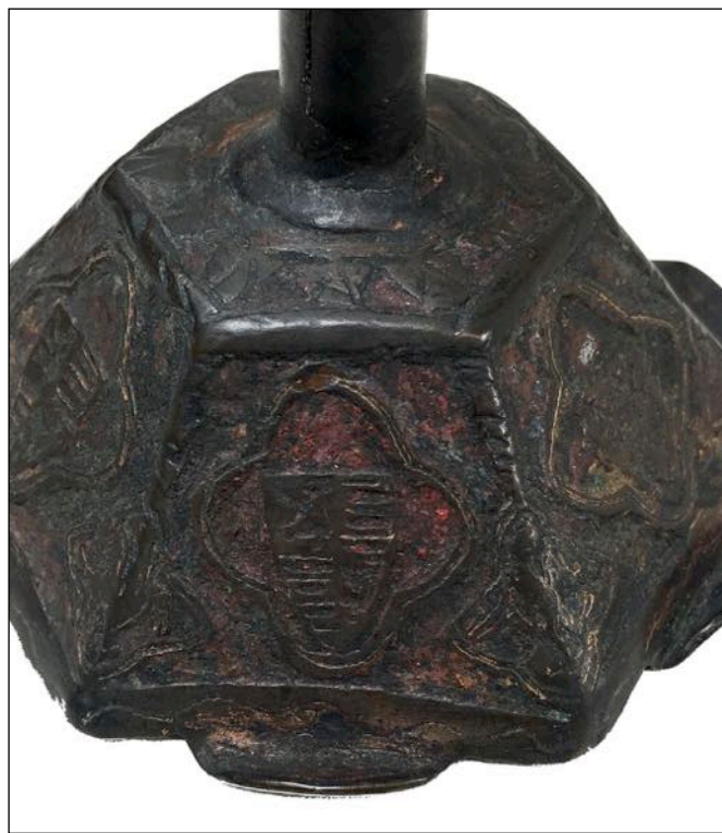
Fig. 2 – Nuremberg, Germanisches Nationalmuseum, inv. HG 1866, [cat.23].