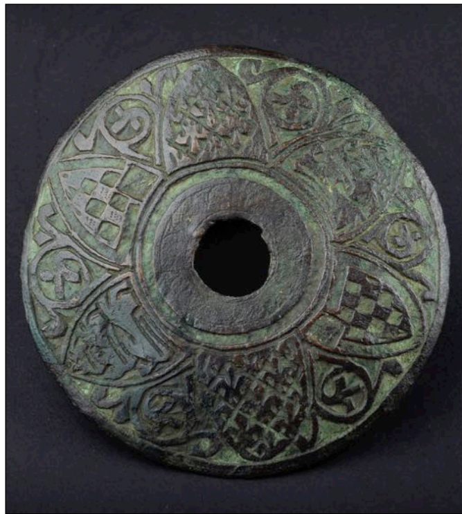
Fig. 12 – Toulouse, musée Paul Dupuy, inv. 18122, [cat. 63].

Toutefois la réutilisation du répertoire héraldique émaillé ne se cantonne pas seulement à un seul modèle ou à un seul type de luminaire. La constitution de ce panel d'écus armoriés réutilisables s'est imposé, semble-t-il, à un ensemble plus large d'objets émaillés de la production limousine. Il faut ainsi souligner la présence de l'écu aux trois léopards passants non seulement sur les modèles de luminaires du musée d'Édimbourg, de l'ancienne collection Gustav Rau, du musée Paul Dupuy de Toulouse ou du musée du Louvre [cat. 10, 34, 63, 58] mais aussi comme médaillon central du gémellion conservé par le Kestner-Museum d'Hannovre (67) ou sur les armoiries décorant l'équipement du cheval médiéval, en particulier les harnais (68) . De la même façon, certains des décors héraldiques d'un gémellion conservé au Walters Art Museum de Baltimore (69) peuvent être mis en relation avec ceux décorant quelques modèles de pique-cierges portatifs. L'écu d'or billeté d'azur, au franc-canton d'argent aux deux châteaux d'or à la bordure de gueules décore ainsi aussi bien le gémellion du Museo di arte sacra de Montespertoli (70) , l'exemplaire emboîtable à base ronde du musée Paul Dupuy de Toulouse (fig. 12), le coffret dit de Saint-Louis du Louvre (71) et probablement aussi, quoi que dans une version plus altérée, l'exemplaire emboîtable à base pyramidale du musée d'Édimbourg [cat. 9]. L'écu de