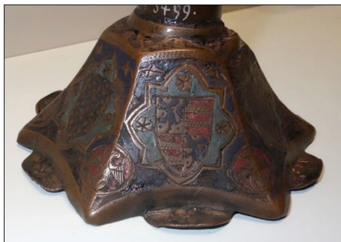
Fig. 3 – Nuremberg, Germanisches Nationalmuseum, inv. HG 3499 [cat.21].

La similitude et le réemploi des armoiries mais aussi des motifs non héraldiques et de la disposition des décors encouragent également à penser que l'ornementation était copiée d'un modèle à un autre, au point parfois de pouvoir envisager leur appartenance à un même lot. Geneviève François avait déjà souligné le rapprochement stylistique que l'on pouvait opérer entre les modèles du musée des Beaux Arts de