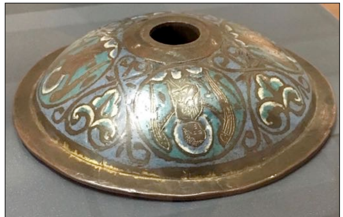
Fig. 14 – Limoges, musée des beaux-arts – palais de l'évêché, inv. 313 a, [cat.55].

ou châsses [77] est tout à fait analogue au décor du pique-cierge emboîtable à base ronde du Boijmans van Beuningen Museum de Rotterdam [cat.61] ou du musée des Beaux Arts de Limoges [cat.55], (fig.14). Les objets de l'Œuvre de Limoges semblent même si étroitement liés que les émailleurs n'hésitent pas à essaïmer des références à d'autres objets émaillés qu'ils produisent sur ceux qu'ils décorent. On retrouve ainsi sur les pieds d'un exemplaire à piètement coulissant du Victoria & Albert Museum [cat.81], à la place des traditionnels écus armoriés, une représentation d'une crosse à un nœud, stylistiquement très proche des crosses limousines produites à cette époque.