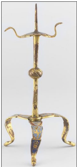
Fig. 11 – Amsterdam, Rijksmuseum, inv. BK-NM-11468, [cat. 75] (Photo: © Rijksmuseum, Amsterdam).

82, 83, 85, 89, 94], bleu [cat. 89] (fig. 9) ou par quatre châteaux [cat. 89] (fig. 10), tout comme l'imitation des armes de Bourgogne dont l'écu est tantôt bandé d'or et d'azur à la bordure de gueules (fig. 11) [cat. 75, 80], tantôt barré d'or et d'azur à la bordure de gueules [cat. 82].