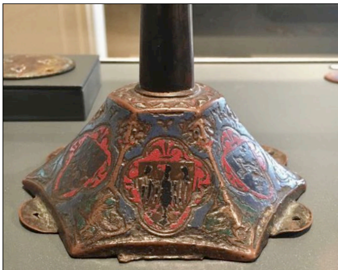
Fig. 4 – Limoges, musée des Beaux-Arts – palais de l'évêché, inv. 464, [cat. 14].

Limoges [cat. 14] (fig. 4) et l'exemplaire conservé à Baltimore au Walters Art Museum [cat. 3] (62) (fig. 5). Les exemplaires du Kestner-Museum [cat. 12], du Suermondt Ludwig Museum [cat. 1], ainsi que de deux exemplaires vendus aux enchères [cat. 35] pourraient aussi provenir du même lot originel, comme les modèles du Victoria & Albert Museum [cat. 17] et du musée des antiquités de Rouen [cat. 24]. L'exécution moins soignée et