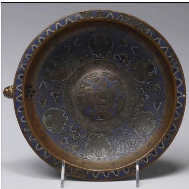
Fig. 13 – Gémellion, Baltimore, The Walters Art Museum, inv. 44.73 (Photo: © The Walters Art Museum, Baltimore).

gueules ondé de trois fasces d'or visible sur un des pans du modèle du musée des Beaux Arts de Limoges [cat.15] est aussi probablement une interprétation simplifiée des écus semblables onvés visibles sur les objets de Baltimore ou du musée de Cluny [72] , qui sont sans doute eux-mêmes des versions rapidement exécutées de l'écu fascé de gueules et de vair de la famille de Coucy [73] . Le château à trois tours, omniprésent sur les exemplaires à trois pieds articulés, est également utilisé de manière systématique sur un ensemble de gémellions aux décors apparentés conservés à New York, Compiègne, ou encore Londres [74] .