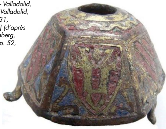
Fig. 6 – Valladolid, Museo Valladolid, inv. 9931, [cat. 28] (d'après Watterberg, 2009, p. 52, fig. 3).

plus grossière de certains décors témoigne également de ce processus de copie d'un modèle à l'autre est sans doute aussi la cause de la transmission altérée des décors héraldiques (63) . L'écu d'or à la bande d'azur accompagnée de six étoiles de gueules visible sur un des pans de l'exemplaire du Schnütgen Museum de Cologne [cat. 6] est probablement une version abâtardie de l'écu d'azur à la bande bretessée et contre-bretessée d'or accostée de six étoiles d'or de l'exemplaire du Victoria & Albert Museum [cat. 16]. Aussi faut-il reconnaître sur le lot de bases pyramidales conservées au Museo de Valladolid [cat. 28] une représentation très sommaire de l'écu de gueules semé de trèfles d'or à deux bars du même adossés et brochants (fig. 6) visible par exemple sur le modèle du musée de Limoges [cat. 15], (fig. 7).