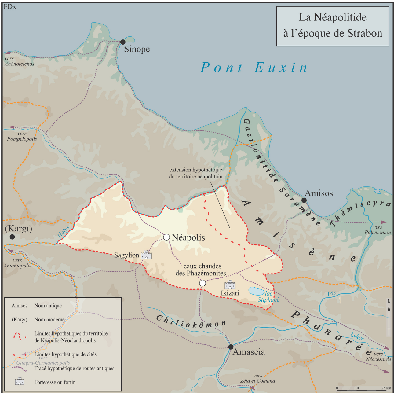
Carte 1 : Néoclaudiopolis carte général.

d'Amis et la plaine environnante, constituée, avec les plaines de Thémiscyra et de la Sidène 31 , l'Amisène dont l'emprise s'étendait jusque sur les premières pentes de la Chaîne Pontique 32 . On peut suivre assez facilement les crêtes de ce massif, parmi lesquelles le Bünyan Dağı (1 310 mètres), le Yund Dağı (1 194