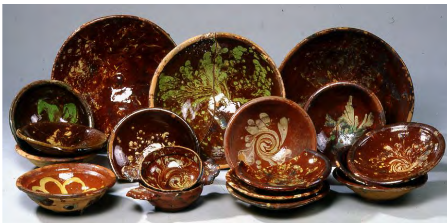
FIG. 95 Vaisselles glaçurées à décor d'engobe blanc sur fond rouge de la vallée de l'Huveaune, Marseille, Port de Pomègues, XVII e -XVIII e siècle; dépôt Drassm, Musée d'Histoire de Marseille (cl. LA3M, 1999).

terre cuite commune à décor d'engobes tourbillonnés de la Vallée de l'Huveaune; whorl pattern slip ware ; terre cuite commune avec engobe et vernissée de la Vallée de l'Huveaune