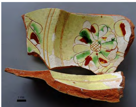
FIG. 96 Section d'un tesson de coupe à décor incisé sur engobe et sous glaçure de la vallée de l'Huveaune, dépotoir de Saint-Zacharie, XVII e siècle; dépôt LA3M.

Texture homogène de couleur rouge plus ou moins claire, tendre et poreuse (4 et 5 sur l'échelle de Mohs), contenant de petites inclusions blanches subarrondies* et éparsees, égales ou supérieures à un millimètre (FIG. 96).