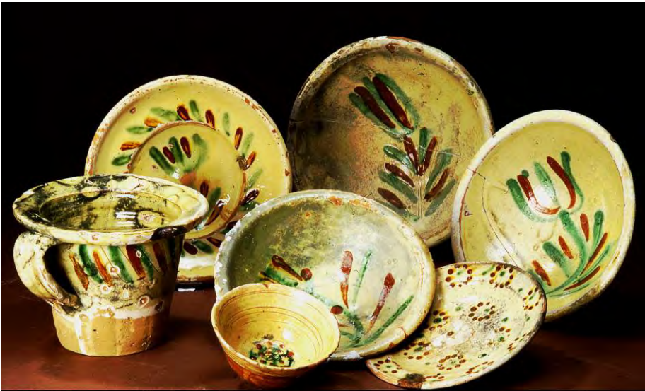
FIG. 97 Vaisselles glaçurées à décor incisé et d'engobe rouge rehaussé d'oxyde de cuivre vert sur fond blanc de la vallée de l'Huveaune, Marseille, port de Pomègues, XVII e -XVIII e siècle; dépôt Drassm, Musée d'Histoire de Marseille (cl. LA3M, 1999).

Cette production se décline selon deux principaux types de décors. Le premier est fait soit à l'engobe blanc sur fond rouge, soit à l'engobe rouge sur fond blanc : ou mêlés en tourbillons et rehaussés de touches d'oxyde de cuivre vert; ou projetés en taches; ou encore posés à l'aide d'un petit réservoir (barrolet), en dessins géométriques, en ruban, en onde, ou en gouttes formant des cercles (FIG. 95). Le second type est incisé sur l'argile engobée. Les motifs graffités finement sur un fond blanc sont des imitations des produits pisans largement diffusés au XVII e siècle : fleur, oiseau, poisson, compositions géométriques et rares scènes figurées et datées sur des plats de cérémonie. Des touches d'engobe rouge et d'oxyde de cuivre vert rehaussent ces compositions du plus bel effet (FIG. 97). Des oreilles moulées et des décors d'applique en relief, sont également présents sur des écuelles et des cruches à anse de panier.