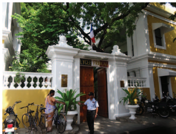
Portail d'entrée du Lycée français de Pondichéry

Ce vieillissement de la population pondichérienne est synonyme de baisse des effectifs à plus long terme. Alors que de plus en plus de jeunes choisissent d'étudier puis de travailler en France (la grande majorité via le Lycée français), la perspective actuelle d'augmentation des inscrits n'est que transitoire : nos estimations indiquent en effet une chute des effectifs dans 40 ans au plus tard. Afin d'assurer un maintien de la population au-delà d'une génération, il est nécessaire qu'apparaissent de nouvelles incitations pour les jeunes à rester à Pondichéry.