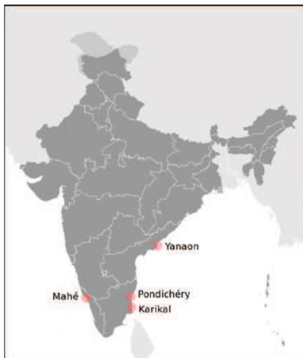
Figure 1a : Le Territoire de Pondichéry, composé des quatre anciens Établissements français de l'Inde

pas transmise de façon uniforme et la transmission ne s'est pas arrêtée en 1963. Les « Franco-Pondichériens » (voir encadré 1) sont numériquement majoritaires dans le décompte. Cependant, l'image du Franco-Pondichérien, ancien militaire français retraité à 35 ans, fréquemment convoquée dans les médias français, est loin d'être représentative de l'ensemble de cette population. Le dernier rapport conséquent sur la population française à Pondichéry date de 1990 (Michalon, 1990). S'y ajoutent des travaux divers mais qui récemment ont porté sur les populations d'origine indienne en France plutôt que sur le champ migratoire dans son ensemble. La population française de Pondichéry est finalement mal connue, produit à la fois de dynamiques locales postcoloniales, de la circulation migratoire dense entre Pondichéry et la France, et de la mobilité internationale croissante des Français.