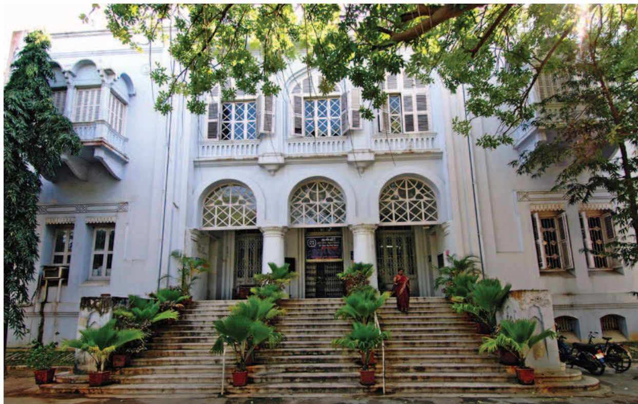
Au centre de Pondichéry, le bâtiment de l'ancienne Banque d'Indochine, aujourd'hui occupé par une banque indienne nationalisée, rappelle les liens étroits entre ces deux parties de l'empire colonial français.

l'administration française tente de pallier. Ceux qui éprouvent des regrets quant au choix de la nationalité indienne ou ceux qui n'avaient pas été informés correctement peuvent sous certaines conditions faire valoir leur droit à la nationalité française – et cela jusqu'à aujourd'hui. Le nombre de Pondichéryens non saisis par le traité n'est pas négligeable, aussi les rangs des Franco-Pondichéryens ont-ils continué à grossir depuis 1963. Dans le même temps, la nationalité française est devenue un graal recherché. Le mariage y a donné droit dans un premier temps : une union avec un(e) Pondichéryen(ne) français(e) confère cette nationalité aux enfants issus du mariage (et aussi au conjoint jusqu'en 1973) ; la nationalité a pris une valeur telle qu'elle entre dans le calcul