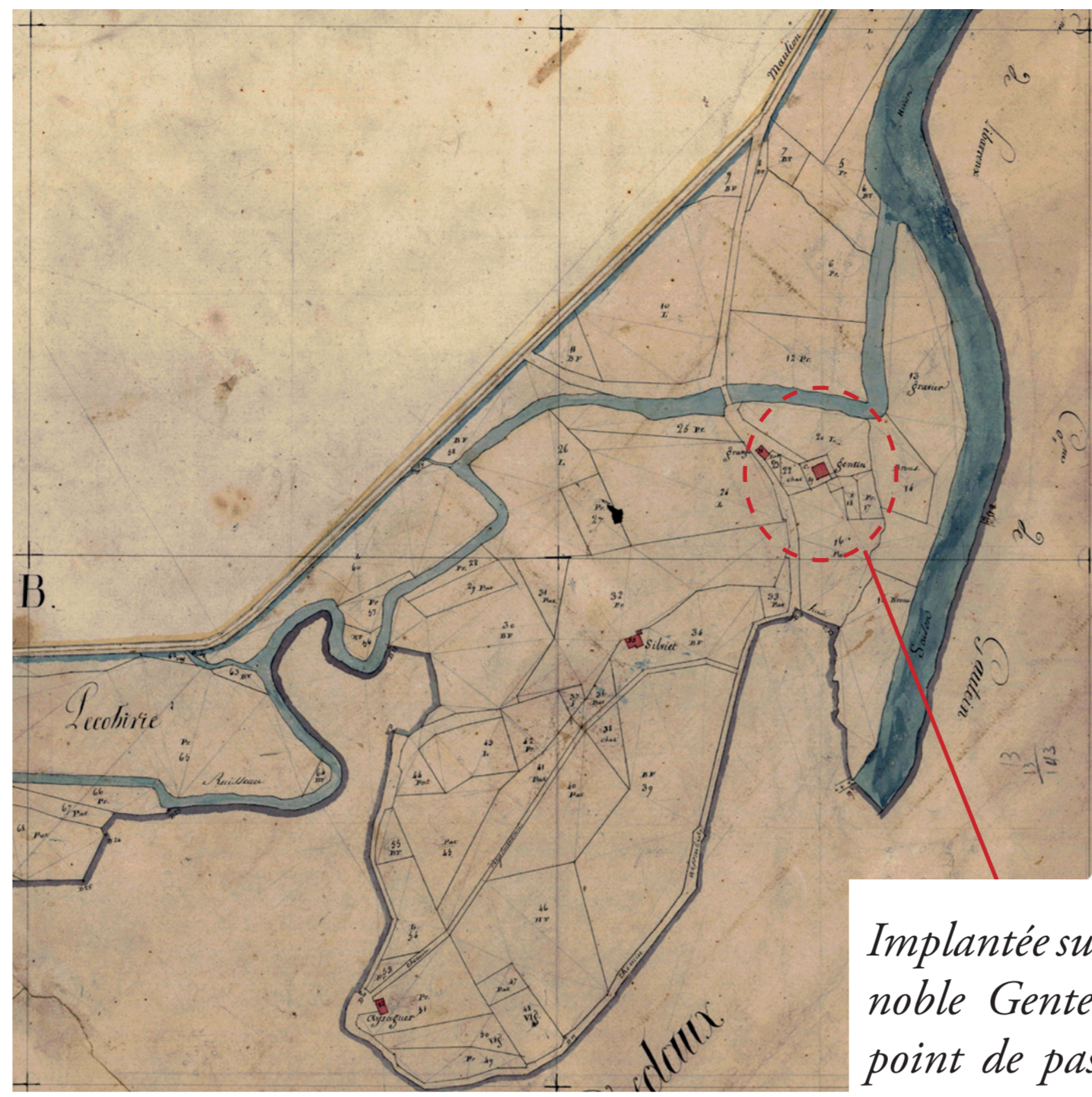
Implantée sur un site de confluence, la maison noble Gentein se trouvait également à un point de passage obligé de la Soule vers la Basse-Navarre.

Le délaissement de cette demeure au cours de l'époque moderne explique l'état dans lequel elle est parvenue, sans subir de nouvelles transformations d'importance, jusqu'à nos jours.