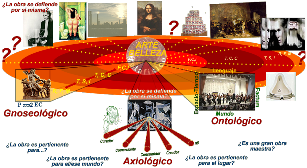
Grafico Didáctico No. 2. Elaborado por el Autor

Estos cinco lineamientos mínimos esbozados, no pretender dar una comprensión y entendimiento completo y suficiente, sino mínimo y en lo posible integral, de la realidad del arte.