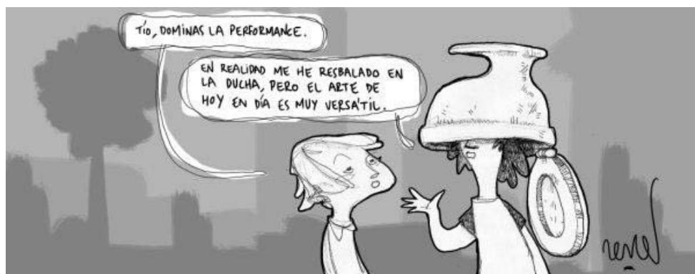
Gráfico nº 1. Arte Contemporáneo.