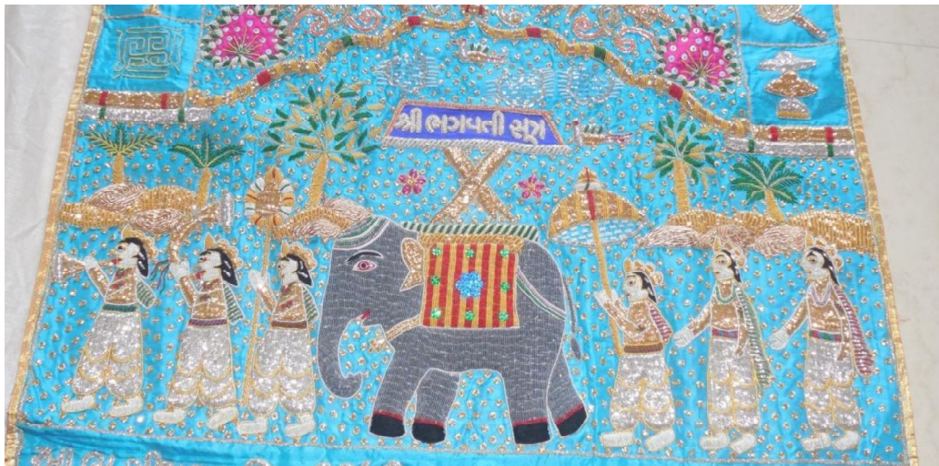
Fig. 17 : Détail de la tenture 10.38