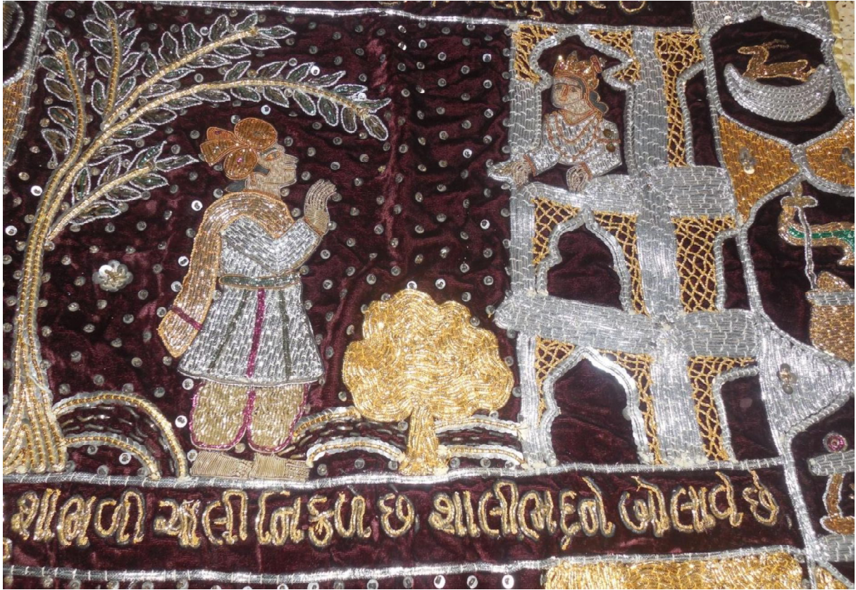
Fig. 16 : Détail de l'histoire de Śālibhadra (10.30)