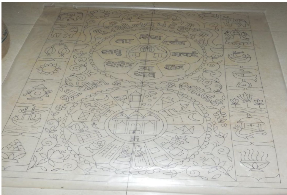
Fig. 2 : Dessin préparatoire sur papier calque