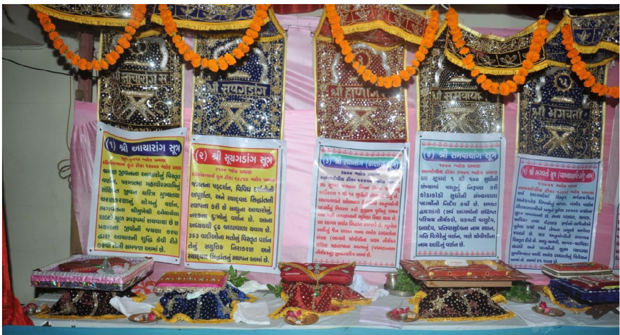
Fig. 11 : Tentures symbolisant les cinq premiers Anga lors d'une pūjā des Āgama