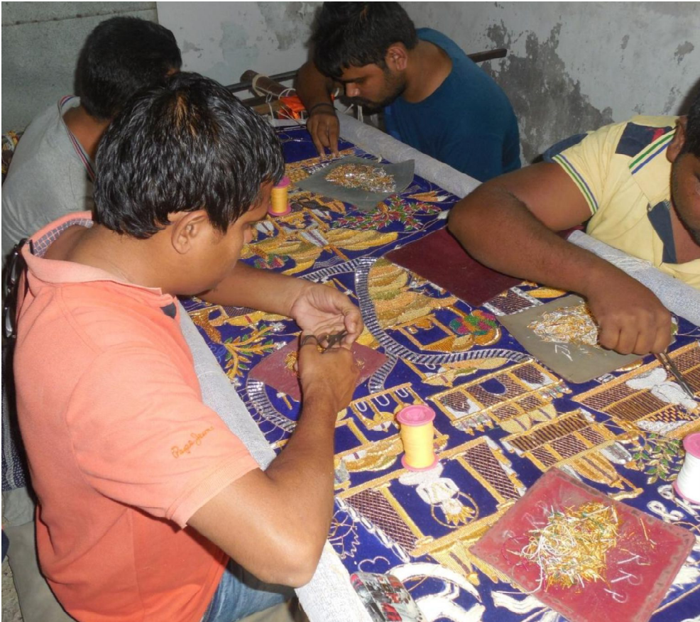
Fig. 5-6 : Incrustation et broderie de paillettes