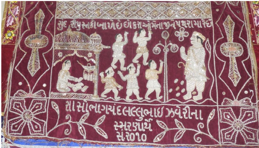
Fig. 14 : Détail de l'histoire de Varadatta et Guṇamañjarī (10.4)