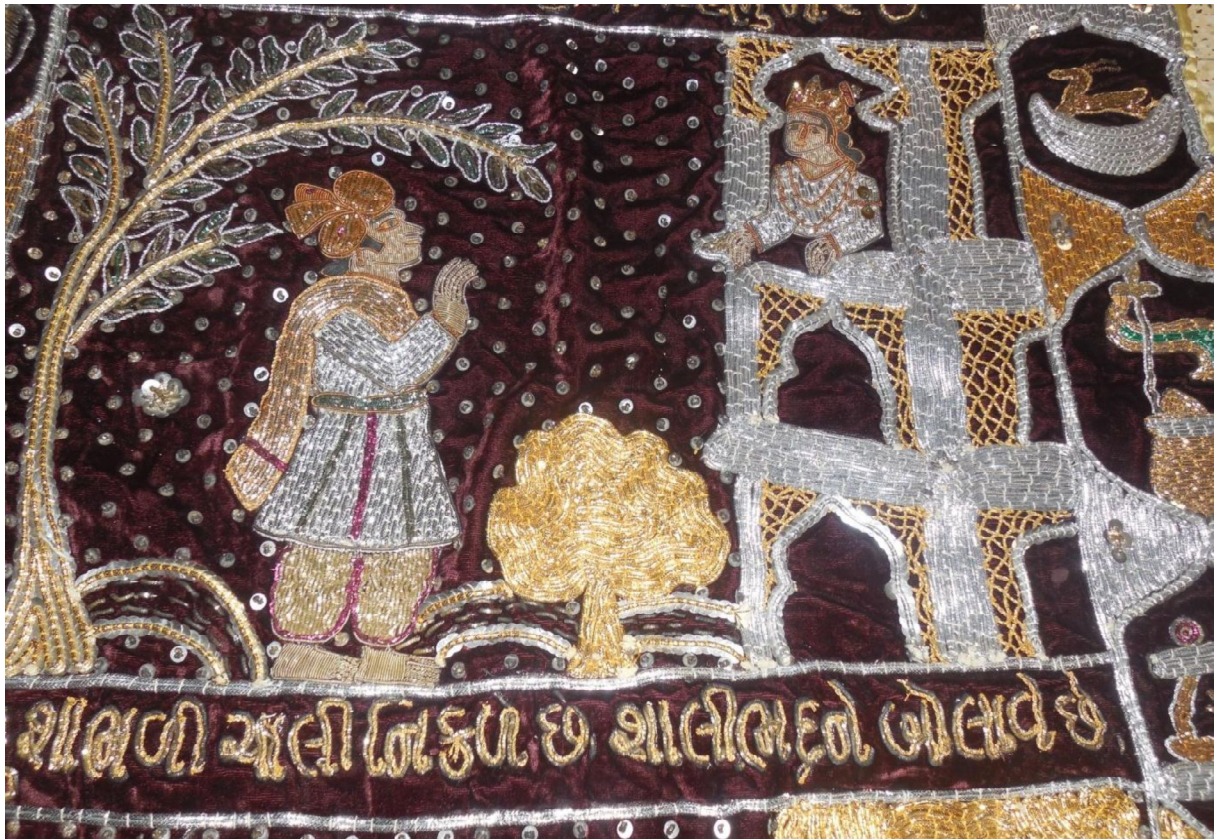
Fig. 16 : Détail de l'histoire de Śālibhadra (10.30)