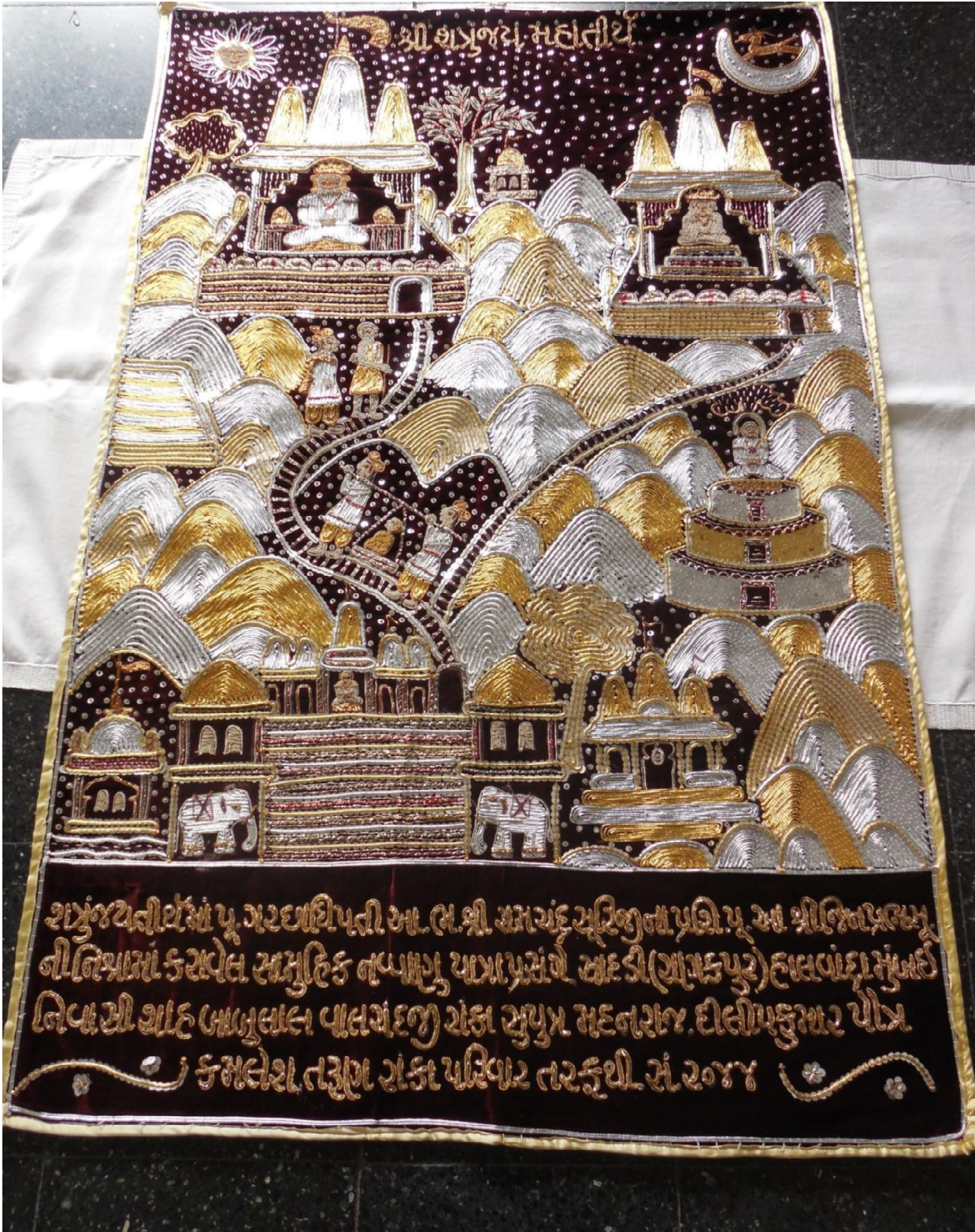
Fig. 13 : Tenture représentant Shatrunjaya (10.29)