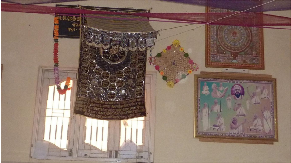
Fig. 10 : Tenture (10.33) et portraits de maîtres dans un upāsraya