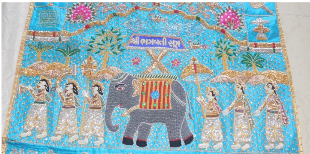
Fig. 17 : Détail de la tenture 10.38