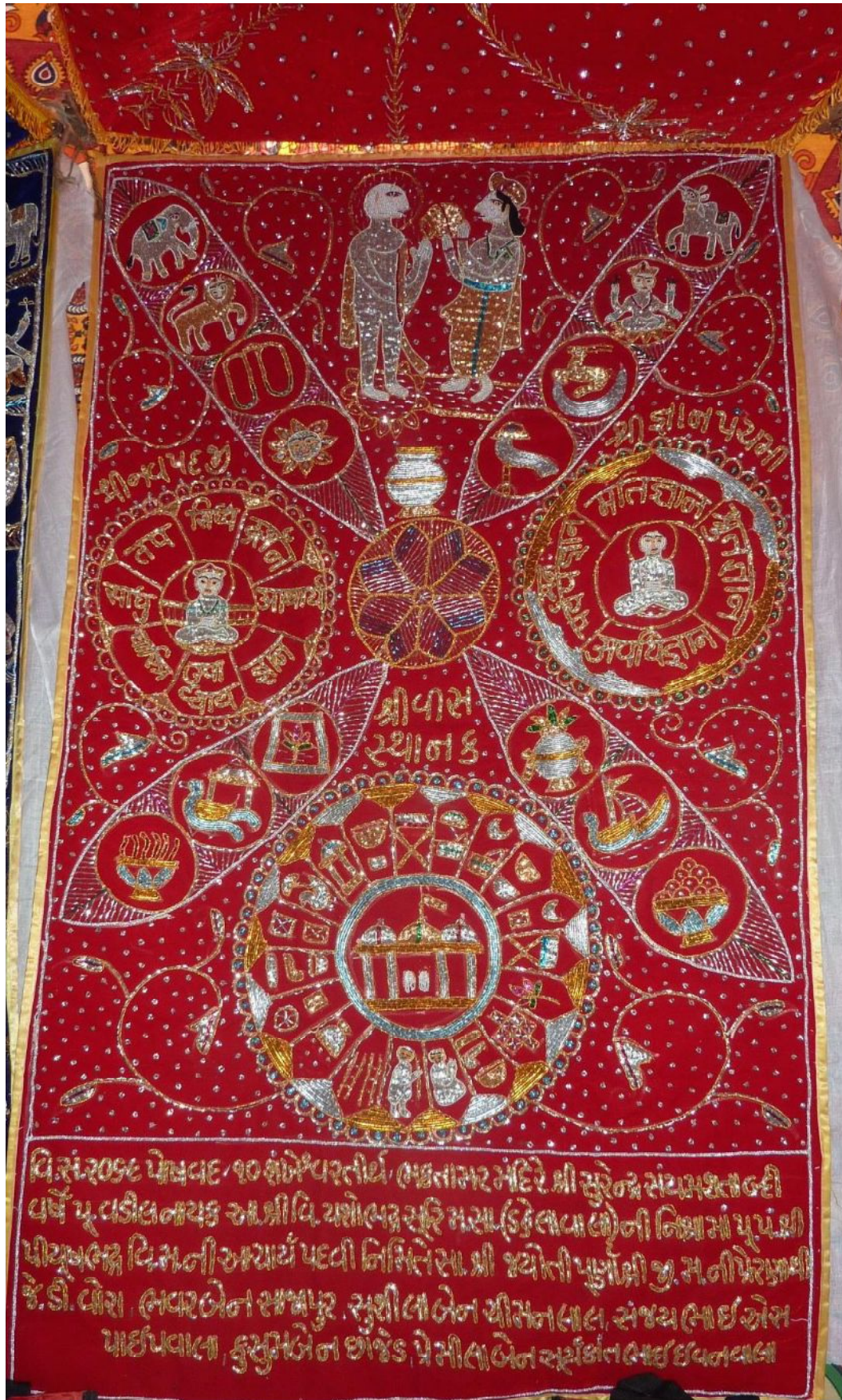
Fig. 12 : Tenture illustrant plusieurs notions de l'enseignement (10.40)