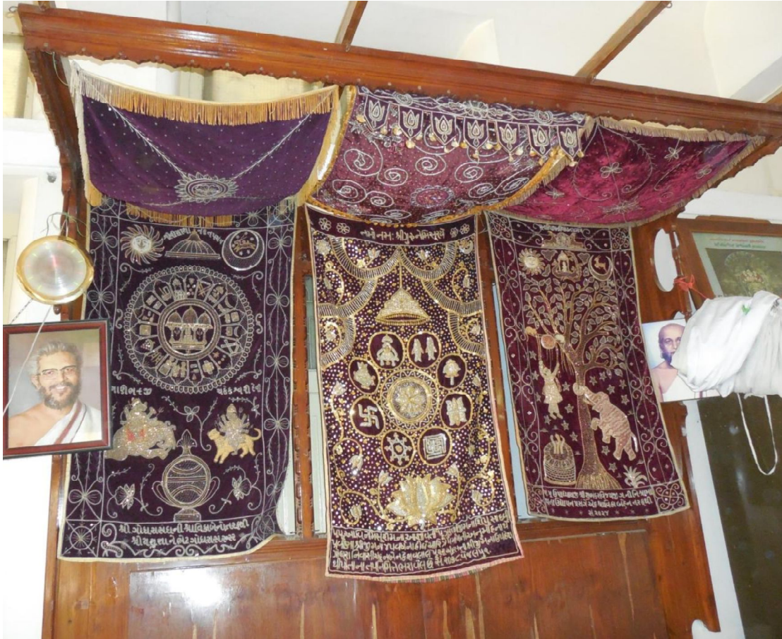
Fig. 1 : Tentures, dais et festons (10.7, 10.22, 10.9)