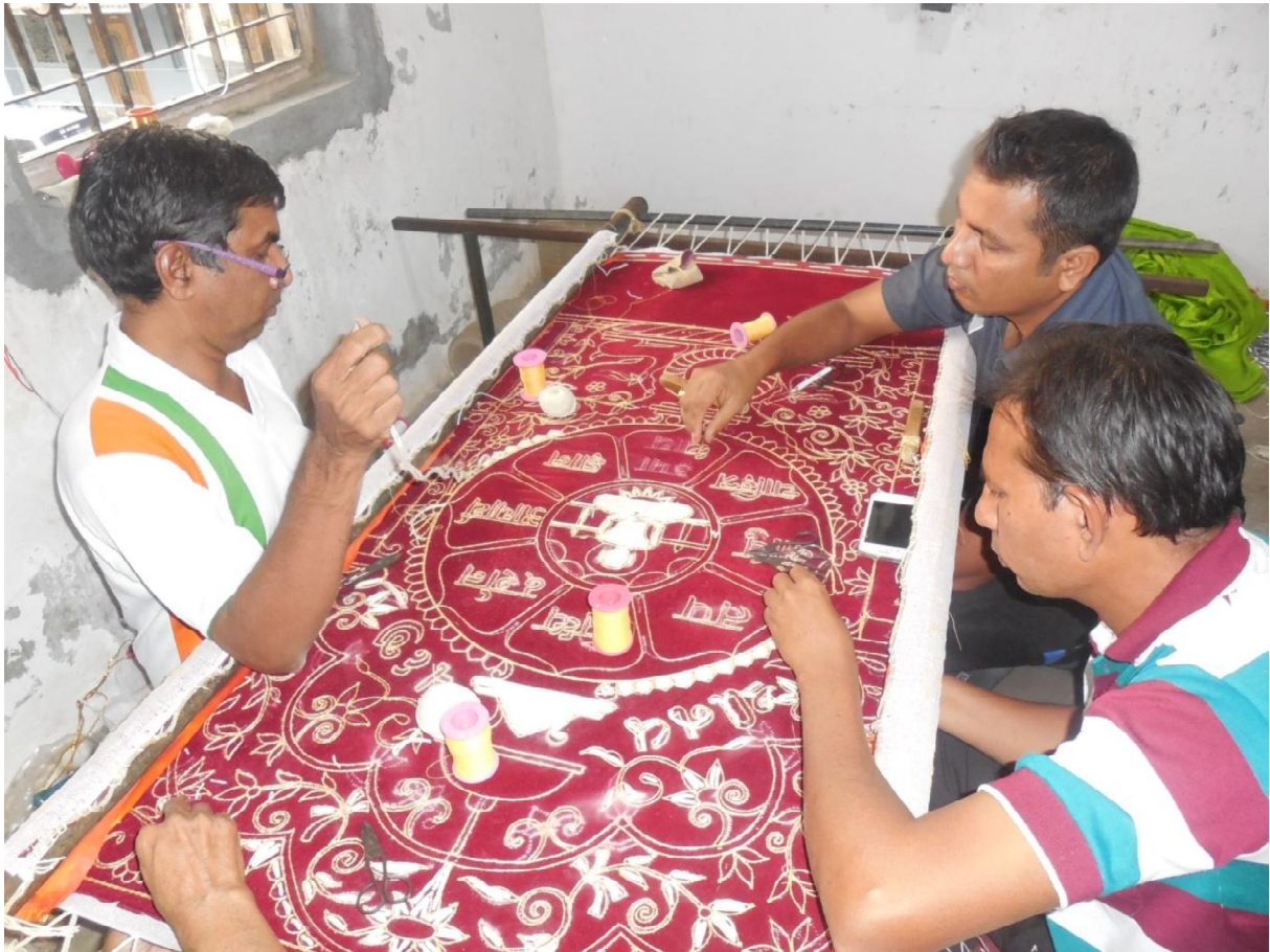
Fig. 3 Velours tendu sur cadre de bois et broderie au fil de coton blanc