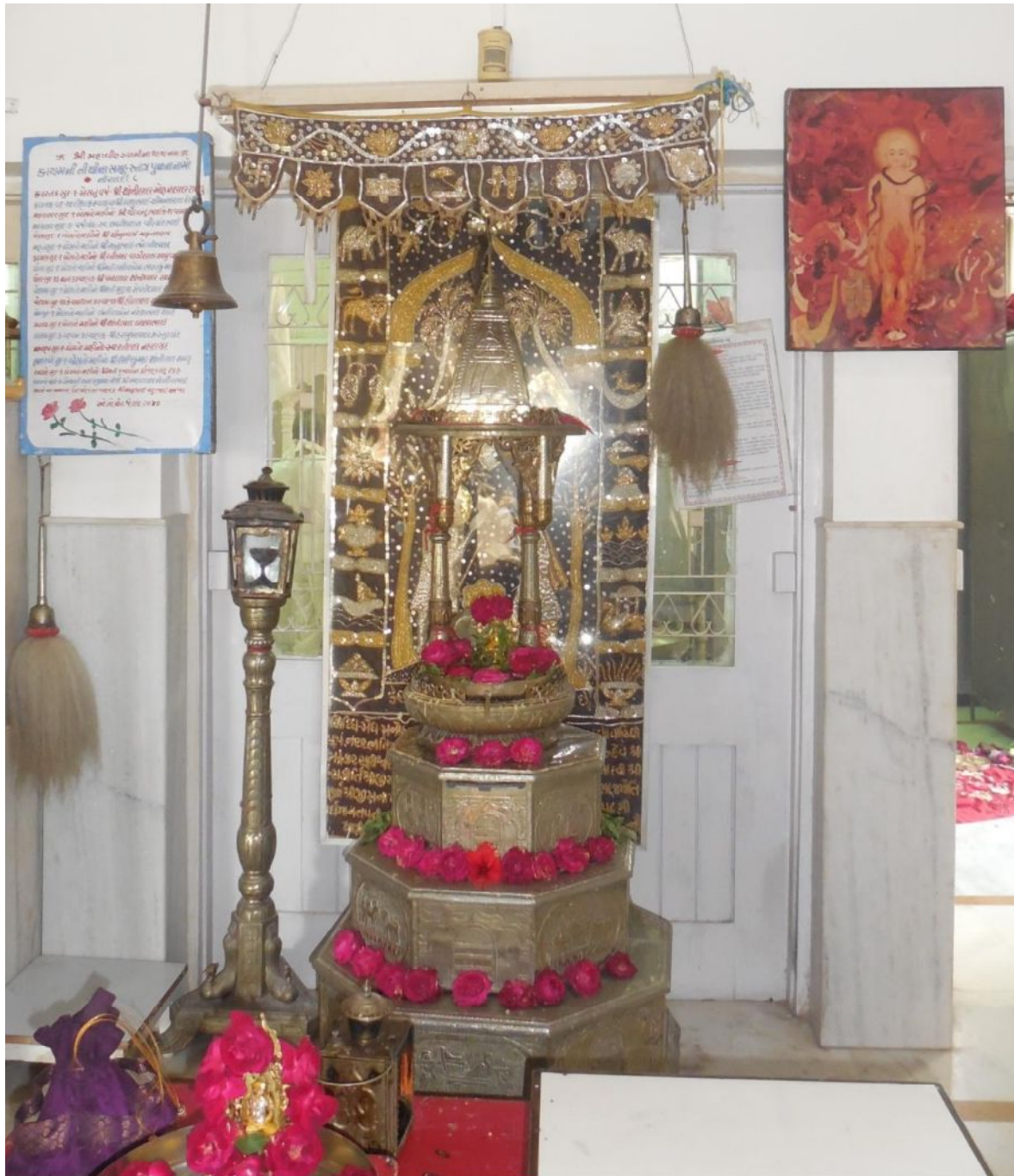
Fig. 7 Tenture en fond dans un temple (10.34)