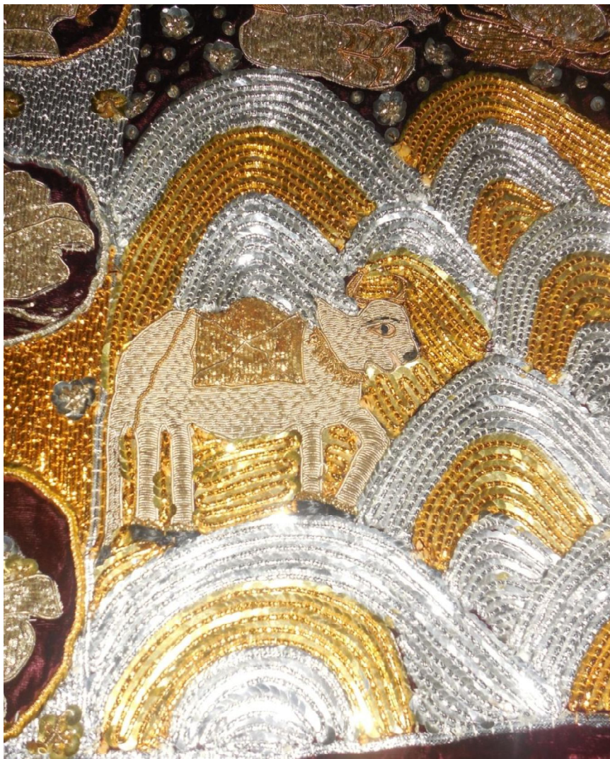
Fig. 15 : Détail de la tenture 10.27