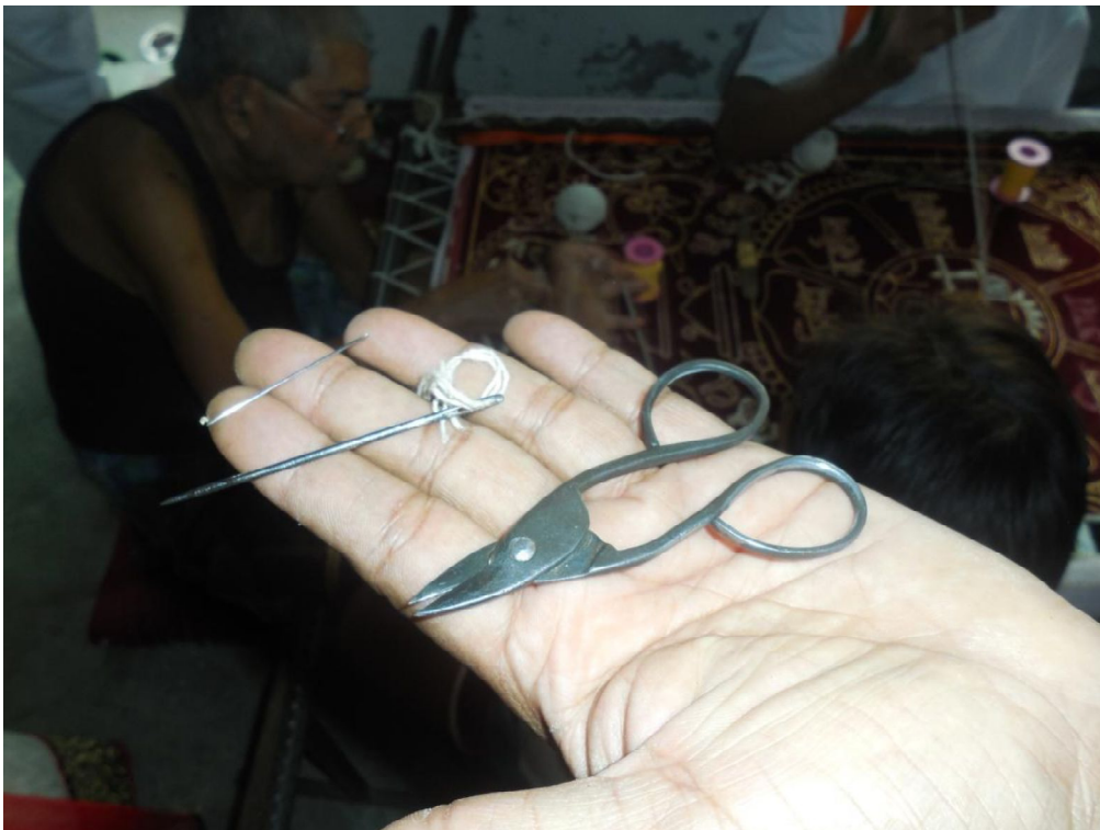
Fig. 4 : Outils utilisés par les brodeurs