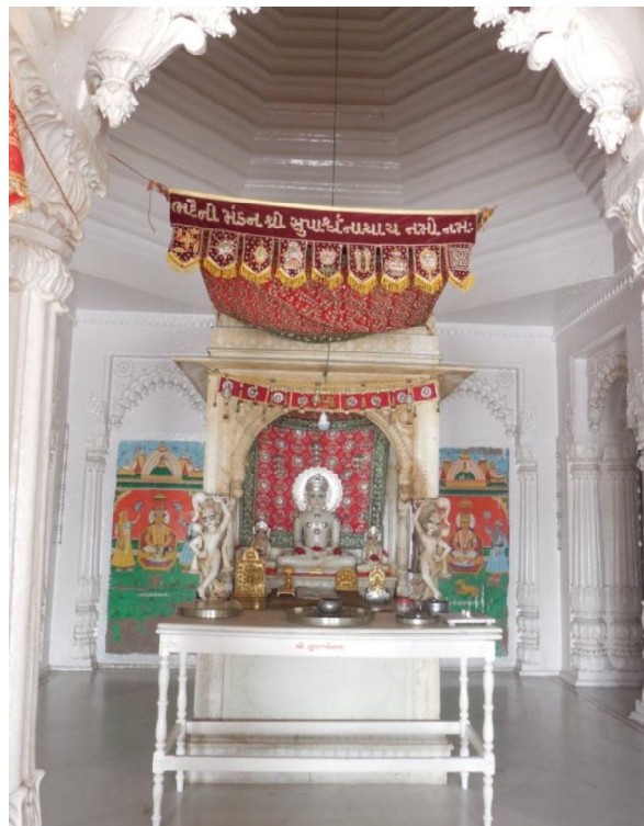
Fig. 9 : Dais, tenture et feston au temple Śvetāmbara de Bhadaini (Varanasi) dédié à Supārśvanātha