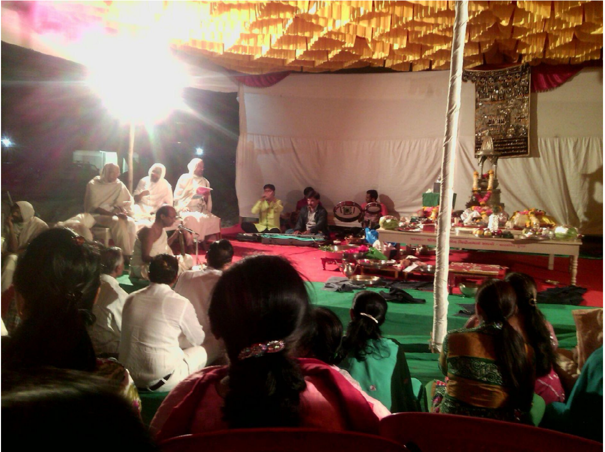
Fig. 8 : Tenture de fond devant samavasaraṇa lors d'un bhūmipūjan