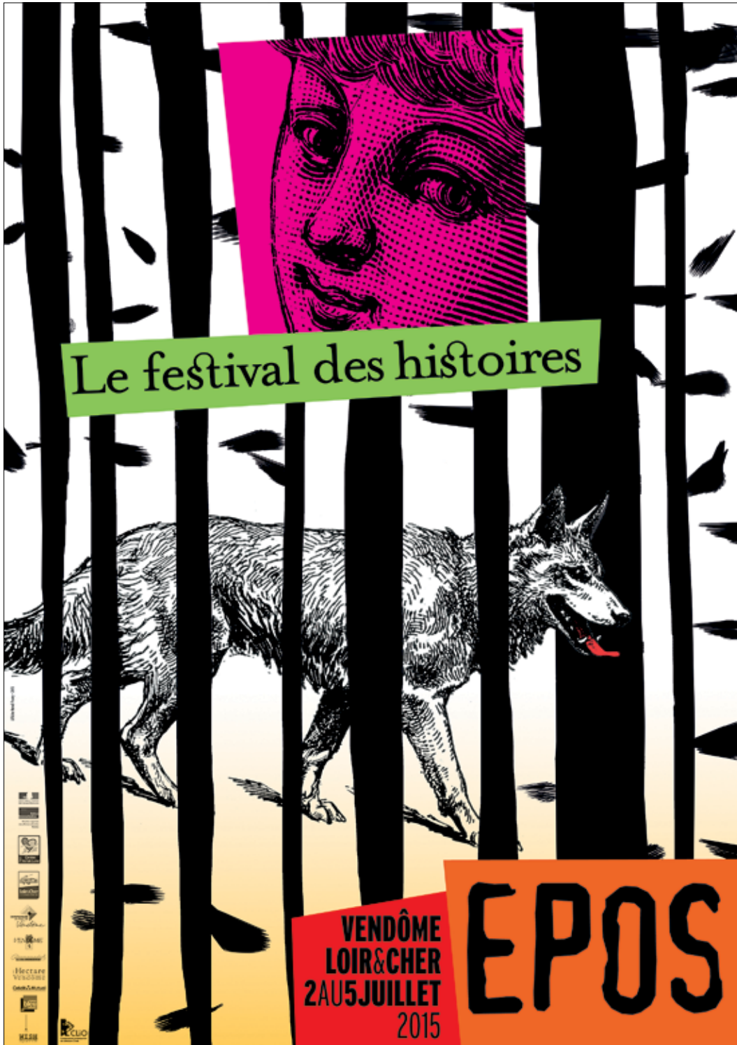
Affiche du Festival EPOS 2015 organisé par le CLiO à Vendôme.

CLiO Conservatoire contemporain de Littérature Orale