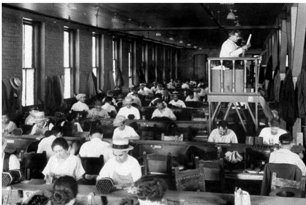
Lecture à voix haute dispensée par un lecteur aux cigariers de l'usine Cuesta-Rey à Tampa en Floride (1929).