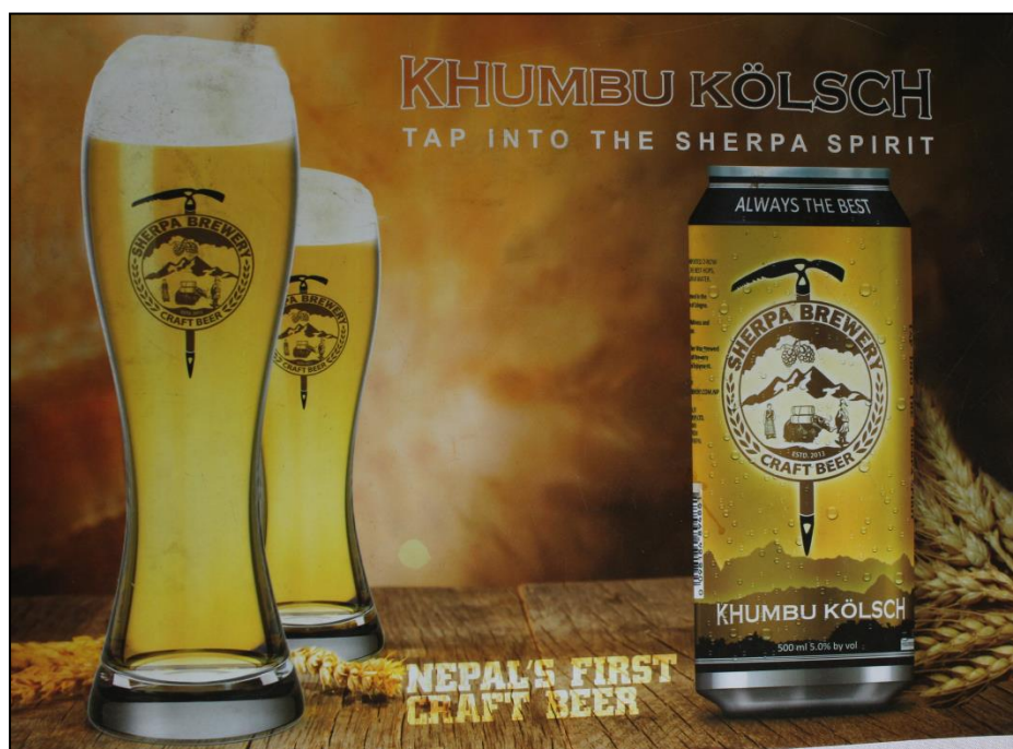
Cliché : JACQUEMET E. 2016

La « Khumbu Kölsch » : l'exemple d'un savoir-faire issu de l'ici et de l'ailleurs