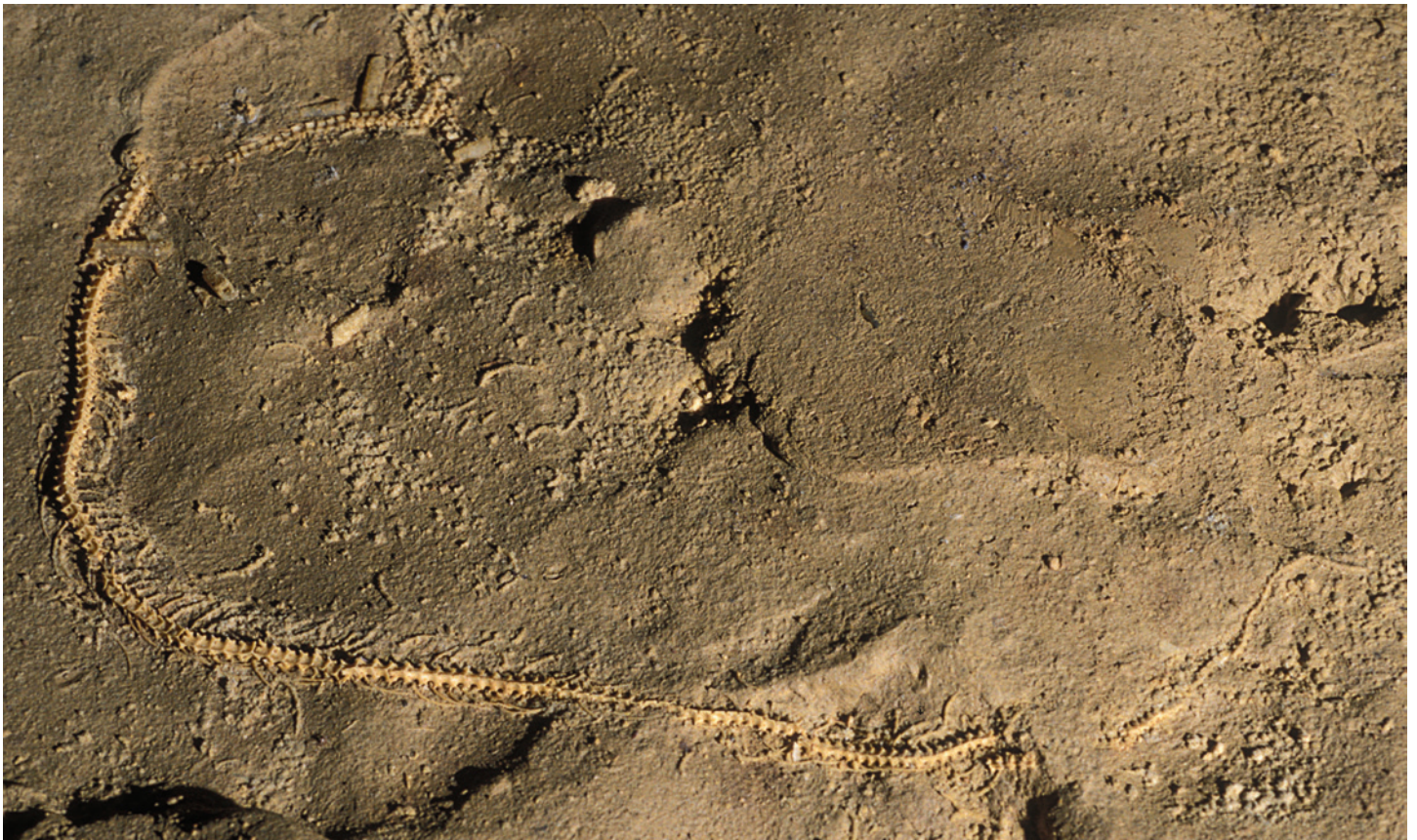
Fig. 1. Squelette de couleuvre dans la caverne du Tuc d'Audoubert.