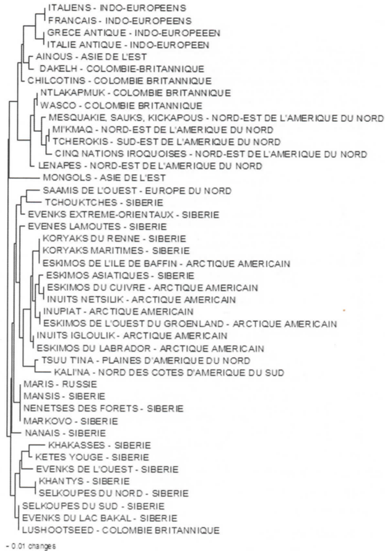
Figure 2. Arbre construit en utilisant la méthode NeighborJoining grâce au logiciel PAUP*4.0a147.

versions paraissent également liées à la vague d'expansion esquimaude. Ces informations ne sont pas contradictoires. Une étude récente montre en effet une proximité génétique entre les Surui du Brésil, certains peuples athabascans (famille linguistique dont font partie les Tsuu t'ina, associés par l'algorithme au Kali'na) et les habitants des îles Aléoutiennes, archipel du Sud-Ouest de l'Alaska, qui sont eux-mêmes très proches génétiquement des Inuits (Raghavan et al. 2014) : les versions de Chasse cosmique présentes en Amérique du Sud seraient donc venues d'Asie très récemment (3) . Le proto-