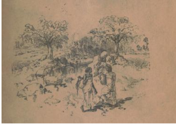
G. Revoil, Voyage au pays des aromates , Paris, 1880

Th. von Heuglin, Reise in Nordost-Afrika und längs des Rothen Meeres im Jahre 1857 , p. 430) : Die Gegend ist sehr gebirgig und in NÖ. zu O. befindet sich ein mehrere 100 Fuss hohe, steile Klippe die von drei Seiten vom Meer umspült und nur durch ein schmales Thal von der Gebirgen des Festlands getrennt ist. Diese Klippe heisst Chansirch [= ras Kharizira, à l'est de Berbera], ihre nördlichste Spitze ist unter 10° 52' N.Br. und zwischen ihrer Südostseite und dem Festland ist eine kleine seichte Bucht. Wadi und Gebirge sind nicht ohne Vegetation, so dass Kerems Bewohner einen ziemlichen Viehstand halten. Es besteht von hier aus einiger Handel mit Aden und werden ausser Schlachtvieh und Butter Gummi, Myrrhen, Straussenfedern (...) ausgeführt.