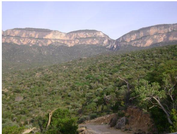
Encensiers dans les monts Daalo (Somaliland)

Th. von Heuglin, Reise in Nordost-Afrika und längs des Rothen Meeres im Jahre 1857 , p. 430) : Die Gegend ist sehr gebirgig und in NÖ. zu O. befindet sich ein mehrere 100 Fuss hohe, steile Klippe die von drei Seiten vom Meer umspült und nur durch ein schmales Thal von der Gebirgen des Festlands getrennt ist. Diese Klippe heisst Chansirch [= ras Kharizira, à l'est de Berbera], ihre nördlichste Spitze ist unter 10° 52' N.Br. und zwischen ihrer Südostseite und dem Festland ist eine kleine seichte Bucht. Wadi und Gebirge sind nicht ohne Vegetation, so dass Kerems Bewohner einen ziemlichen Viehstand halten. Es besteht von hier aus einiger Handel mit Aden und werden ausser Schlachtvieh und Butter Gummi, Myrrhen, Straussenfedern (...) ausgeführt.