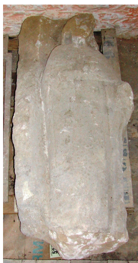
Fig. 9 : face principale côté gauche