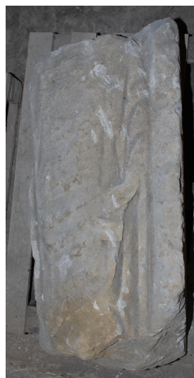
Fig. 10 : face principale côté droit