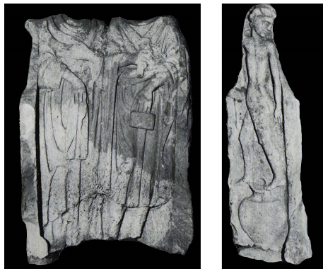
Fig. 3 : stèle 1 de Luxeuil

monuments peuvent être datés au plus tôt du milieu du II ème siècle, car des influences hellénistiques apparaissent en territoire lingon à cette époque.