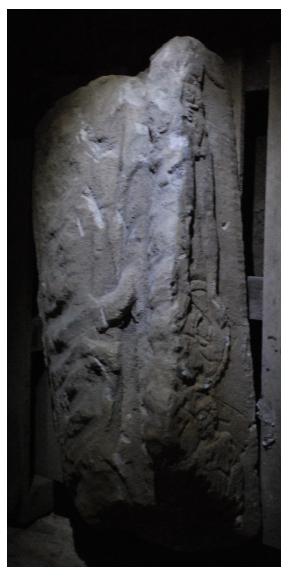
Fig. 12 : petit côté droit

Face principale côté droit : personnage masculin dont la tête a disparu. La pierre est très érodée de ce côté de la stèle et rend sa lecture très difficile. L'homme porte une tunique et un manteau. Son corps semble légèrement tourné vers son épouse, placée dans la partie gauche de la stèle. Sa main droite repose sur un objet malheureusement non identifiable.