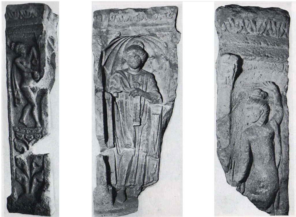
Fig. 4 : Esp. 5330 ; stèle 2 de Luxeuil

La décoration de ce monument funéraire est similaire à celles de deux autres stèles romaines provenant de Luxeuil (Haute-Saône). La première, mise au jour en 1905 et redécouverte en 1962 par le Dr Cugnier, a été extraite de la cave de la maison Clabé, rue du Chemin-Neuf. La stèle est conservée dans toute sa largeur (Fig. 3). La face principale présente un couple, en tunique et manteau. À gauche, la femme serre une serviette dans ses deux mains jointes. À droite, l'homme tient des tablettes à écrire. Les têtes des défunts sont manquantes. Le petit côté gauche est décoré de la figure d'une femme nue, en pied, vue de côté. Lucien Lerat 11 l'a identifié comme une danseuse, mais il s'agit plus probablement d'une bacchante en transe. Sa tête est retournée vers la droite, et elle avance la jambe droite 12 .