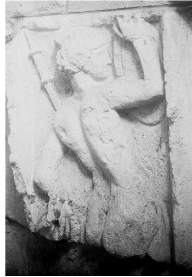
Fig. 7 : stèle de Beaune, Esp. 2104

fragment d'aile et une mèche de cheveux. Un bloc similaire a été découvert à Beaune en 1770 (Fig. 7) 19 . De même, à Metz 20 , sur le monument funéraire de deux enfants prénommés Catullianus et Secundinus, ce sont trois ménades et un bacchant qui, munis d'instruments de musique comme la lyre et le tympanon , dansent pour accueillir joyeusement les deux enfants. Ce sont les fils d'un Gaulois romanisé du nom de Catullinus, fils lui-même de Carathonus. Le thème de la ménade dansante se trouve également sur le monument funéraire du légionnaire Poblucius 21 , édifié vers 40 après J-C., ainsi que sur un fragment de pilastre, d'un siècle plus tardif, de Belval-Bois-les-Dames, conservé à Sedan 22 .