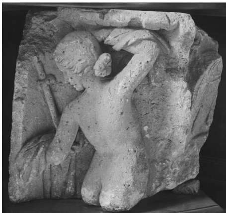
Fig. 6 : stèle de Champlieu, Esp. 3813

La figuration de scènes bachiques ou de personnages associés à ces épisodes est présente dans une grande partie de la Gaule romaine, et même au delà. Ainsi, une assise de pilastre mise au jour à Champlieu (Fig. 6) 17 , dans les ruines du Château de la Mothe, et datée du II ème -III ème siècle, montre une bacchante nue, debout, vue de dos, une écharpe passée sur les deux bras 18 . Elle porte une coiffure basse, ramenée en chignon, et cachant les oreilles. Elle tient une tige dans la main gauche, qui peut être identifiée comme étant un thyrsé ou une fêrule. À droite, en retrait, sont visibles un