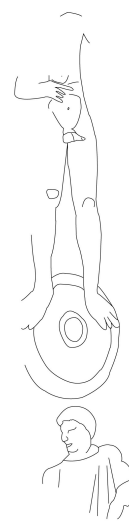
Fig. 11 : dessin du petit côté droit

Petit côté gauche : un buste féminin de petite taille, présenté de face, occupe la partie basse. Il est surmonté par un bouclier rond, sur lequel devait à l'origine être figuré un personnage de grande taille, aujourd'hui presque totalement disparu. Les plis d'un drapés sont encore quelque peu visibles.