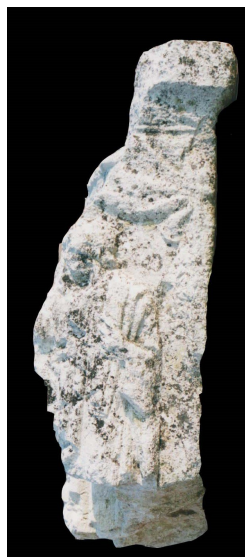
Fig. 14 : stèle de Faverolles, petit côté droit