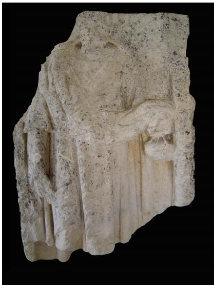
Fig. 13 : stèle de Faverolles, face principale

Une stèle funéraire mise au jour à Faverolles (à environ 20 km au nord-est de Langres) possède un décor latéral assez similaire (Fig. 13-14-15 ; photos et dessins de l'auteur). Longtemps conservée dans le parc du château de Marac, elle fut retrouvée par Jules Testevuide et ramenée au musée de Faverolles, où elle est toujours visible. Cette stèle provient très certainement de la nécropole gallo-romaine et mérovingienne du Mont Martroy, située sur la commune de Faverolles. De grande taille (H. : 0,96 m ; l. : 0,85 m ; E. : 0,35 m), la stèle devait être ornée d'un fronton, probablement triangulaire et inscrit d'une épitaphe. La face principale présente un personnage masculin debout, en pied, vêtu d'une tunique et d'un cuculus qui tombe en larges plis. La main droite, placée le long du corps, devait tenir un objet aujourd'hui illisible. La main gauche tient ce qui semble être une tablette à écrire (ou un étui à tablette) et un stylet. Ces attributs ont pu être choisis pour montrer l'érudition du défunt ou son métier. Partant de l'épaule droite, un pan de son vêtement est replié sur son bras gauche.