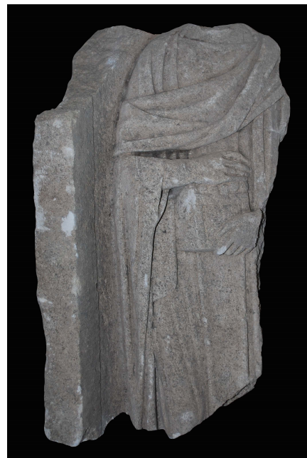
Fig. 1 : R2006.1.252, face principale