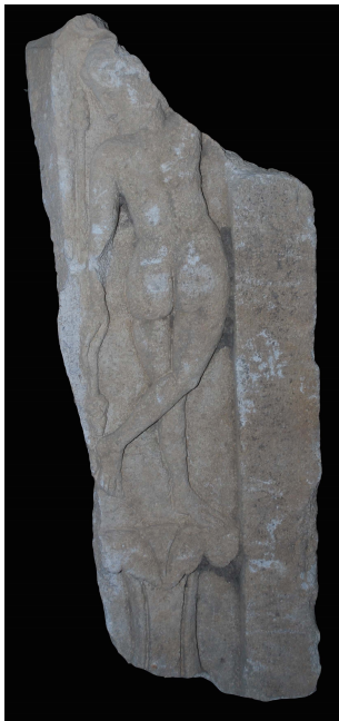
Fig. 2 : R2006.1.252, petit côté

Face principale : fragment gauche d'une stèle funéraire, présentant un personnage féminin en tunique et manteau, dont les plis sont très bien figurés (Fig. 1). Un pan du manteau part de l'épaule gauche et traverse la poitrine jusqu'au coude droit. Le manteau devait probablement tomber sur les chevilles de la défunte. Sa tête est manquante, tout comme la partie droite et le bas de la stèle. La main gauche de la défunte soutient une cassette remplie de pièces de monnaies figurées, sur laquelle repose la main droite. Le bord gauche de la stèle (le seul conservé) indique que la niche abritant la représentation de la défunte était profonde.