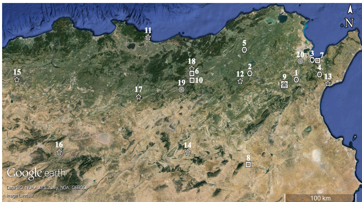
FIG. 2 : Les types architecturaux de sanctuaires de Saturne reconnus par M. Le Glay. L' area sacra à ciel ouvert (penta gone) : 1, Ain el-Djour ; 2, Ain Tounga ; 3, Bou Qournein ; 4, Tubernuc ; 5, Hr el-Faouar (?). Le sanctuaire rural à plan simplifié (carré) : 6, Bir Derbal ; 7, Bordj Cedria ; 8, Hr es-Srira ; 9, Thuburbo Maius ; 10, Sidi Mohamed el-Azreg (?). Les temples dits africains ou romano-africains : 11, Annaba ; 12, Dougga ; 13, Thinissut ; 14, Ammaedara ; 15, Cuicul ; 16, Thamugadi ; 17, Thubursicu Numidarum ; 18, Thuburnica . Le temple à plan circulaire : 19, Ksiba (?); 20, Mohammedia. Carte élaborée par B. D'Andrea.

Les aires sacrées à ciel ouvert et les sanctuaires ruraux à plan simplifié se différencient des tophets par l'absence d'urnes cinéraires, par les inscriptions votives, qui sont toujours en caractère et langue latine et, dans une moindre mesure, par la forme et l'iconographie des stèles 52 . Le modèle de référence est sans doute celui des tophets, cependant les sanctuaires de Saturne de type simplifié et les tophets ne sont jamais attestés dans la même ville ou dans la même région, comme s'ils ne se trouvaient pas en continuité l'un de l'autre mais en concurrence.