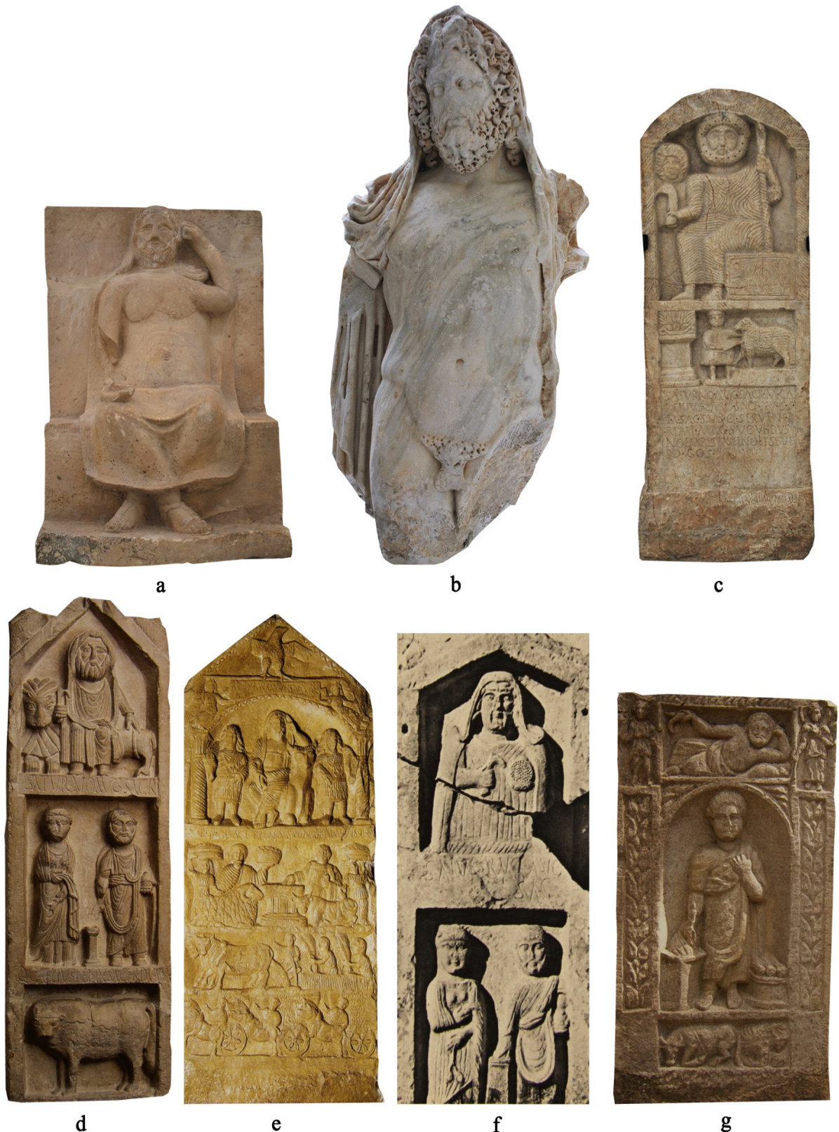
FIG. 4 : Le type iconographique du « Saturne africain » : a , statuette, (calcaire, h. 0,5 m), temple de Saturne d' Ammaedara , III e siècle apr. J.-C. ; b , statue (marbre, h. 1,14 m), Sousse, région de la ville dite « des recasements Sud », II e siècle apr. J.-C. ; c , stèle votive dédiée à Saturne (grès, h. 1,15 m), El Ayaïda, 323 apr. J.-C. (Ben Younès H., 1995 : 200) ; d , stèle dédiée à Saturne (calcaire, h. 1,70 m), Sillègue, début III e siècle apr. J.-C. (Lancel S., 2003 : 202) ; e , stèle dédiée à Saturne (calcaire, h. 1,55 m), Siliana, III e siècle apr. J.-C. (Lancel S., 2003 : 205) ; f , stèle dédiée à Saturne (calcaire, h. 1,10 m), Sillègue, III e /IV e siècle apr. J.-C. (Le Glay M., 1966b : 250, no 20, pl. XXXVI, 5) ; g , stèle dédiée à Saturne (calcaire, h. 0,87 m), Thamugadi , III e siècle apr. J.-C. (Orfali M.K., 2003 : 149). Figure élaborée par B. D'Andrea, les images ne sont pas à l'échelle.