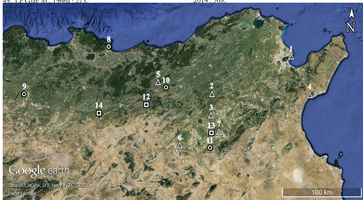
FIG. 1 : Tophets et sanctuaires de Saturne. Le sanctuaire se superpose au tophet (triangle) : 1, Carthage ; 2, Dougga ; 3, Hr el-Hami ; 4, Thinissut ; 5, Thuburnica ; 6, Althiburos (?) ; 7, Hr Ghayadha (?). Le sanctuaire est installé à proximité du tophet (cercle) : 8, Annaba ; 9, Constantine ; 10, Chimtou (?) ; 11, Maktar (?). Le sanctuaire est relativement éloigné du tophet (carré) : 12, Ksiba ; 13, Ksar Toul Zammeul (?) ; 14, Thubursicu Numidarum (?). Carte élaborée par B. D'Andrea (Google Earth © Image Landsat).