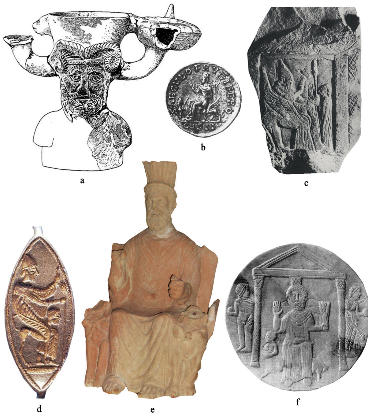
FIG. 3 : Le type iconographique traditionnellement associé à Baal Hammon : a , brûle-parfum (terre cuite, h. 0,16 m), tophet d'El Kénissia, I er siècle av. - I er siècle apr. J.-C. (Carton L., 1906 : 134-135, pl. V, 11) ; b , monnaie (or), Sousse, fin du II e siècle apr. J.-C. (Merlin A., 1910 : pl. V) ; c , stèle votive (calcaire, h. 0,17 m), tophet de Sousse, V e /IV e siècle av. J.-C. (Picard C., 1954 : Cb 1075, pl. CXXVI) ; d , bague (or, h. 0,19 m), nécropole d'Utique, IV e /III e siècle av. J.-C. (Peters S., 2004 : 235, no 13.) ; e , statuette (terre cuite, h. 0,40 m), tophet de Thinissut, II e /I er siècle av. J.-C. ; f , coupe décorée (céramique, larg. 0,30 m), ergastulum/fabrica de Chimtou, II e /I er siècle apr. J.-C. (Rakob F., 1994 : 36, tav. 123, a). Figure élaborée par B. D'Andrea, les images ne sont pas à l'échelle.

Saturne et, en effet, ses acolytes, Sol et Luna , sont représentés. Toutefois l'on observe encore des éléments typiques de Baal Hammon : la main droite levée, la main gauche qui tient un épi de blé, la couronne turrée ornée de plumes sur la tête et, surtout, le trône soutenu par deux sphinx ailés.