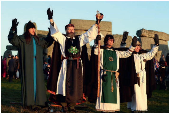
Photo 5. Néopaiens britanniques au solstice d'hiver à Stonehenge, source : Matt Cardy/Getty Images ( http://mtro.co.uk [récupéré 02/03/13])

Pour répondre à cette question, assurons-nous, au préalable, que ce parti-pris stylistique correspond bien à un phénomène réel. Ceux qui s'engagent dans ces pratiques prêtent en général une grande attention à l'élaboration de leurs activités cérémonielles. Ils n'ont rien d'exceptionnel d'un point de vue sociologique (Orion, 1995 ; Berger et al. , 2003 ; Lassalette-Carassou, 2008). Il est donc difficile de voir dans cette esthétique l'expression contingente d'une négligence ou d'une