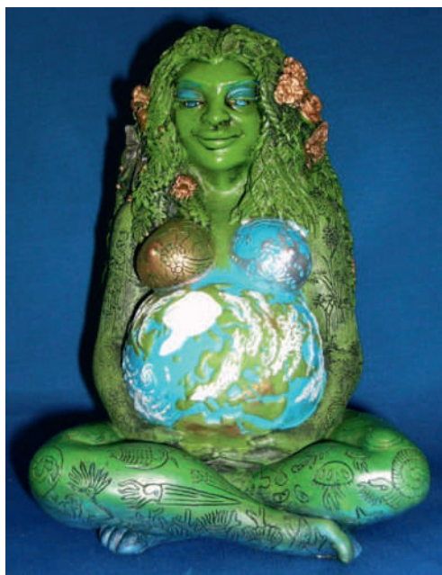
Photo 3. Sculpture de Gaïa Millénaire par Oberon Zell-Ravenheart