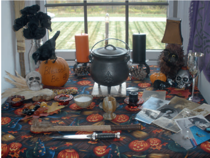
Photo 4. Un autel personnel pour la fête néopaienne de Samain