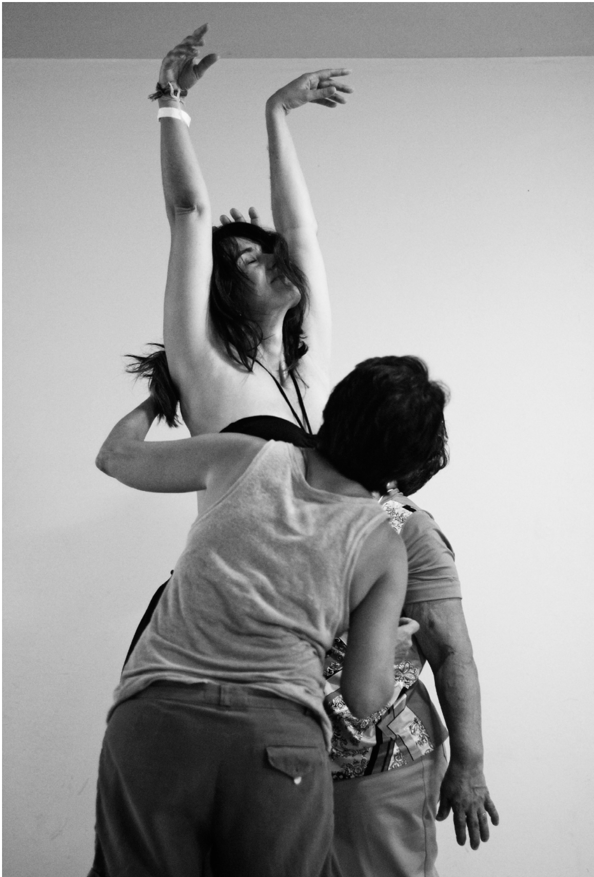
← XXIV e encontro nordestino de Biodanza au Brésil, septembre 2013. L'Autre comme témoin, soutien, inducteur de mouvements et d'émotions.

De tels moments de grâce sont d'autant plus fascinants qu'ils surgissent dans le cadre d'une danse à deux, car ils sont enrichis par une réverbération interpersonnelle : chacun voit, comprend et apprécie le fait que l'autre voit, comprend et apprécie, et cet effet de miroir augmente d'autant plus l'impression d'unité et de fluidité « naturelles » qui leur donnent leur valeur intrinsèque. Toutefois, malgré l'intensité que peuvent revêtir ces épisodes, les danseurs restent très présents à eux-mêmes, à l'autre et à la situation, notamment du fait de la survenue d'éléments potentiellement dissonants : une maladresse momentanée, une pulsion de séduction, une hésitation, une pitrerie, etc. Ces sursauts relevant de l'ordinaire s'insinuent malgré tout dans le flux du mouvement sans poser problème. L'espace d'un instant, ils sont au contraire intégrés avec fluidité dans une expérience personnelle, immédiate et gratifiante.