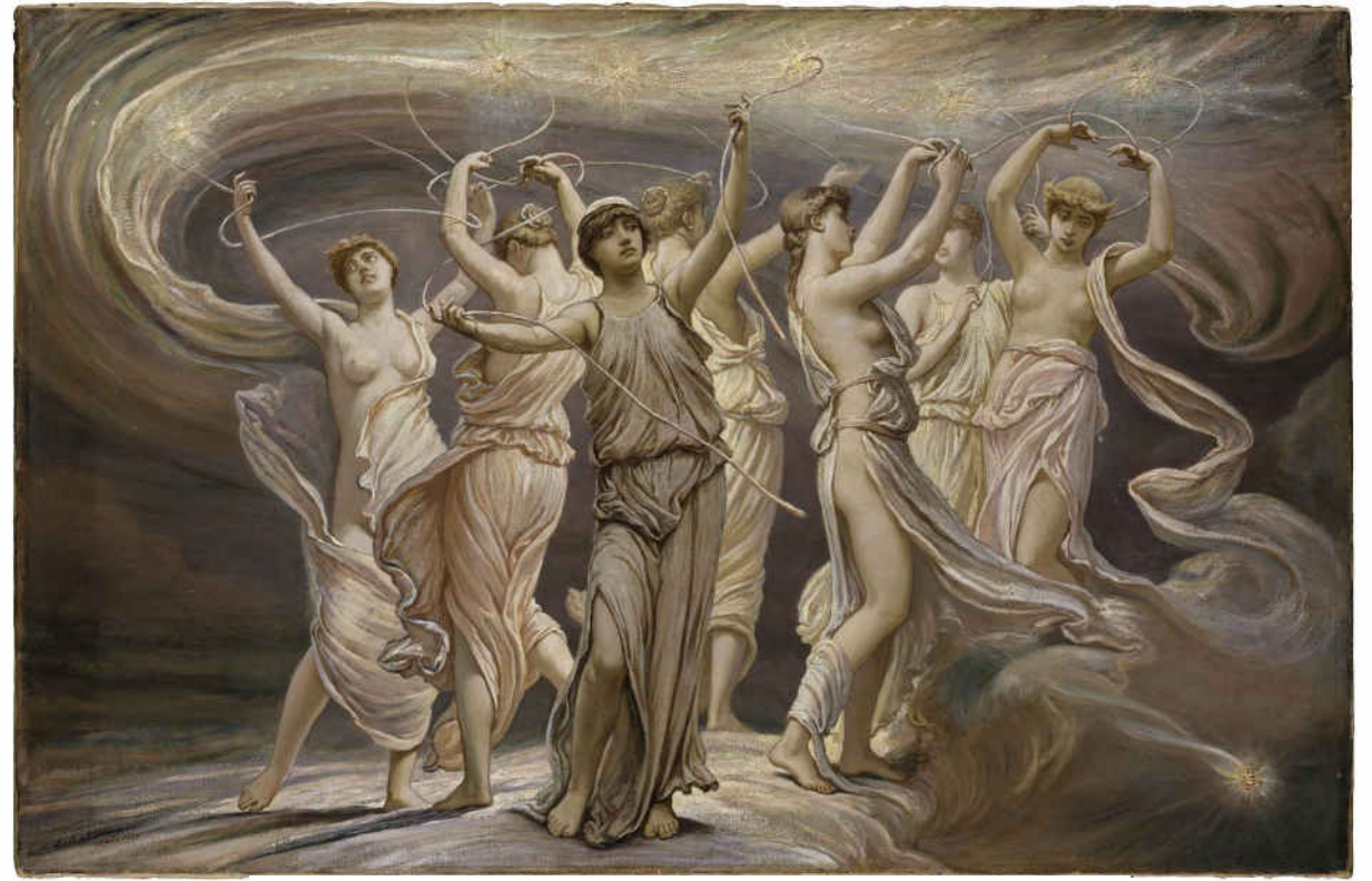
→ Les pléiades , Vedder Elihou, 1885.

Sons, odeurs, couleurs et formes, impressions kinesthésiques et tactiles, vibrations, etc., tout contribue à susciter un environnement saturé dont on ne peut s'abstraire, et qui façonne peu à peu le danseur en l'amenant à un « enivrement sensoriel » (Wacquant 2000 : 51). Cette atmosphère puissante constitue en soi une injonction à orienter l'attention vers son propre corps, ses perceptions sensorielles et les émotions qui en émanent. En d'autres termes, l'ensemble instille un mode de présence à soi à la fois