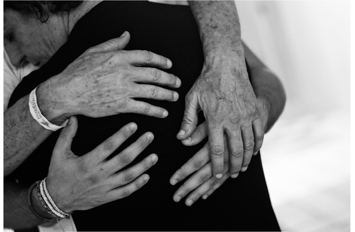
→ XXIV e encontro nordestino de Biodanza au Brésil, septembre 2013.

« Mes partenaires sont avant tout des moyens me permettant d'expérimenter mes facultés à entrer en relation avec d'autres. »