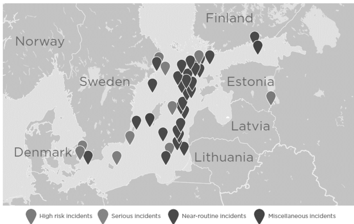
Figure n°3 : Incidents impliquant l'OTAN et la Russie