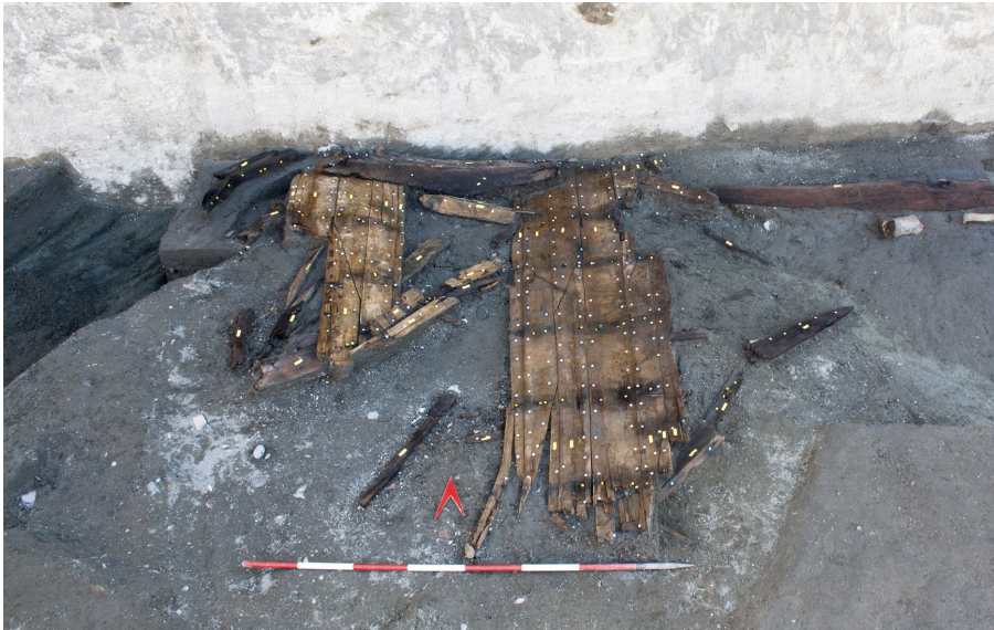
Fig. 4 – Napoli, piazza Municipio, area 4. Il relitto Napoli H (foto C. Zazzaro, cortesia Soprintendenza Archeologia Belle Arti e Paesaggio del Comune di Napoli).