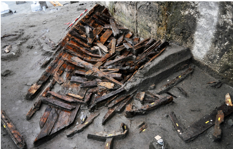
Fig. 5 – Napoli, piazza Municipio, area 4. Il relitto Napoli F.