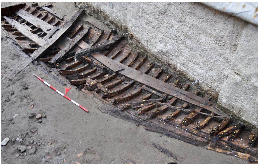
Fig. 6 – Napoli, piazza Municipio, area 4. Il relitto Napoli G.