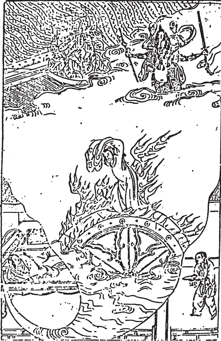
Fig. 13 : La divinité tantrique de Yichun xiangzhi .