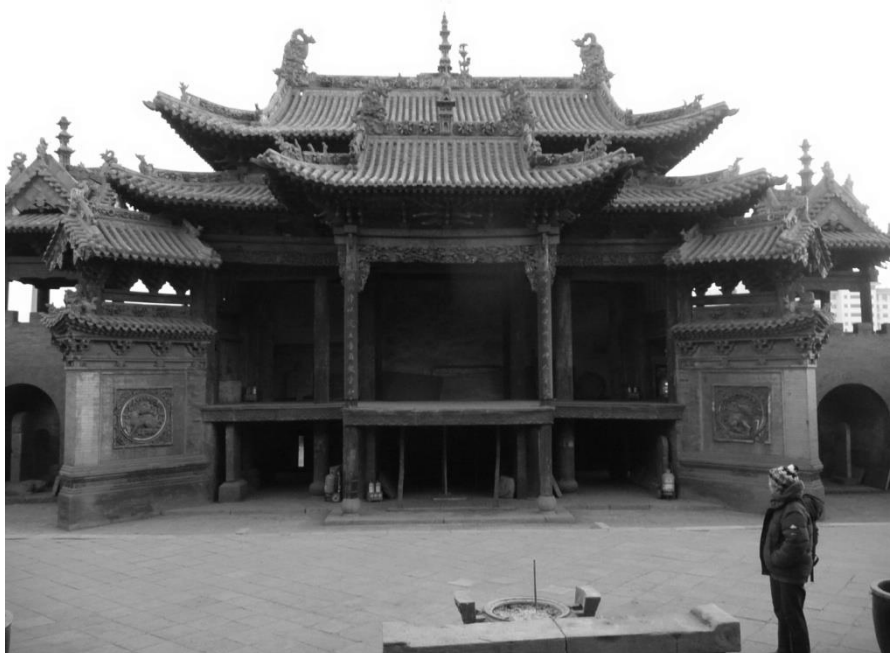
Figure 3 : Scène de théâtre ancienne : temple de l'impératrice terre (Houtu miao 后土廟), Jiexiu 介休, province du Shanxi 山西.