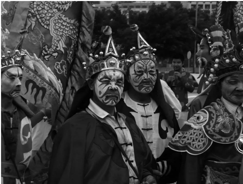
Figure 5 : Danseurs de la chorégraphie martiale yinggewu 英歌舞 de la province du Guangdong lors d'une procession à Macao (2008). Les performeurs, portant un maquillage similaire à celui des « visages peints » du théâtre, incarnent les brigands des Bords de l'eau lors de leur attaque de la citadelle de Daming (大名府) pour délivrer leur frère juré Lu Junyi 盧俊義. Voir Au bord de l'eau , chapitre 63, traduction de Jacques Dars tome 2 p. 391-412.