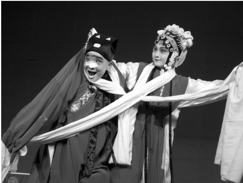
Figure 7 : Les apprentis comédiens de la troupe junior de Kunqu jouant « Sanlang saisi vivant ». Troisième festival de théâtre Kunqu, juillet 2006, Suzhou.