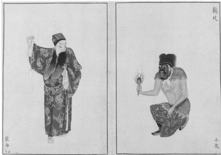
Figure 4 : Illustration pour l'opéra de Pékin Le rêve du Papillon : le taoïste Zhuangzi convoque un petit démon pour qu'il fasse passer un souffle brûlant sur la tombe du mari d'une jeune veuve, qui a imprudemment promis de ne pas se remarier avant que la terre n'ait séché sur la tombe de son époux. Extrait de l'album illustré Xingli qingyi 性理精義, œuvres d'artistes de la cour des Qing, XIX e siècle.