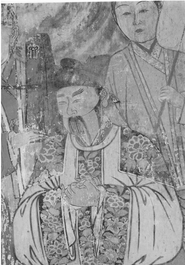
Figure 1 : Personnage masculin du théâtre zaju , époque Yuan (1277-1367). Détail de la peinture murale du temple du Roi des Lumineuses réponses (Mingying wang 明應王), Hongdong 洪洞, province du Shanxi 山西.