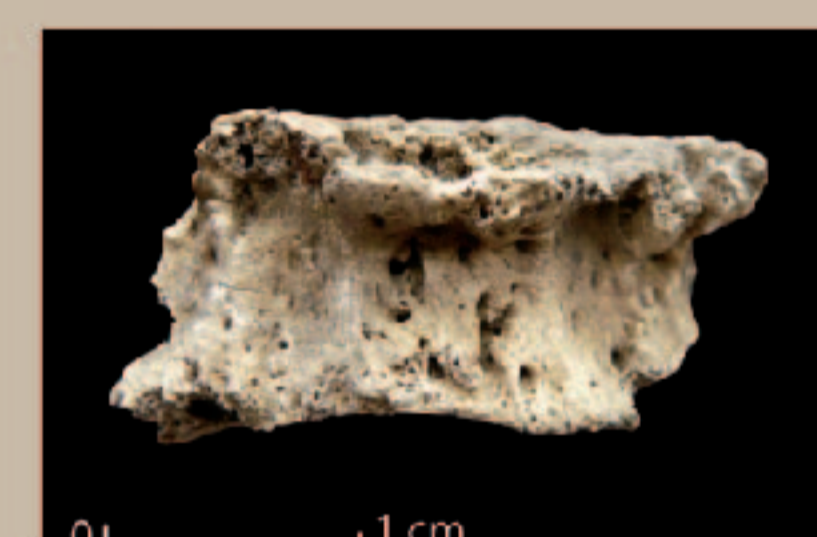
Fragment de vertèbre brûlée présentant des atteintes pathologiques (arthrose)

L'approche archéo-anthropologique, fait appel à une multitude de données: outre l'étude des éléments propres à la sépulture (biologie, architecture, taphonomie, mobilier, etc...), elle prend en compte la spatialisation des éléments dans la structure, mais également celle de la structure au sein de l'ensemble funéraire, puis plus largement au niveau régional. Cette approche archéo-thanatologique est indispensable dans le cadre d'une étude funéraire et est à associer à l'analyse des données historiques, environnementales et archéologiques locales. Elle participe ainsi du prisme de lecture multiple nécessaire à la compréhension optimale de ces ensembles funéraires. Cette approche a fourni des résultats significatifs sur le site de Richeaume XIII.