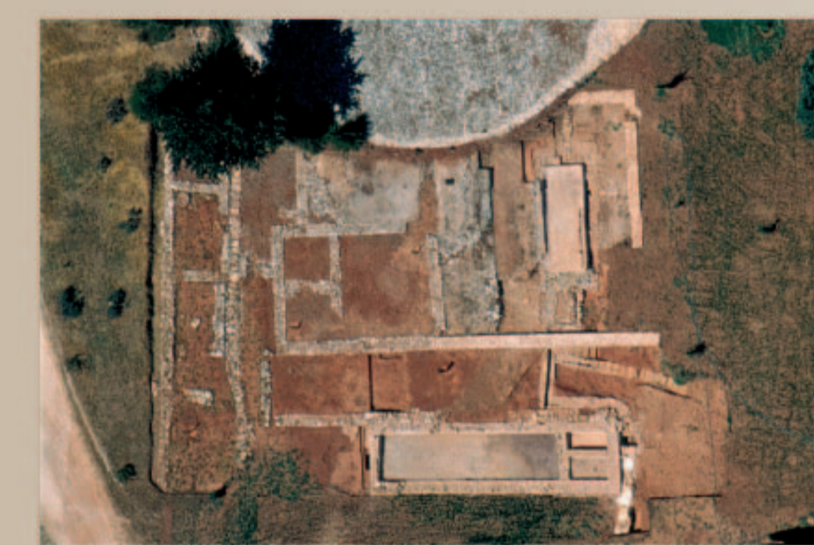
Vue aérienne des vestiges de la villa de Richeaume I Cliché Chr. Hussy, SRA-PACA