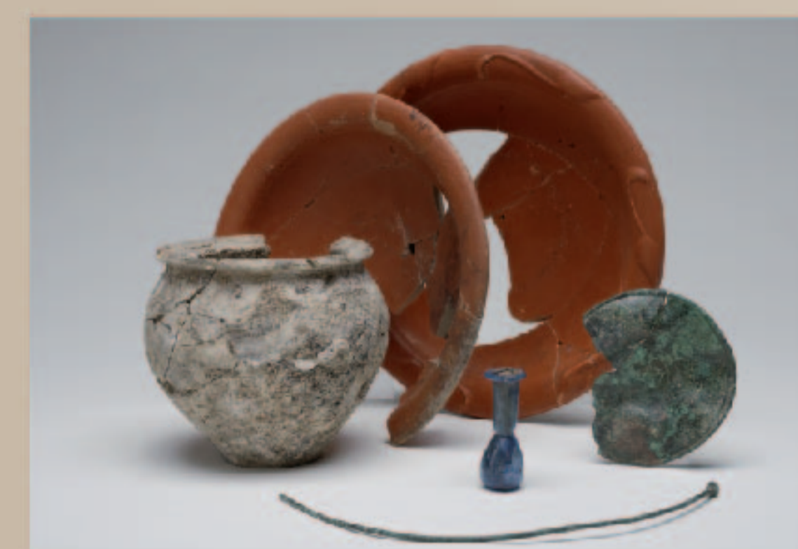
Mobilier découvert dans les structures de crémation INC 14 et INC 17