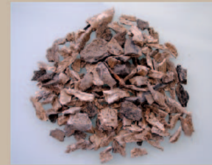
Lot d'ossements humains brûlés provenant d'une structure de crémation