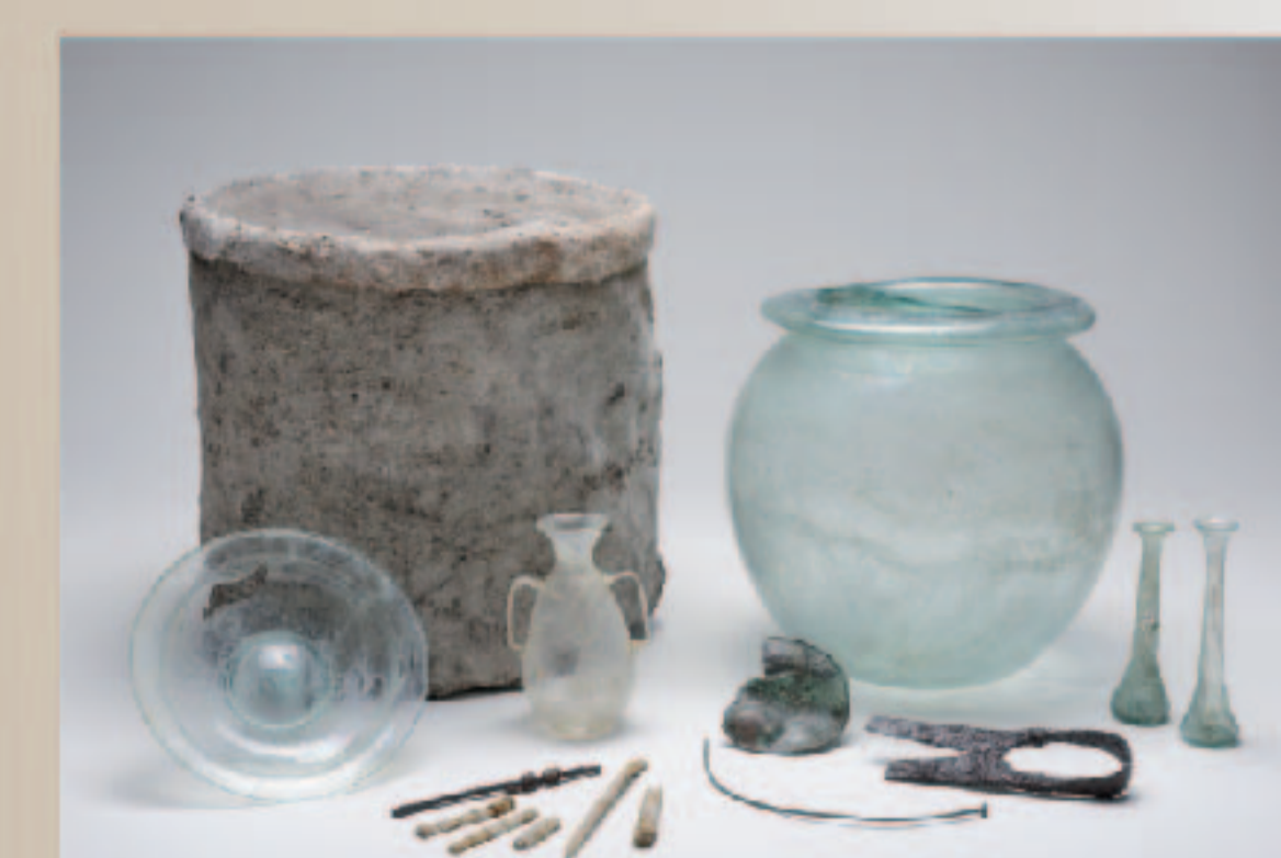
Mobilier découvert dans les structures de crémation INC 14 et INC 17