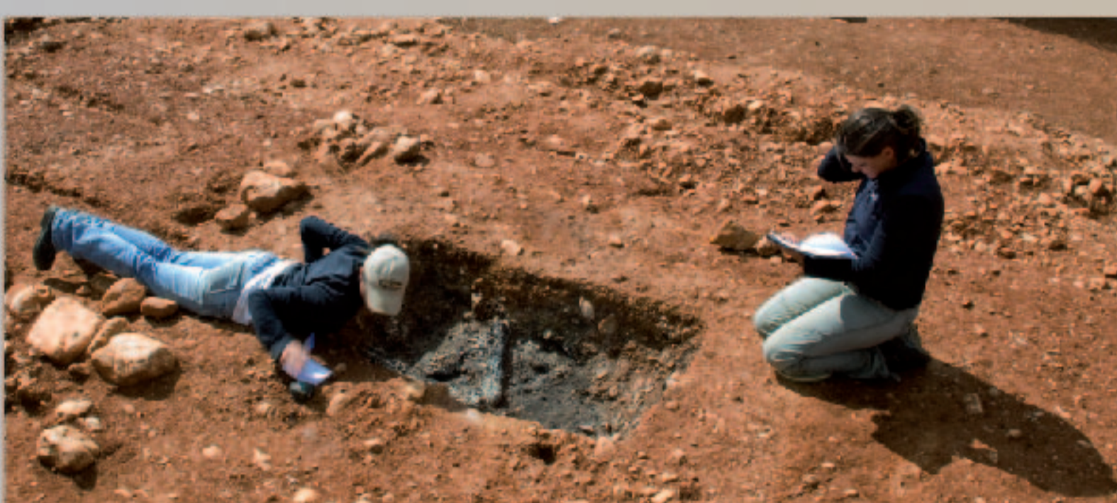
Bûcher INC 14 en cours de fouille et de relevés

Au cours du Haut-Empire, la pratique de la crémation est quasi-exclusive à Richeaume XIII et témoigne d'une grande variabilité et complexité des gestes. La multiplicité et la diversité des dépôts mobiliers (verre, céramique, métal, dépôts alimentaires et végétaux... etc.) participent à la polysémie des rites : elles illustrent en particulier le dernier repas rituel partagé entre les vivants et le défunt, témoignent des libations et des rites commémoratifs sur les différents lieux de mémoire (la sépulture, le bûcher, les fosses accessoires ou rituelles, etc...). Ces gestes traduisent une appartenance socio-culturelle, idéologique, ou un statut particulier. La sépulture est élaborée comme un véritable espace cultuel, support de croyances définissant l'appartenance et le rôle de l'individu au sein d'une communauté qui lui est propre. La sépulture et les structures satellites sont les éléments qui permettent de commémorer le défunt en ancrant son souvenir dans l'espace des vivants.