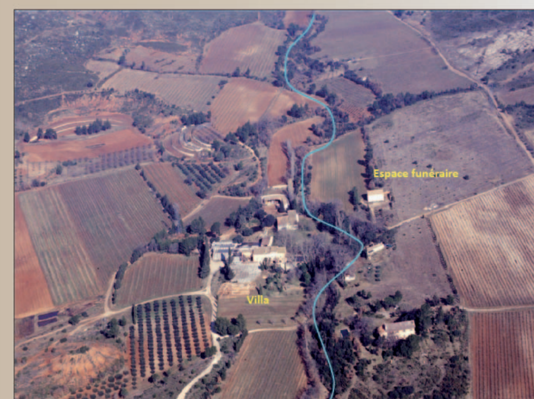
Vue aérienne du Domaine de Richeaume

Achevée en 2012, la fouille a livré quarante-trois structures à vocation funéraire datées entre le I er et le IX e s. de n.è. L'élément fondateur de cette occupation funéraire est l'édification, au milieu du I er s. de n.è., d'un vaste monument funéraire de plan carré de plus de 166 m 2 autour duquel a été mis en évidence un niveau de circulation en creux. Ce monument accueille, avant son scellement définitif, des structures de crémation mais également des fosses de plantation et un marqueur central de nature indéterminé (poteau ? colonne ?). Installé au cœur du domaine, ce monument est conçu dès sa construction comme un jardin funéraire parcouru par les vivants, ayant fonction de mausolée. Marqueur du paysage, il devient rapidement un élément polarisateur en attirant autour de lui de nombreuses autres sépultures à crémation au Haut Empire, puis à inhumation au cours de l'Antiquité tardive.