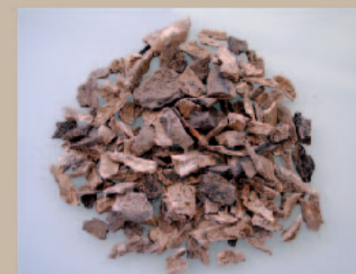
Lot d'ossements humains brûlés provenant d'une structure de crémation