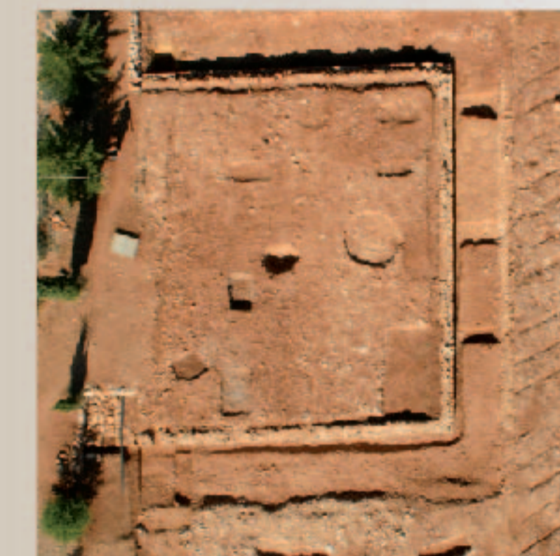
Vue aérienne du monument E1 du site de Richeaume XIII