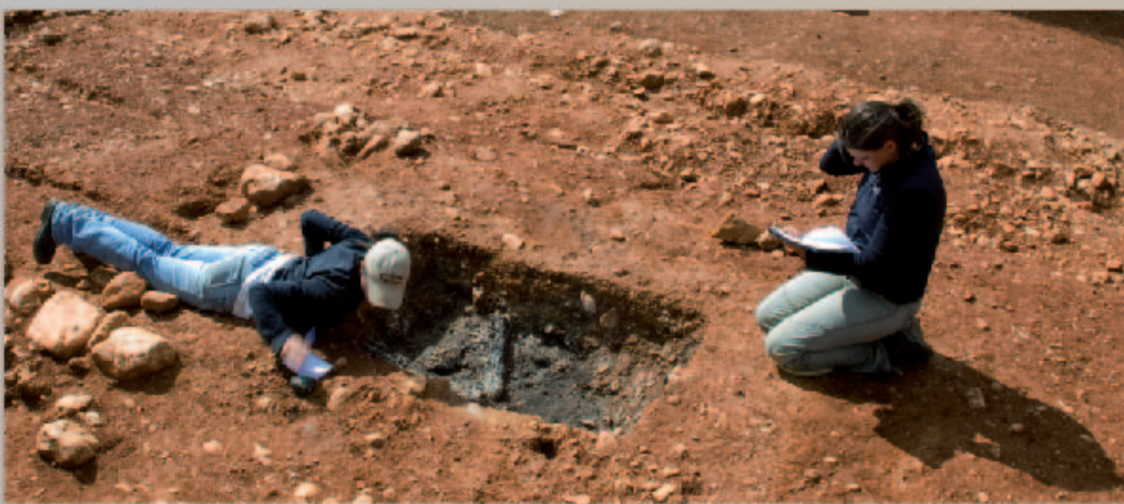
Bûcher INC 14 en cours de fouille et de relevés

Au cours du Haut-Empire, la pratique de la crémation est quasi-exclusive à Richeaume XIII et témoigne d'une grande variabilité et complexité des gestes. La multiplicité et la diversité des dépôts mobiliers (verre, céramique, métal, dépôts alimentaires et végétaux... etc.) participent à la polysémie des rites : elles illustrent en particulier le dernier repas rituel partagé entre les vivants et le défunt, témoignent des libations et des rites commémoratifs sur les différents lieux de mémoire (la sépulture, le bûcher, les fosses accessoires ou rituelles, etc...). Ces gestes traduisent une appartenance socio-culturelle, idéologique, ou un statut particulier. La sépulture est élaborée comme un véritable espace cultuel, support de croyances définissant l'appartenance et le rôle de l'individu au sein d'une communauté qui lui est propre. La sépulture et les structures satellites sont les éléments qui permettent de commémorer le défunt en ancrant son souvenir dans l'espace des vivants.