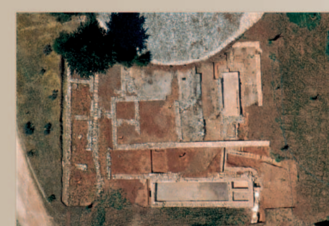
Vue aérienne des vestiges de la villa de Richeaume