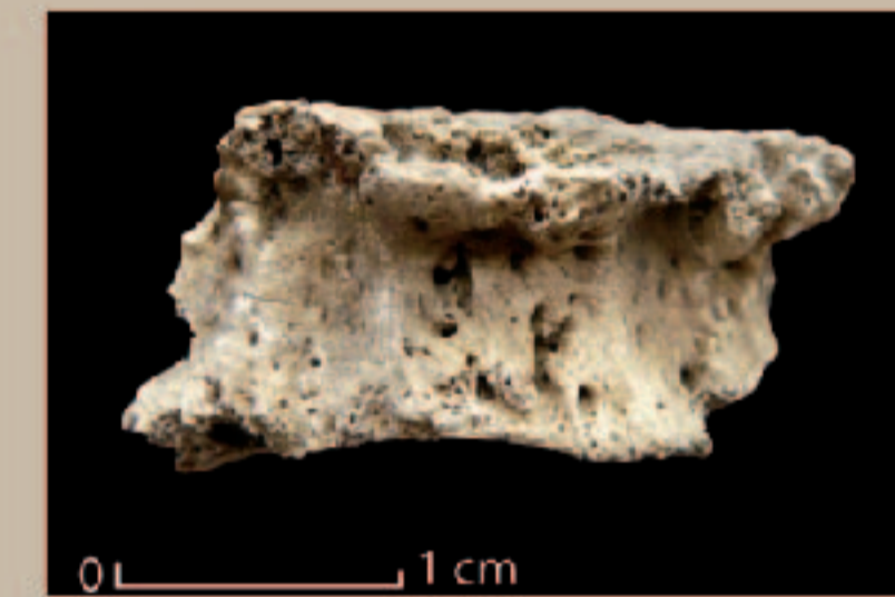
Fragment de vertèbre brûlée présentant des atteintes pathologiques (arthrose)

L'approche archéo-anthropologique, fait appel à une multitude de données: outre l'étude des éléments propres à la sépulture (biologie, architecture, taphonomie, mobilier, etc...), elle prend en compte la spatialisation des éléments dans la structure, mais également celle de la structure au sein de l'ensemble funéraire, puis plus largement au niveau régional. Cette approche archéo-thanatologique est indispensable dans le cadre d'une étude funéraire et est à associer à l'analyse des données historiques, environnementales et archéologiques locales. Elle participe ainsi du prisme de lecture multiple nécessaire à la compréhension optimale de ces ensembles funéraires. Cette approche a fourni des résultats significatifs sur le site de Richeaume XIII.