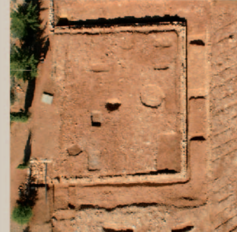
Vue aérienne du monument E1 du site de Richeaume XIII