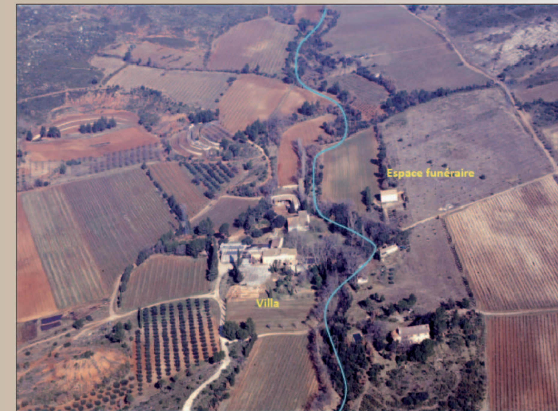
Vue aérienne du Domaine de Richeaume

Achevée en 2012, la fouille a livré quarante-trois structures à vocation funéraire datées entre le I er et le IX e s. de n.è. L'élément fondateur de cette occupation funéraire est l'édification, au milieu du I er s. de n.è., d'un vaste monument funéraire de plan carré de plus de 166 m 2 autour duquel a été mis en évidence un niveau de circulation en creux. Ce monument accueille, avant son scellement définitif, des structures de crémation mais également des fosses de plantation et un marqueur central de nature indéterminé (poteau ? colonne ?). Installé au cœur du domaine, ce monument est conçu dès sa construction comme un jardin funéraire parcouru par les vivants, ayant fonction de mausolée. Marqueur du paysage, il devient rapidement un élément polarisateur en attirant autour de lui de nombreuses autres sépultures à crémation au Haut Empire, puis à inhumation au cours de l'Antiquité tardive.