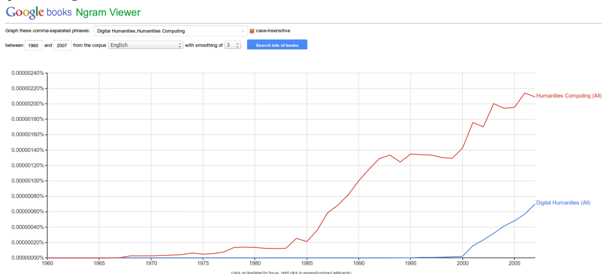
Image 1 : Comparaison de l'utilisation de digital humanities et humanities computing sur N'gram

L'essor du terme digital humanities est progressif et supprime dorénavant complètement celui d' humanities computing . La fréquence d'utilisation de l'expression digital humanities peut être symbolisée par une visualisation proposée par l'outil Google Ngram qui effectue des requêtes sur les occurrences d'une expression dans les ouvrages numérisés de Google Livres (ou Google Books). Si humanities computing reste l'expression majoritaire en 2008 (date des dernières données consultables) l'expression digital humanities monte en flèche 29 .