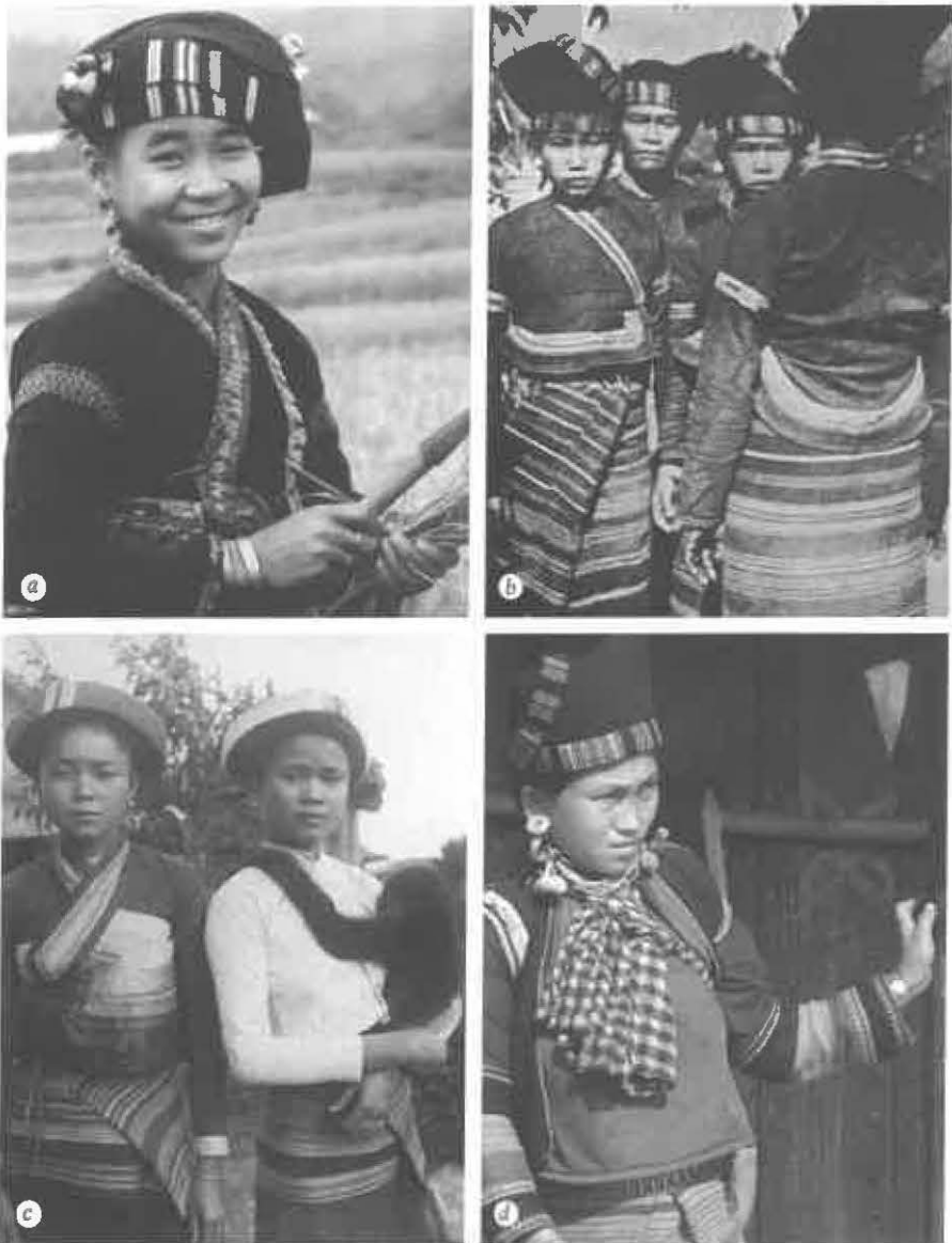
Fig. 2. Costumes des Tai Lu du Viêt-Nam, en regard de ceux des Tai Lu et des Mouchi du Laos