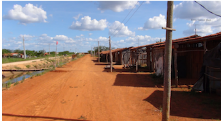
Casa e espaço comuns no acampamento