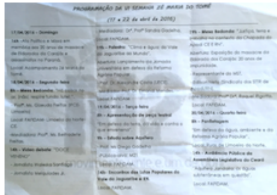
Panfleto sobre os agrotóxicos