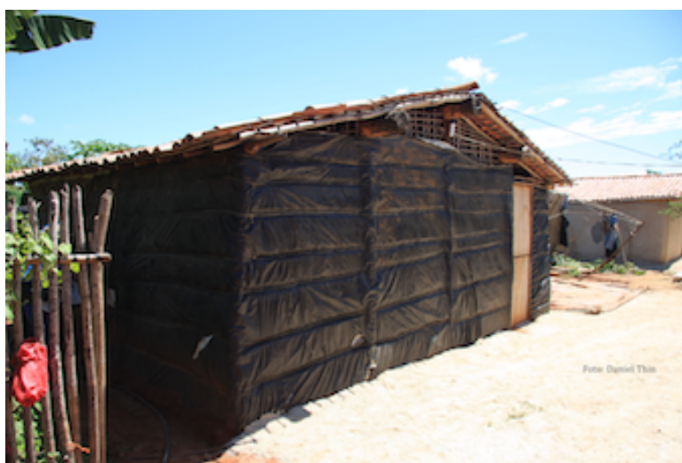
Casas e canal de irrigação