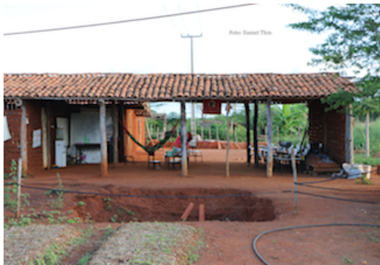
Plantações no acampamento