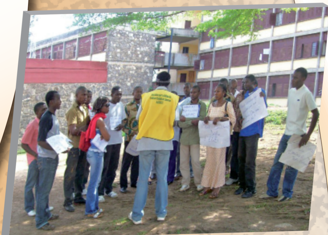
22 mai 2009 Rassemblement encadré par l'ADDEC sur le logement étudiant devant la Direction du Centre des Œuvres Universitaires de Yaoundé I