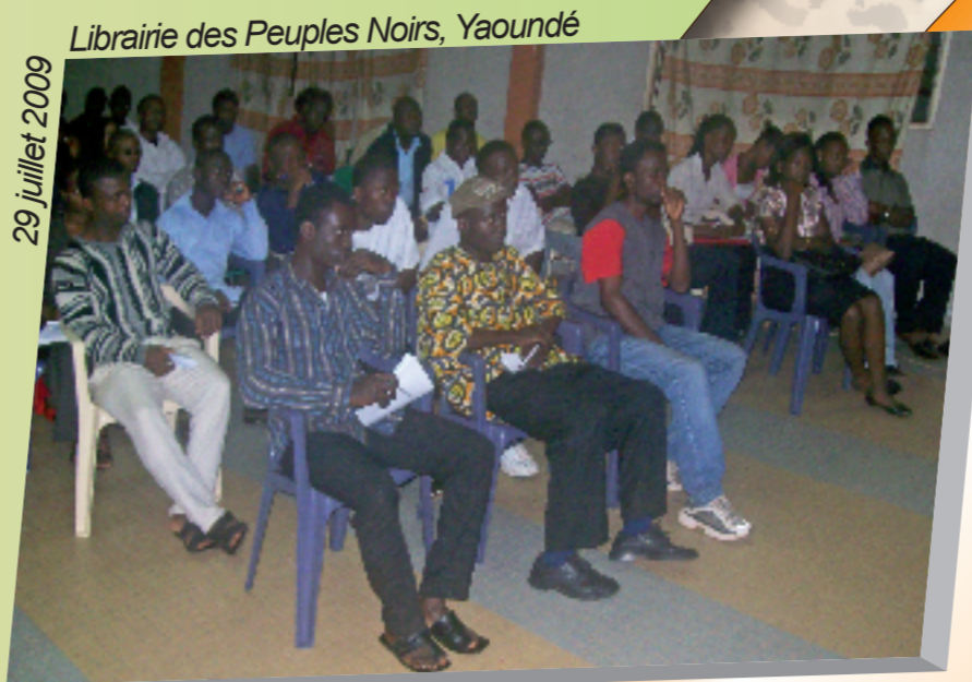
29 juillet 2009 Librairie des Peuples Noirs, Yaoundé Journées de réflexion sur le thème : L'étudiant : sujet actif ou passif du processus démocratique au Cameroun ?

Financé par l'Ambassade américaine 8 361 500 FCFA = 12 747 €