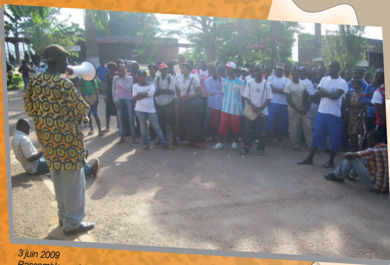
3 juin 2009 Rassemblement encadré par l'ADDEC pour le paiement d'émoluments devant le Rectorat de l'Université Yaoundé I