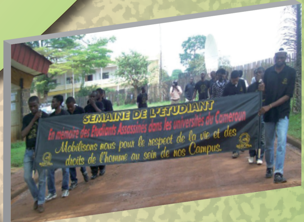
8 mai 2009 Semaine de l'étudiant organisée par l'ADDEC Université Yaoundé I