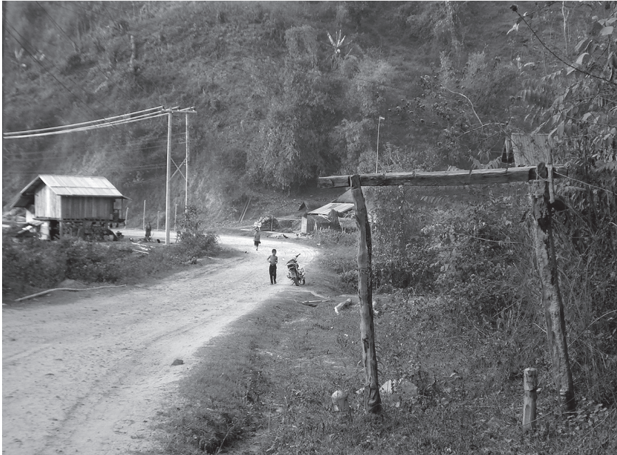
Fig. 4: Une porte protégeant le village des mauvaises influences