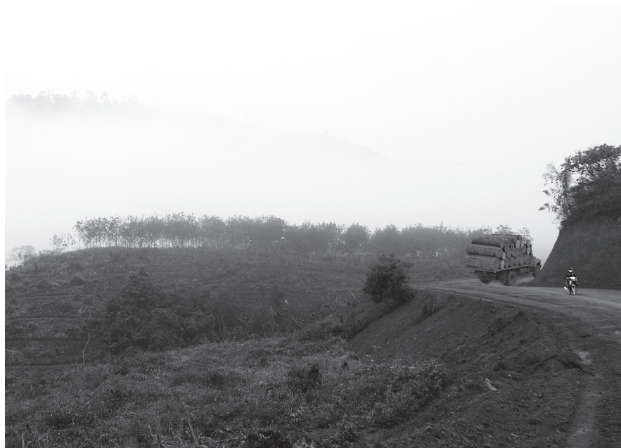
Fig. 11 : Transport de bois sur une route nouvelle traversant un champ d'hévéas