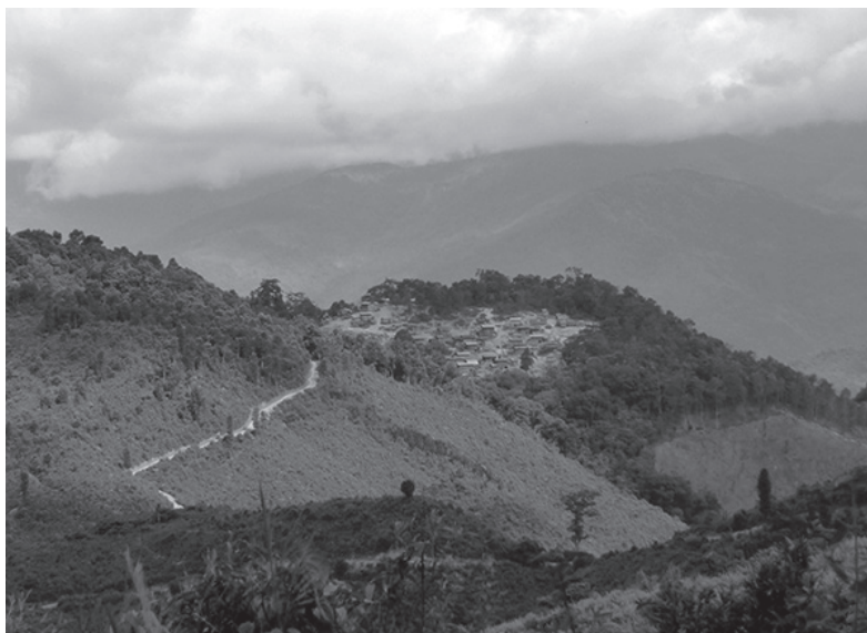
Fig. 5: Village d'essarteur situé sur un sommet