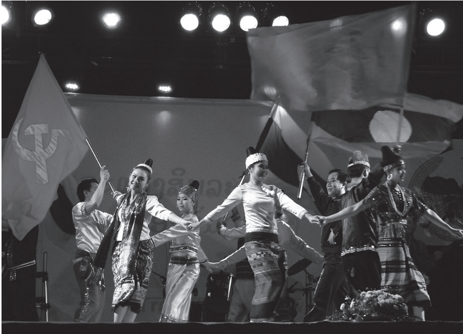
Fig. 9 : Danse d'ouverture d'un festival représentant des femmes en costume ethnique dansant sous les drapeaux communistes et laotiens