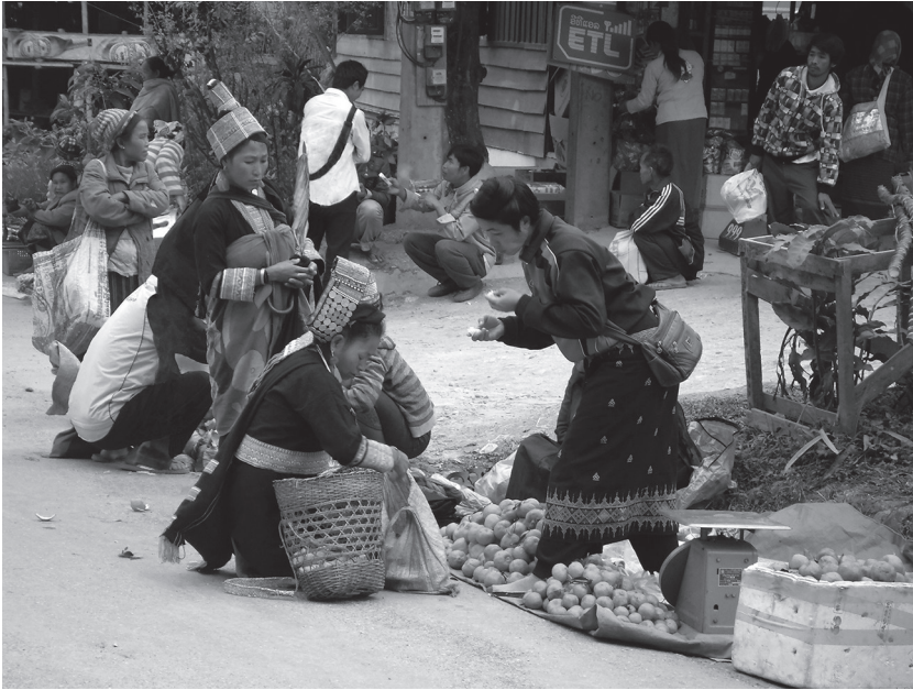
Fig. 7: Échange de produits lors d'un marché entre groupes Tai des vallées et populations des hauteurs (Paknamnoy, district de Khoua)