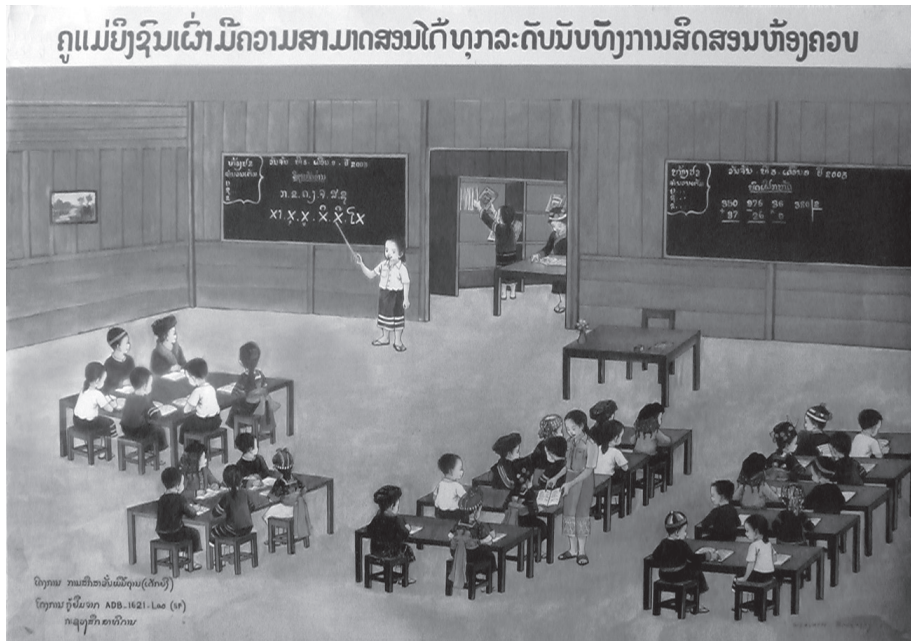
Fig. 10: Affiche d'une école modèle pluriethnique