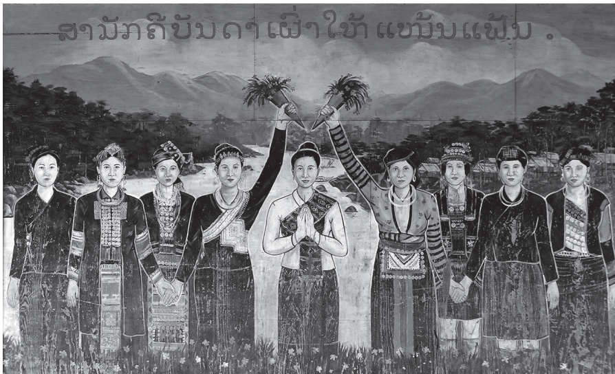
Fig. 2 : Fresque représentant les différentes ethnies du district de Samphan (au centre : la représentation de l'ethnie lao)

La volonté de simplifier ces classifications et d'en faire un instrument unificateur fut à l'origine d'une classification tripartite vers le début des années 1960 (il y a débat pour savoir si ce fut par les royalistes ou les communistes) : celle entre Lao(tiens) du bas, Lao(tiens) des hauteurs, Lao(tiens) des sommets (Lao Loum, Lao Theung, Lao Soung). Cette classification eut un certain succès ; quoiqu'abolie, elle est encore en vigueur dans les faits. Elle offrait l'avantage d'être simple, neutre (supprimant l'ancien terme péjoratif de Kha, « esclave » – ainsi Kha Bit ou Kha Kheu devinrent Lao Bit et Lao Kheu – et se basant sur une logique d'habitat), intégratrice (tous portaient un même dénominateur commun qui faisait d'eux les citoyens d'un même pays), tout en renvoyant à une certaine réalité puisqu'elle reprenait un découpage ancien (Tai/Kha + « allogènes » venus de Chine).