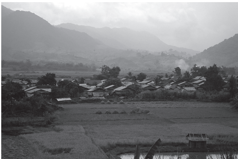
Fig. 6: Village rizicole de fond de vallée

Ici ban Mounteun, district de Bountay. On voit un essart de l'année passé au premier plan et un essart semé à droite.