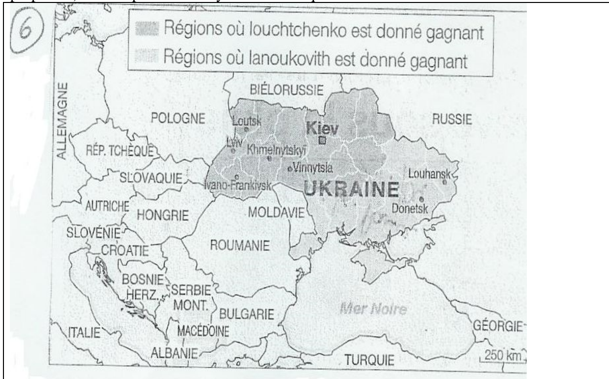
Figure 6 : Infographie 6

Nous nous plaçons maintenant presque au milieu du jeu (6 ème infographie sur les 15 proposées) et nous pouvons essayer de voir de quelle manière celui-ci a évolué.