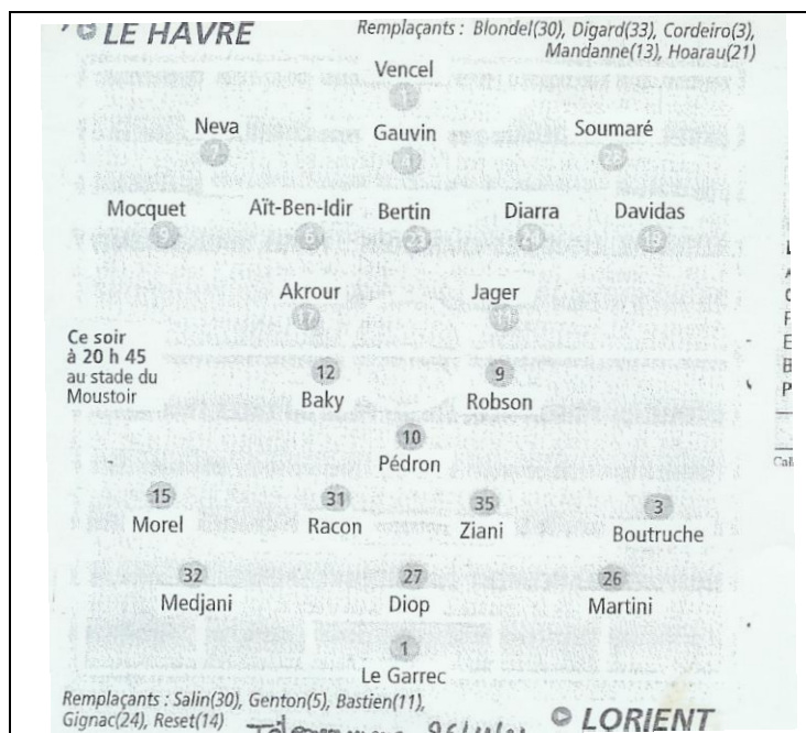
Figure 11 : Infographie présentée dans l'acte 2

De notre point de vue, cette infographie de type « feuille de match » n'est absolument pas de type anticipation. C'est la feuille fournie à la presse par le sélectionneur. Elle concerne certes un match à venir, mais elle serait une anticipation s'il s'agissait d'un pronostic posé par les journalistes. Du coup, le contrat se trouve « tronqué » : il ne s'agit pas de s'exprimer sur l'infographie elle-même, mais sur l'événement qui la porte (le match), et ceci sans disposer de l'article. Nous sommes ici, dans un moment charnière, parce que cette infographie, Pierre et ses camarades avaient tous eu le temps de la regarder. Ils en ont donc le souvenir « en contexte » : celui de l'article sur le match. Ce ne sera plus le cas ensuite. Il s'agit d'une ostension (Brousseau, 1998) que l'on peut qualifier de paradoxale, en terme de communication. On montre l'infographie et on dit de regarder l'événement. Cela est encore possible lorsque les élèves ont le souvenir de la lecture du journal (lors de la séance 2, ils avaient le journal sous les yeux). Ensuite, cela devient intenable. La professeure a probablement pensé que le fait d'isoler l'infographie permettrait de se concentrer sur ses spécificités 22 . En fait, c'est l'inverse qui se produit. Il est nécessaire de comparer le texte et l'image.