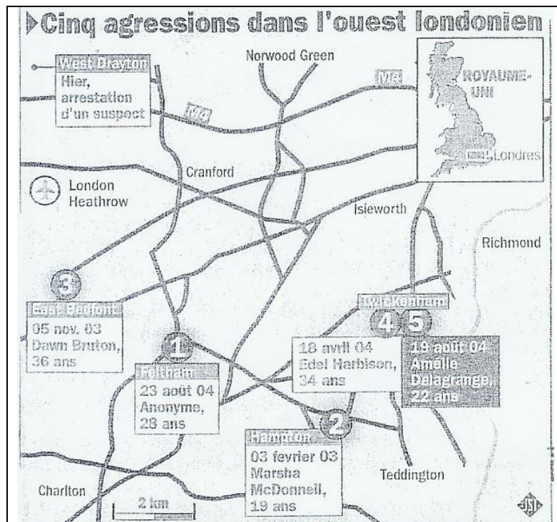
Figure 8 : Infographie 13