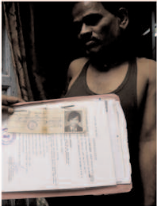
fig. 3 Carte d'accès à la procédure de relogement