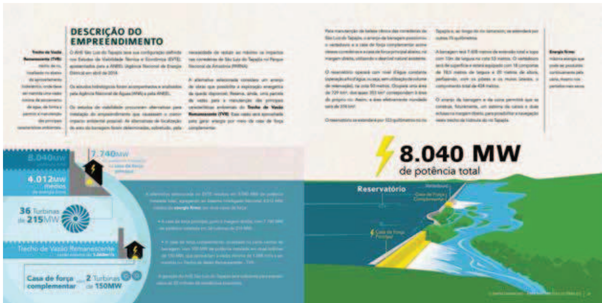
Imagem 2. Páginas do relatório de impacto ambiental (Rima) da usina hidrelétrica (UHE) de São Luiz do Tapajós. O documento tenta tornar mais acessíveis os dados técnicos do EIA, levando-os ao entendimento do público geral (Brasil, Centrais Elétricas Brasileiras S.A., [2014]).

laçamento quântico” e quejandos – está ausente da cognição dos autores deste pequeno texto. Apenas na imagem 1, extraída de um documento que pretende traduzir os estudos em termos mais acessíveis, encontramos uma série de mais de 14 conceitos – como “superfície”, “metros”, “quilômetros,” “quilômetros quadrados”, “milhões”, “megawatts”, “vazão remanescente”, “vertedouro”, “desnível”, “mínimo” – que estão totalmente ausentes da cultura munduruku, além de termos parcialmente ausentes, como “largura”, “comprimento” e “direita”, que, entre os Munduruku, têm outros sentidos.