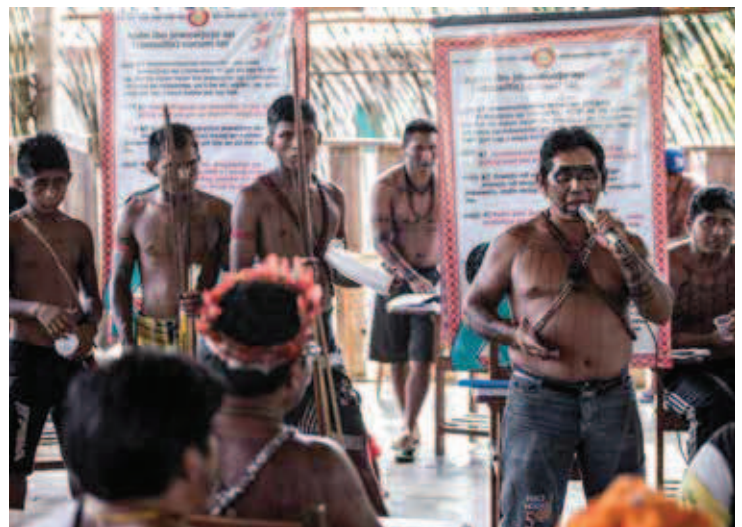
Imagem 3. Indígenas Munduruku em oficina sobre o direito à consulta livre, prévia e informada, na aldeia Waro Apompu, Terra Indígena Munduruku. Por Maurício Torres, set. 2014.

Os Munduruku, entretanto, não se espantaram quando, transcorridos menos de dez dias da reunião, o governo federal desrespeitou absolutamente o que fora acordado e, por meio do Ministério de Minas e Energia (MME), publicou a Portaria nº485, agendando o leilão da (pre-tensa) UHE São Luiz do Tapajós para 15 de dezembro seguinte. Note-se: o leilão só poderia ocorrer após a LP, a ser conferida pelo Instituto Brasileiro do Meio Ambiente e dos Recursos Naturais Renováveis (Ibama), ao passo que a LP, por ordem judicial, deveria ser necessariamente precedida pela CLPI. Ou seja, sem considerar todas as dificuldades de comunicação entre os Munduruku e os não índios, algumas das quais elencadas no presente texto, o governo pretendia tomar por “entendido” pelos indígenas, em ques-