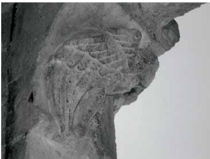
Fig. 6 - Montceaux-l'Étoile : église Saint-Pierre, portail ouest, console sud – sirène.

Il en est de même pour la console sud. Elle représente une sirène-oiseau accueillant le visiteur (fig. 6). Alors que les autres éléments représentent une scène bien précise, seule cette console oscille entre motif décoratif et historié, la position de la sirène pouvant en effet faire écho à une fonction quelconque d'accueil.