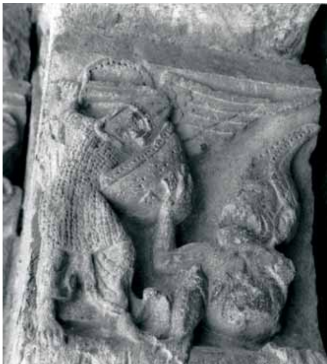
Fig. 5 - Montceaux-l'Étoile : église Saint-Pierre, portail ouest, console nord – psychomachie.

Le traitement du thème de la console nord laisse également perplexe. En effet, le sujet est classique mais la manière de le mettre en image est pour le moins originale. Saint Michel est représenté en train de vaincre un démon. Il est lourdement armé : il a revêtu une cotte de maille, un casque à heaume, et est sur