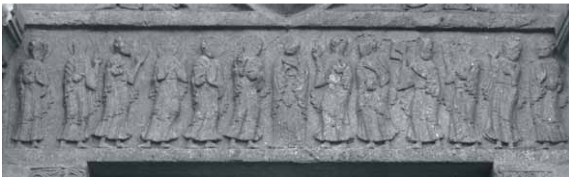
Fig. 8 - Anzy-le-Duc : église priorale Notre-Dame, portail ouest – linteau.