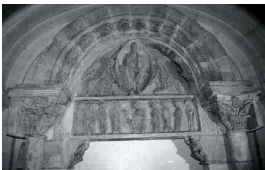
Fig. 10 - Anzy-le-Duc : tympan d'Arcy (conservé au musée du Hiéron, Paray-le-Monial) – Allaitement de la Vierge.