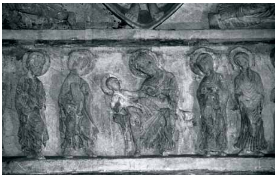
Fig. 11 - Anzy-le-Duc : tympan d'Arcy (conservé au musée du Hiéron, Paray-le-Monial) – Allaitement de la Vierge, détail de la Vierge allaitant (cliché M. Guénot).

Le programme iconographique s'étend alors à tout le prieré. À l'instar des plus grands ensembles, il est possible d'envisager les portails d'Anzy-le-Duc sous deux aspects : soit ils peuvent être lus de manière indépendante, soit ils s'inscrivent dans un programme iconographique de plus vaste ampleur, s'étendant à tout un ensemble architectural.