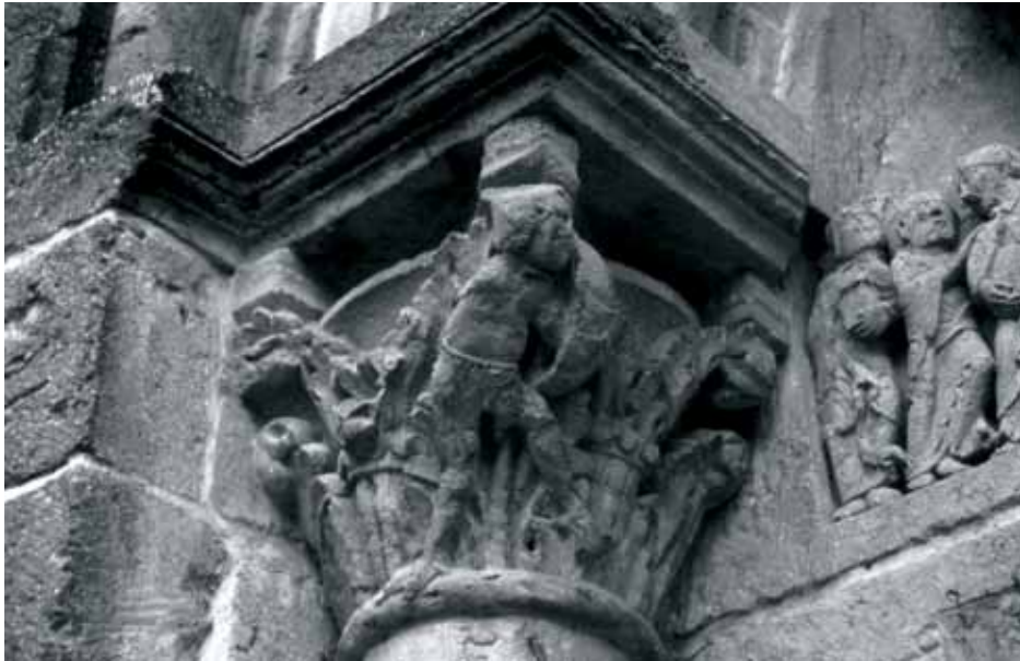
Fig. 3 - Montceaux-l'Étoile : église Saint-Pierre, portail ouest – chapiteau nord.

En pendant, le second chapiteau soulève de nouvelles interrogations. Un saint (comme le prouve son auréole) est recroquevillé derrière un végétal. Il regarde vers le tympan que lui montre un ange. Ses mains sont voilées, mais ne portent aucun objet sacré comme un livre (fig. 4). Ce chapiteau a également fait couler beaucoup d'encre : est-ce une représentation d'Ézéchiel dévorant un livre, ou encore la vision de saint Jean à Patmos ? Cela est peu plausible. Si elle s'intègre totalement au programme, comme tend à le démontrer le geste de l'ange vers le chapiteau, son sujet reste indéfinissable.