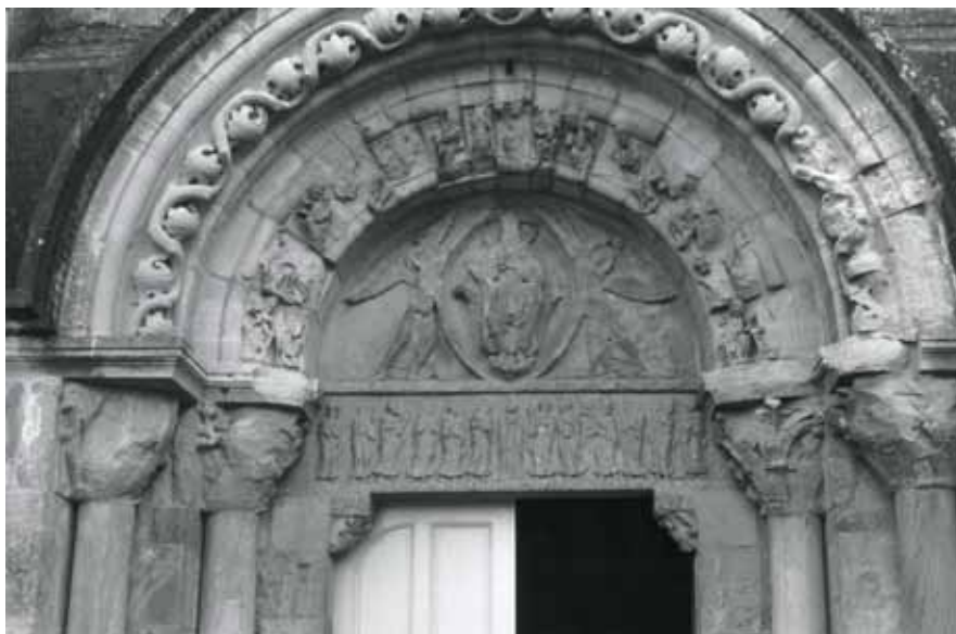
Fig. 7 - Anzy-le-Duc : église priorale Notre-Dame, portail ouest – tympan de l'Ascension (cliché M. Guénot).

Mais la majorité des représentations de l'Ascension compte douze personnages : soit saint Paul est associé à l'événement, bien que sa rencontre avec le Christ soit postérieure à l'épisode, soit l'on représente une vérité institutionnelle et non historique.