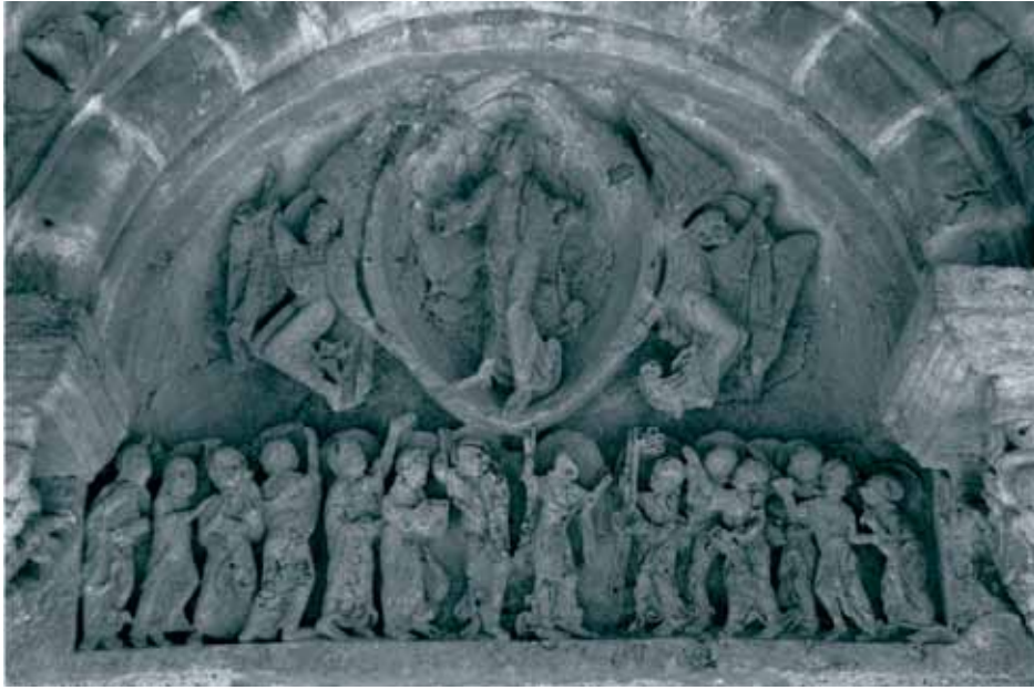
Fig. 2 - Montceaux-l'Étoile : église Saint-Pierre, portail ouest – tympan de l'Ascension.