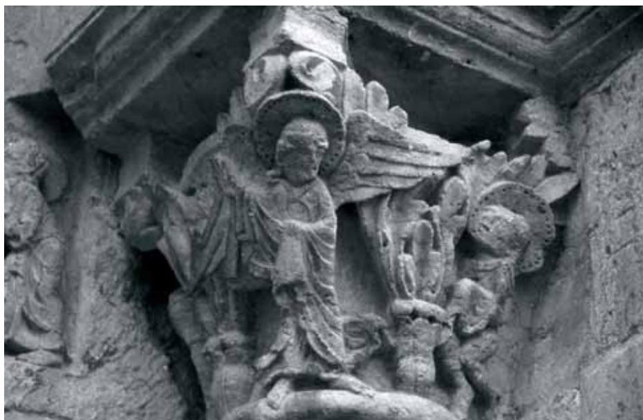
Fig. 4 - Montceaux-l'Étoile : église Saint-Pierre, portail ouest, chapiteau sud – ange et un saint.

Le traitement du thème de la console nord laisse également perplexe. En effet, le sujet est classique mais la manière de le mettre en image est pour le moins originale. Saint Michel est représenté en train de vaincre un démon. Il est lourdement armé : il a revêtu une cotte de maille, un casque à heaume, et est sur