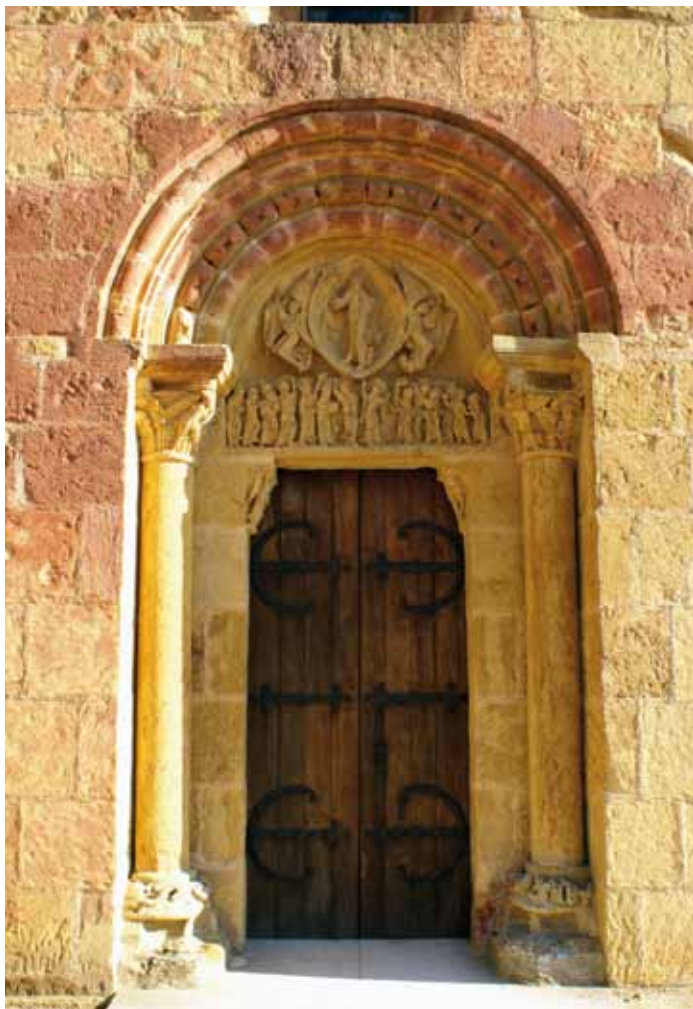
Fig. 1 - Montceaux-l'Étoile, église Saint-Pierre, portail ouest – vue générale.

Les apôtres sont répartis en deux groupes, placés de part et d'autre des hommes en blanc chargés de leur annoncer le futur retour du Christ. Légèrement plus grands que les apôtres, ils s'adressent à eux en penchant la tête dans leur direction et en leur montrant le tympan d'une main, la seconde tendue vers leurs interlocuteurs. L'ange à droite du Christ parle à un personnage imberbe, tenant un livre et devant la Vierge.