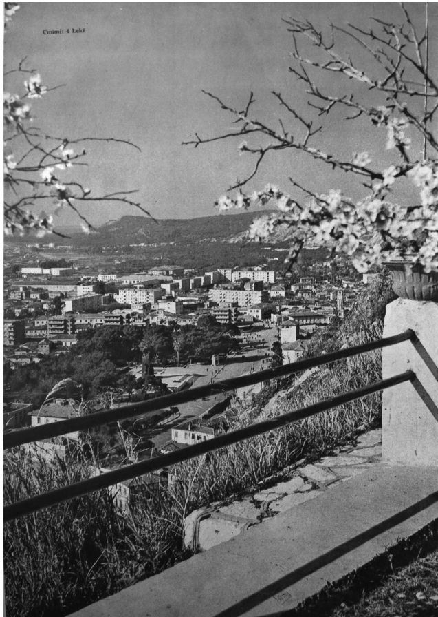
Photo 3 – Vue de Vlorë. Photographie de Petrit Çela publiée dans le magazine Ylli en avril 1976.

Comme le rappelle pertinemment Armanda Hysa, ce que l'on désigne sous le terme d'« histoire de l'ethnologie en Albanie » ne concerne finalement qu'un très petit groupe d'individus : entre trois et sept personnes selon les périodes [Hysa Kodra, 2014 : 23]. La critique ne peut donc ignorer la dimension personnelle et subjective des pratiques et des productions ethnologiques de l'époque, et il est important de retracer des parcours individuels afin de comprendre les enjeux des relations interpersonnelles dans le développement de la discipline. Pour cette raison, en contrepoint de ces trois