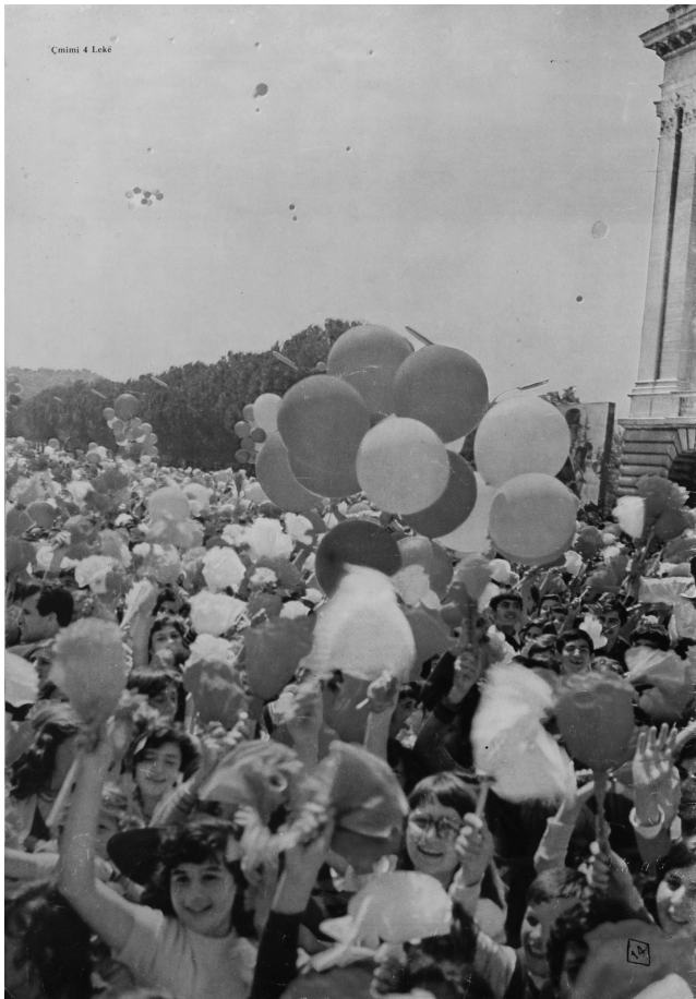
Photo 2 – Jour de fête.

Les ethnologues de la période communiste ont eu tendance à dévaloriser tout ce qui avait précédé, notamment les entreprises de collecte et de publication de matériel ethnologique et folklorique conduites dans l'entre-deux-guerres. Dans le même temps, soucieux de faire remonter aussi loin que possible les origines de l'« ethnie » albanaise, ils voyaient dans les auteurs antiques et médiévaux des sources pour l'ethnologie des Albanais. Avec le tournant nationaliste de la classe dirigeante, dans les années 1960,