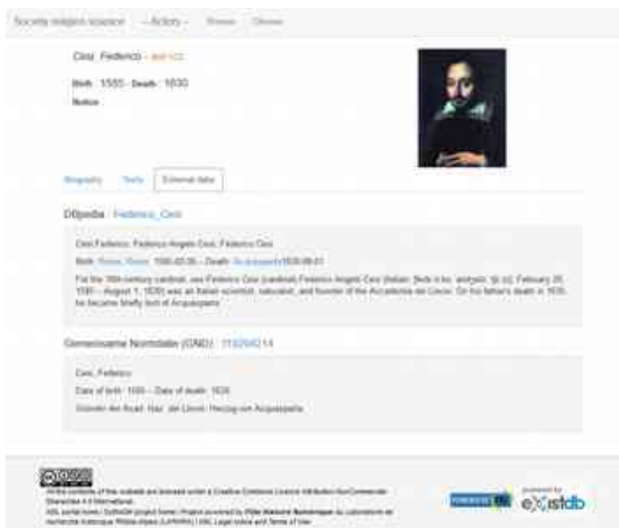
Figure 5. 'Fiche' d'un acteur

nous aimerions mettre en place un parcours de lecture fluide pour passer dans un même environnement du texte aux objets et aux unités de connaissance, pour rebondir enfin sur d'autres portions de textes, regroupées dynamiquement en fonction des intérêts du lecteur.