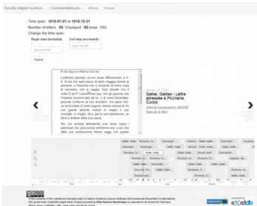
Figure 3. Frise chronologique de la correspondance de Galilée

Au niveau de la page d'accueil, le menu principal en tête de la page centralise la navigation vers les différents contenus de l'édition. On accède par l'onglet "Parcourir" (ou Browse) aux différents parcours de lecture : accès à l'ensemble des textes et à leurs métadonnées, aux listes des noms de personne ou d'institution, etc. Dans l'image ci-dessus, nous voyons un accès au texte par l'intermédiaire d'une frise chronologique interactive où chaque lettre de la correspondance de Galilée y est placée selon sa date (figure 3). En cliquant sur l'une d'elle, une fenêtre contenant le texte apparaîtra au-dessus et on pourra ainsi naviguer aisément d'une lettre à l'autre tout en suivant le déroulement temporel. Des hyperliens renvoient vers l'espace de lecture présentant l'annotation sémantique et, en attendant la mise en place d'un affichage de l'ontologie à l'intérieur du portail, vers la fiche correspondante du site symgih.org .