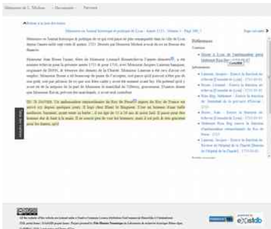
Figure 4. Interface de l'édition numérique des « Mémoires » de L. Michon

Concernant les Mémoires de L. Michon, les développements se sont portés sur l'espace de lecture (figure 4) divisé en deux parties : l'une centrale dédiée à l'affichage du texte et une latérale où sont présentées la liste des liens avec les objets et les unités de connaissance de la base de données. Au passage de la souris sur l'une de ces informations, la partie du texte qui a été encodée et identifiée est surlignée en couleur. La table des matières à gauche, qui affiche les subdivisions mensuelles, permet de naviguer dans le texte selon son déroulement chronologique. À l'heure où nous écrivons ces lignes, l'interactivité globale reste encore limitée mais à terme