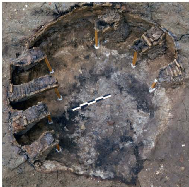
Fig. 4 : Four à barres S12 transformé en four à arceaux (trous de barres dans la première paroi d'argile, emploi de barres dans les arceaux).

Aucun dépotoir de potier véritable (testar) n'a été mis au jour en dehors du comblement des fours et de leur fosse d'accès. Les rebuts de cuisson retrouvés en abondance (biscuits ou glaçurés) donnent une première idée de la variété des productions qui sont réalisées pour la plupart en pâte calcaire glaçurée et émaillée. Le répertoire des formes rappelle les typologies du sud de l'Espagne et de l'aire siculo-maghrébine (coupes (fig. 6a), pichets (fig. 6a et b), bassins, mesures (fig. 6c), lampes (fig. 6d), tirelires (fig. 6e), petites jarres (fig. 6f), carreaux de pavement, tuyaux de canalisation,...). En Ligurie, une production de proto-majoliques d'influence sicilienne vient d'être attestée au début du XIIIe siècle par les analyses physico-chimiques (Milanese 1982a, 1982b). Cet atelier urbain polyvalent, produisait des céramiques culinaires à pâte rouge réfractaire, de la vaisselle de table en argile calcaire ainsi que de nombreux objets utilitaires et des carreaux de pavements monochromes et historiés de plusieurs modules (fig. 7). L'étude du matériel permettra d'établir la typologie de ces productions très diversifiées dont la diffusion reste encore inconnue dans les fouilles provençales.