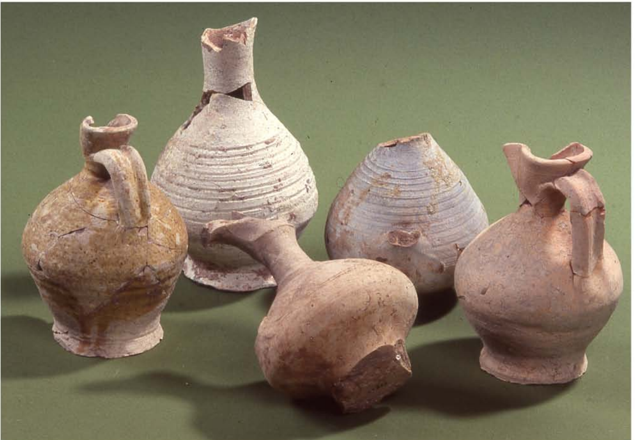
Fig. 6b : Productions : Pichets.