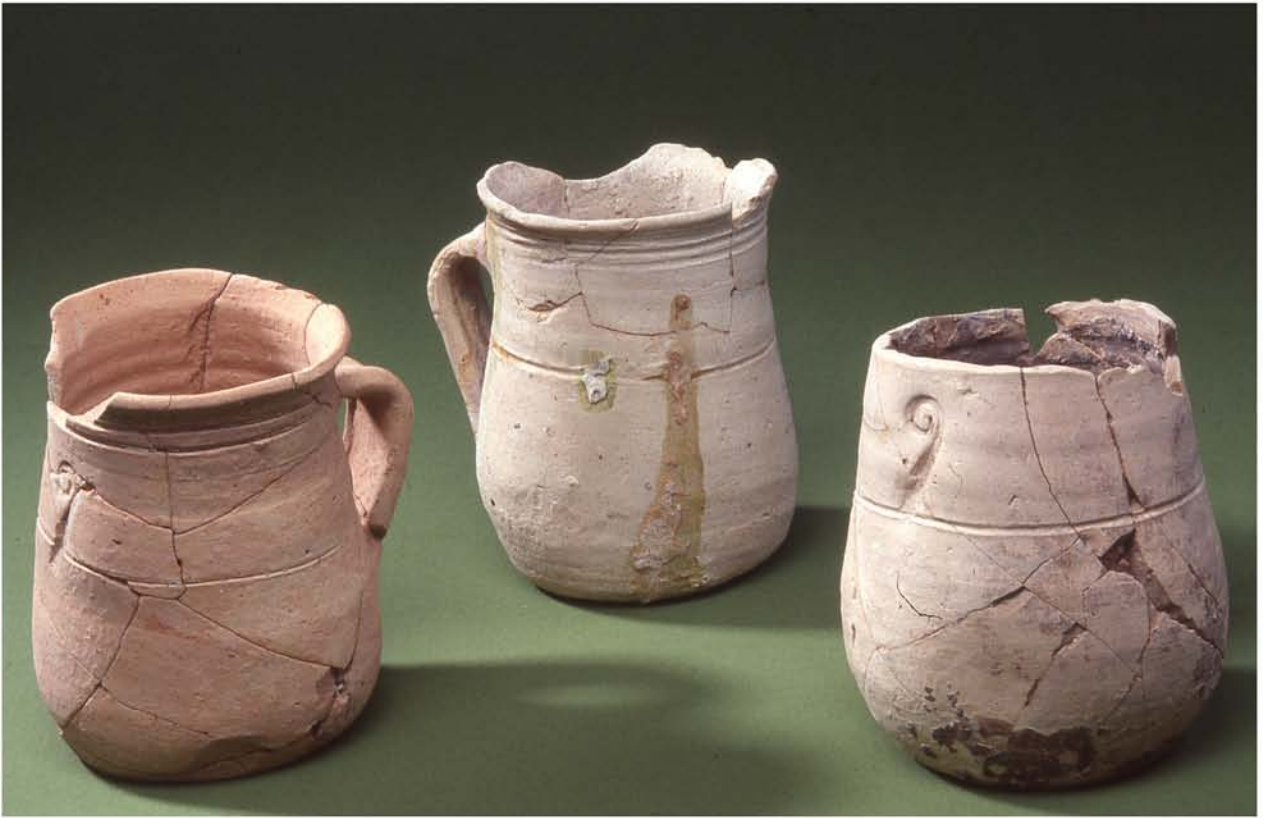
Fig. 6c : Productions : Mesures marquées d'une croce.