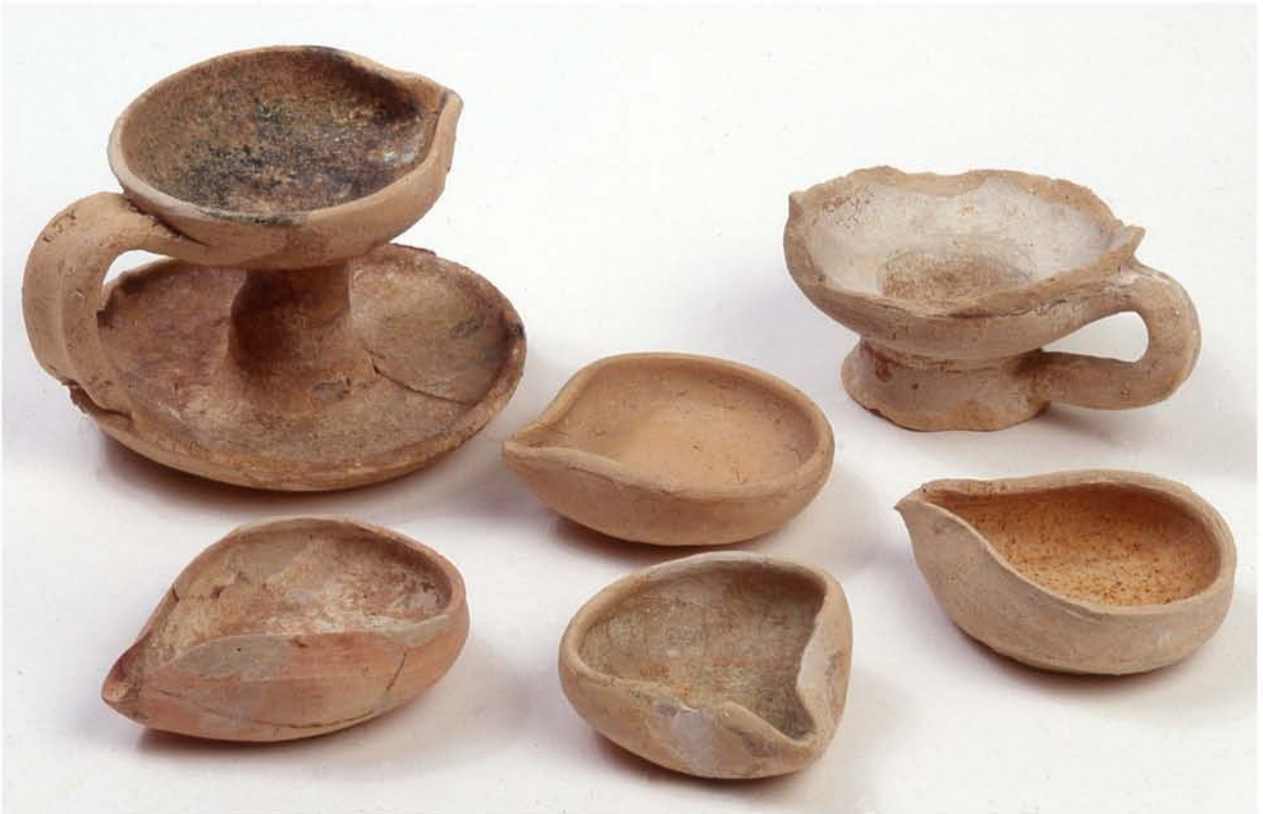
Fig. 6d : Productions : Lampes à huile.