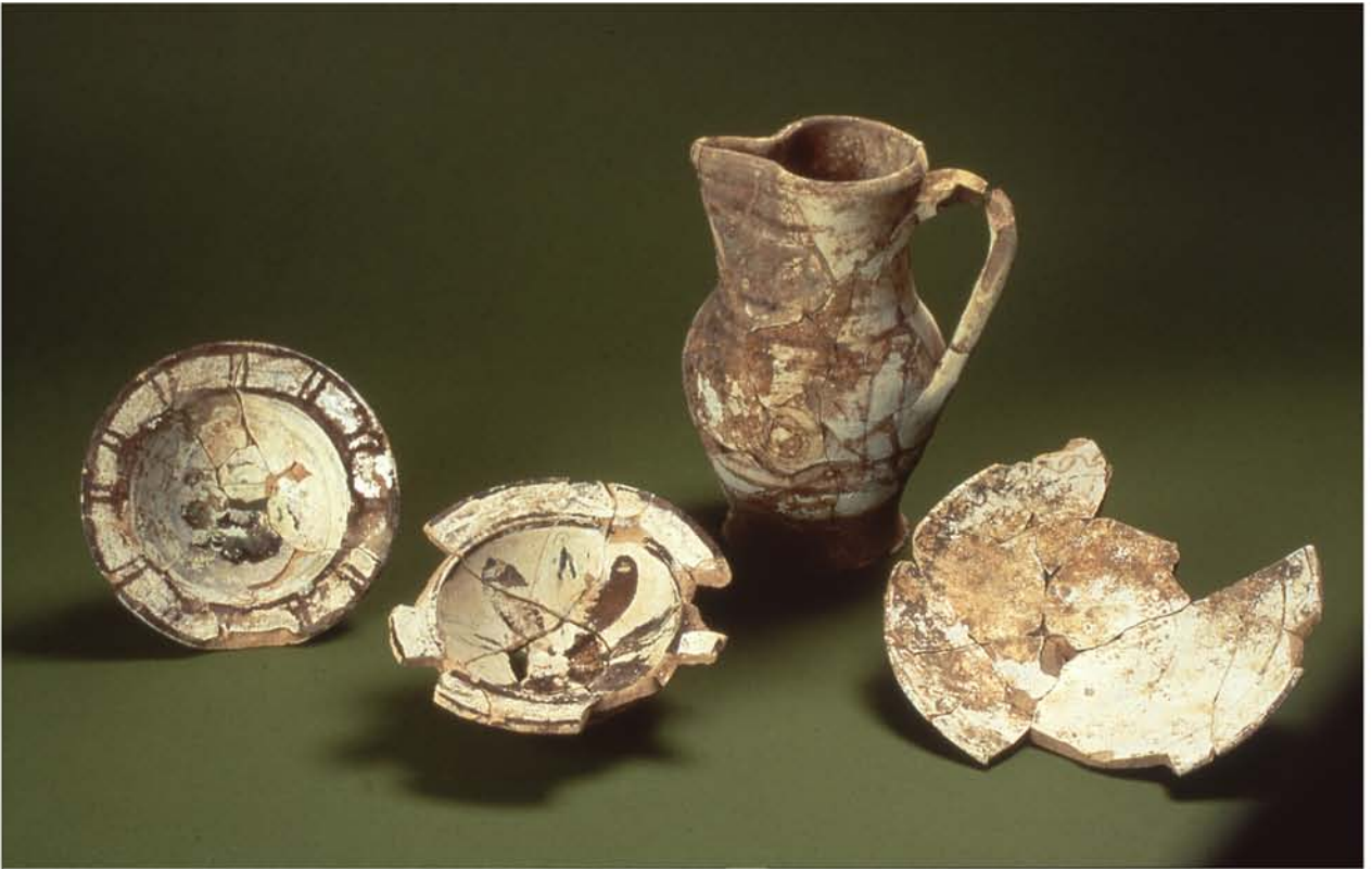
Fig. 6a : Productions : Majoliques à décor émaillé polychrome.