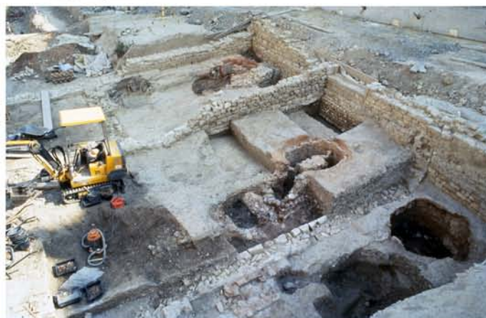
Fig. 2 : Ensemble des espaces sud en cours de fouille.

Au total treize fours ont été découverts concentrés dans les espaces X, XI et XIV (fig. 2). Dix fours à céramiques sont de plan circulaire à tirage vertical ou semi-vertical et d'assez petit module. La sole est constituée d'arceaux