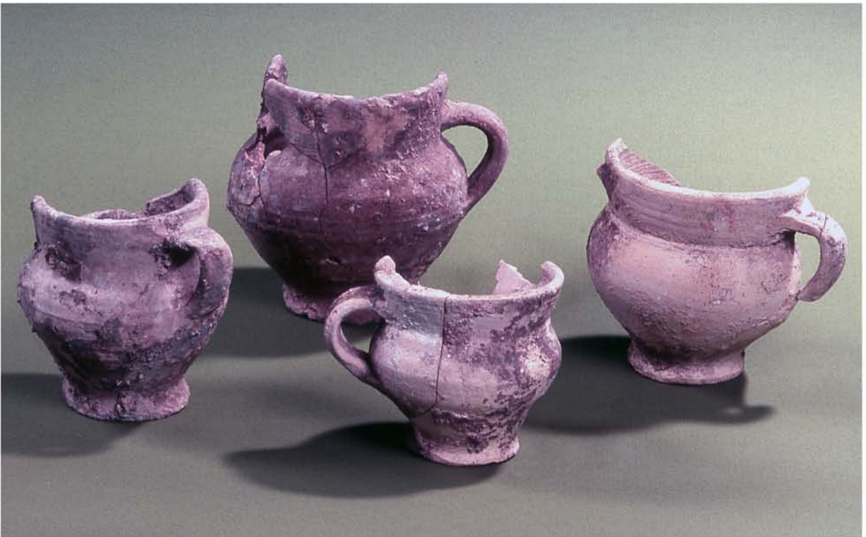
Fig. 6f : Productions : Petites jarres.