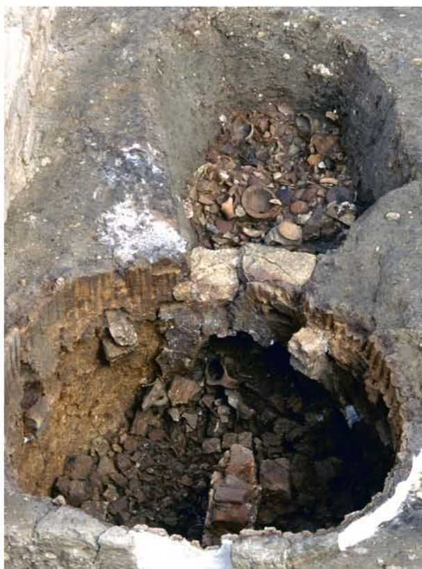
Fig. 3 : Dépotoir d'abandon du four S107.

transformé en four plus classique à sole portée par 4 arcs parallèles.