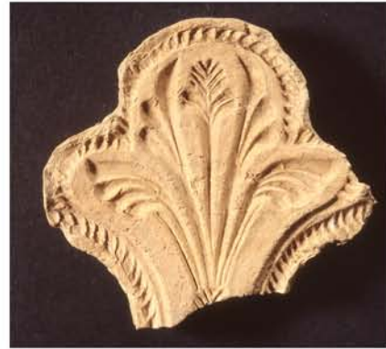
Fig. 5 : Productions : moule (échelle 1/1).