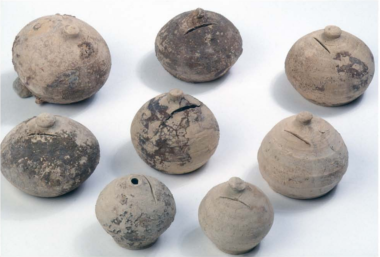
Fig. 6e : Productions : Tirelires.