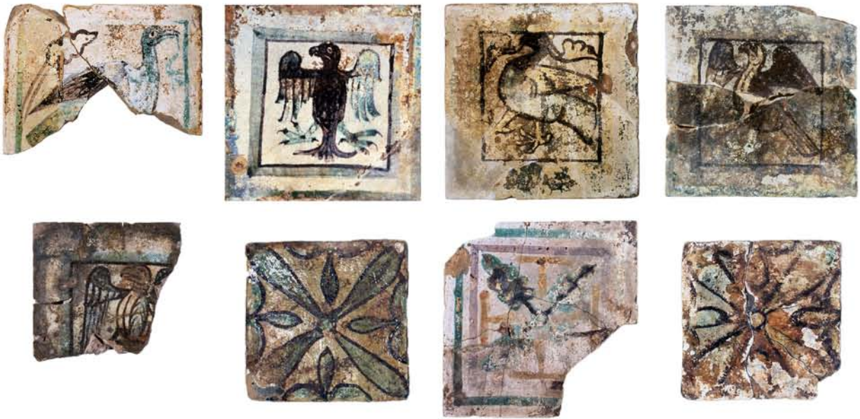
Fig. 7 : Productions : carreaux émaillés à décor vert et brun (deux modules : 12 et 15 cm de côté).