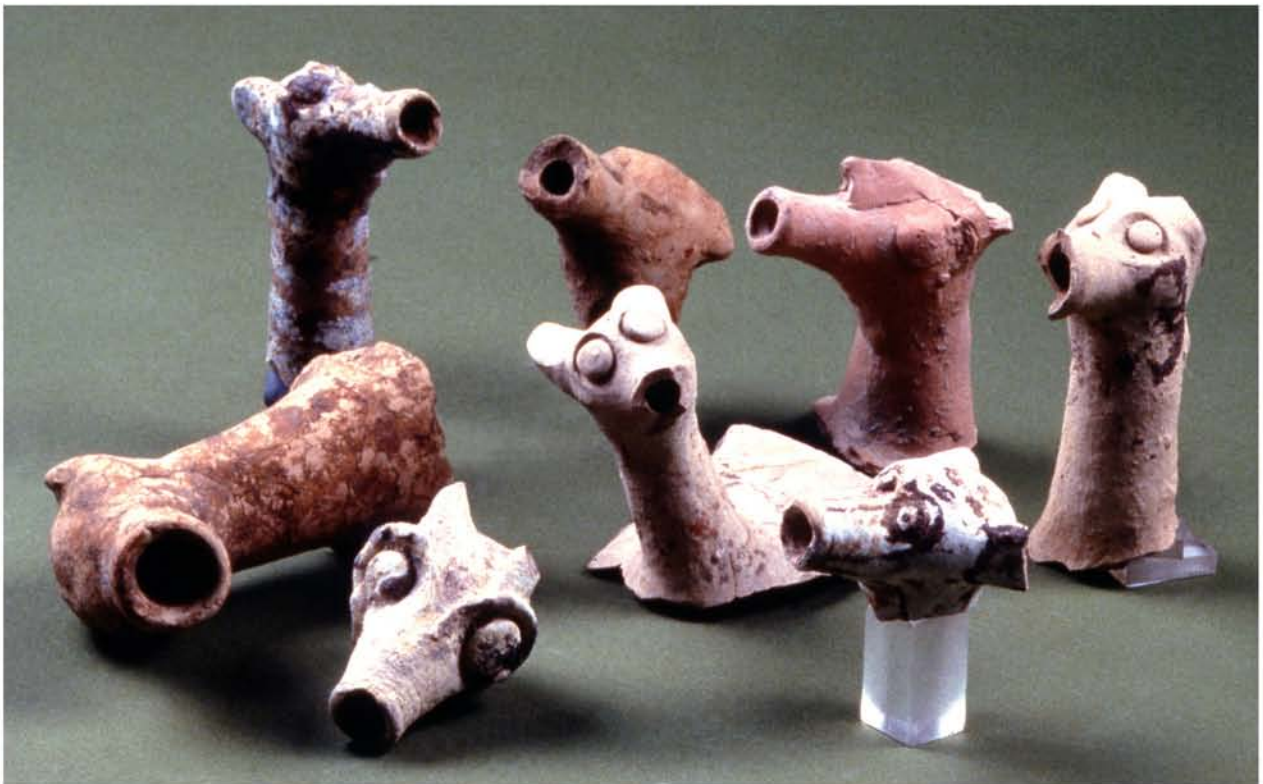
Fig. 8 : Productions : c- Becs verseurs zoomorphes dans la tradition de l'aquamanil andalou.