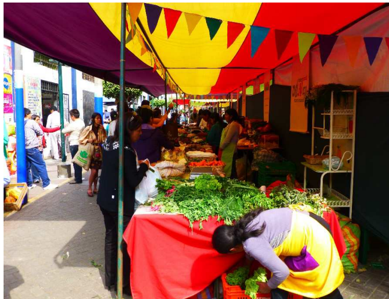
Figure 2: Etal de la bioferia de Miraflores.