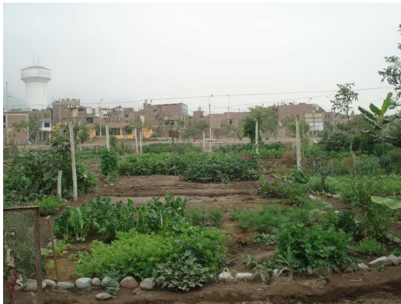
Au 1 er plan, ensemble de plante maraîchères : céleri branche, blette, fenouil. A l'arrière-plan, quartier résidentiel de Comas, périphérie Nord de Lima

Les jardins agricoles permettent ainsi à une population aux revenus limités d'avoir accès à des produits frais, variés, réputés de qualité et susceptibles d'être vendus sur les marchés de producteurs de la ville, qui s'adressent généralement à des populations de classes supérieures. Ainsi, les jardins communautaires participent d'une plus grande équité en ce qui concerne l'accès à des produits frais, en produisant pour les jardiniers d'une part, mais aussi pour les voisins directs. Les jardins urbains permettent ici de répondre à un double enjeu quantitatif et qualitatif : ils assurent à la fois une meilleure accessibilité aux aliments et une plus grande diversité alimentaire. On peut rattacher le cas Liménien à ce que l'on observe aux Etats-Unis et au Canada, où les jardins communautaires et collectifs connaissent un succès croissant. Créés principalement dans les quartiers pauvres des grandes villes, ils répondent à la fois à des problèmes de manque d'infrastructure de distribution de