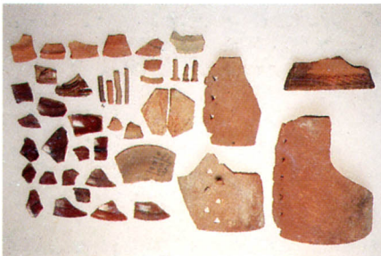
Fig.129 : Artifices de cuisson, tomette, biscuits imitant Albisola et fragments d'assiettes à taches noires.